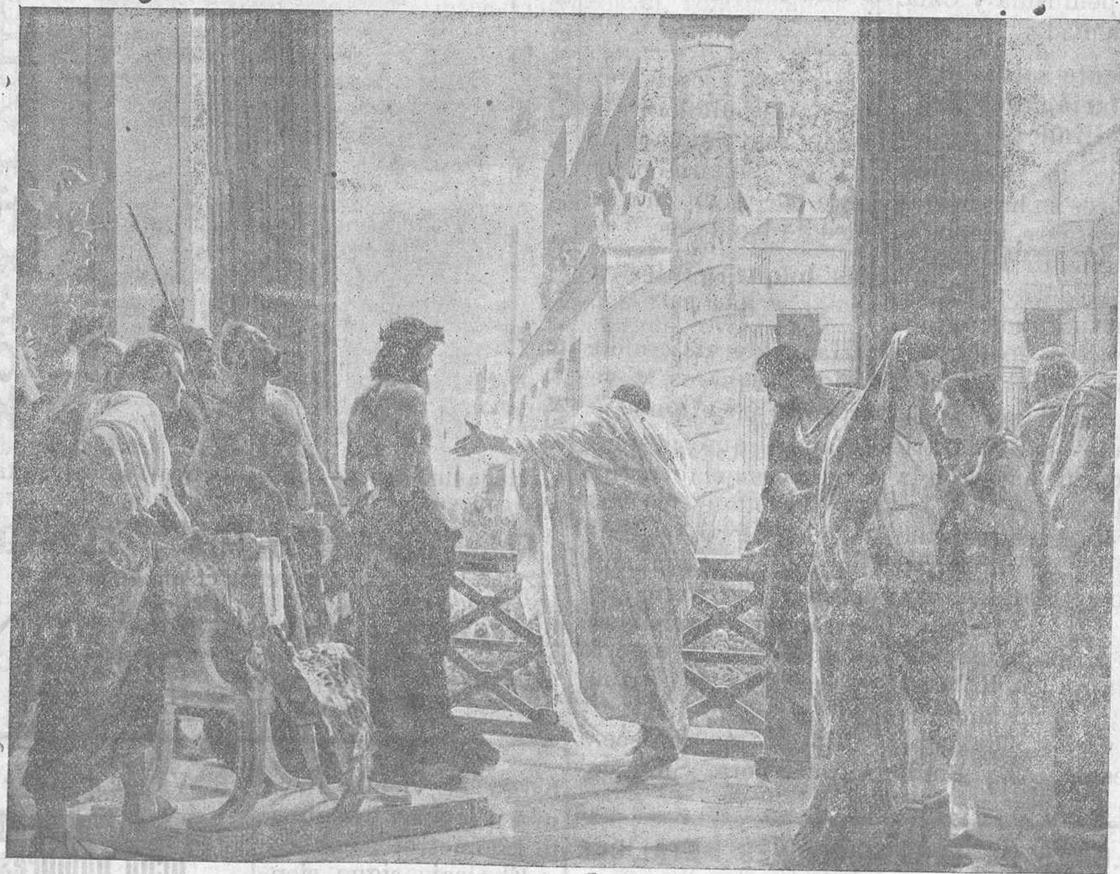
...Sentencia de Pilatos es pecado mortal.

cuentra; en vano le han buscado los siervos de Obid y los soldados de Septimus.