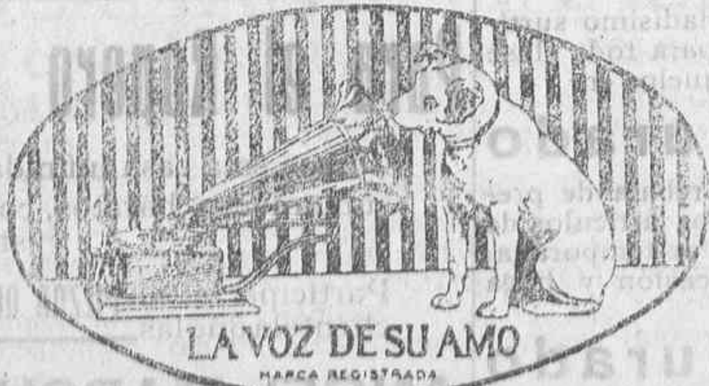
LA VOZ DE SU AMO

Relojes Longines, Omega, Cyma, Roscoff, etc., etc.