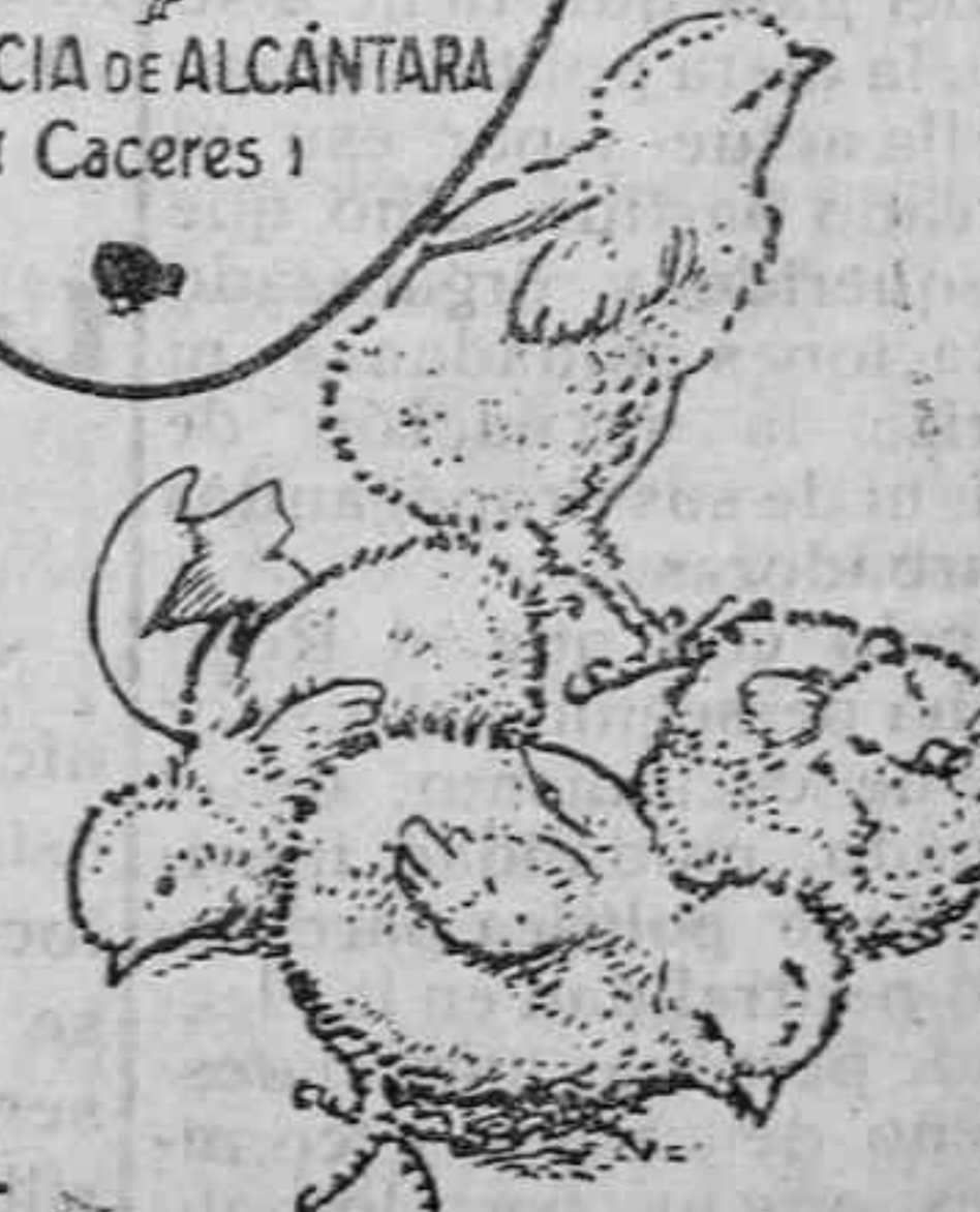
Polluelos recién nacidos