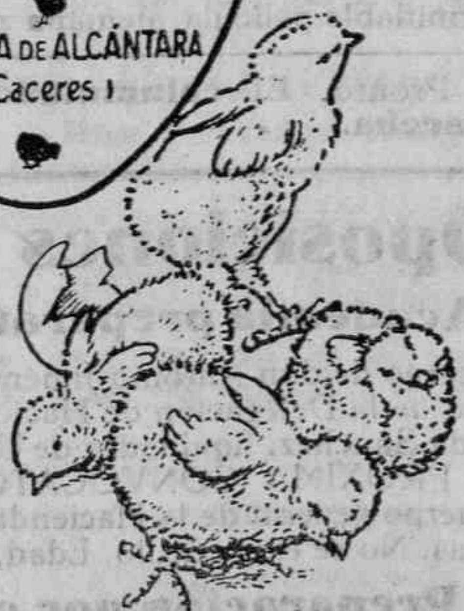
Polluelos recién nacidos