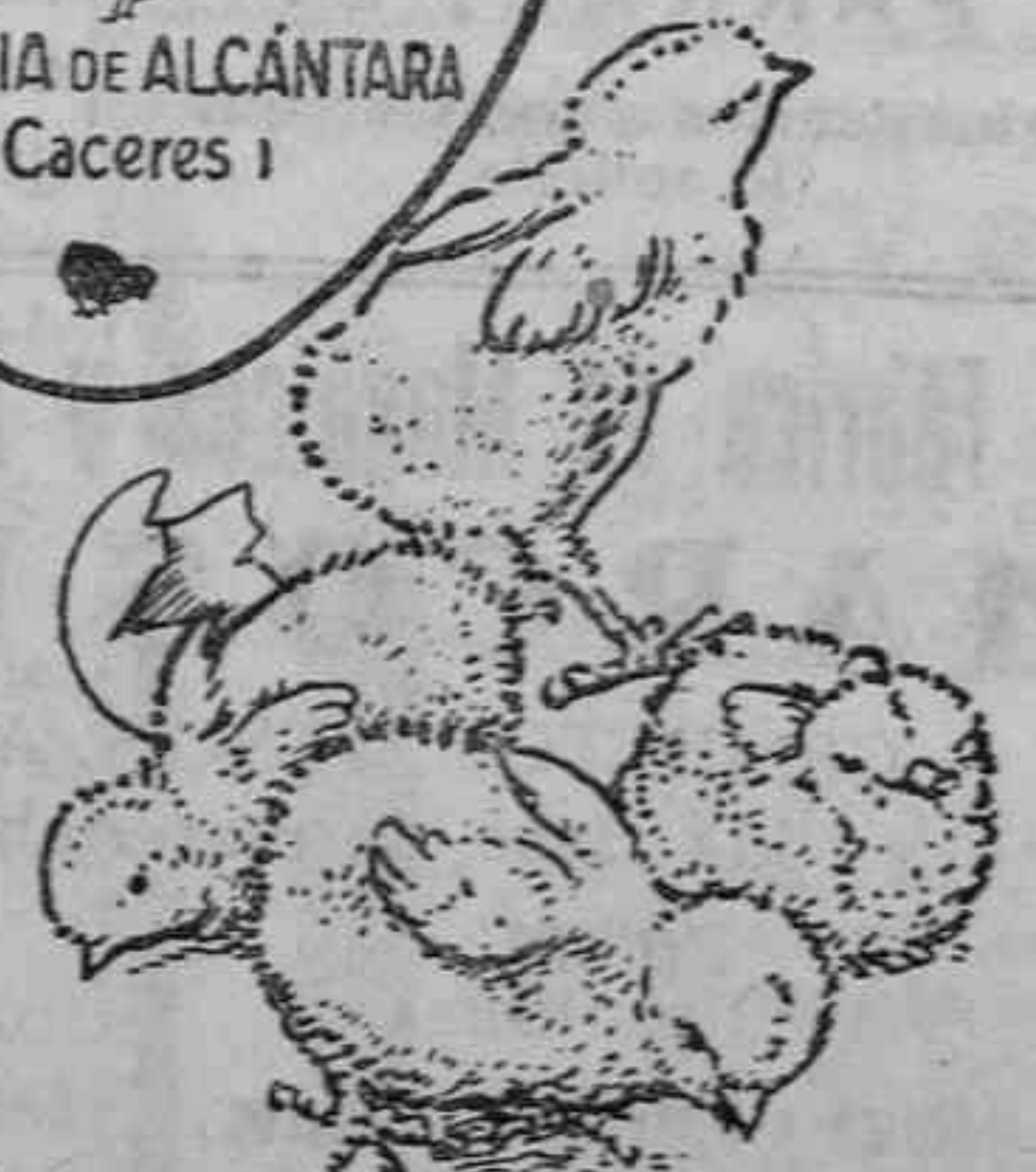
Polluelos recién nacidos