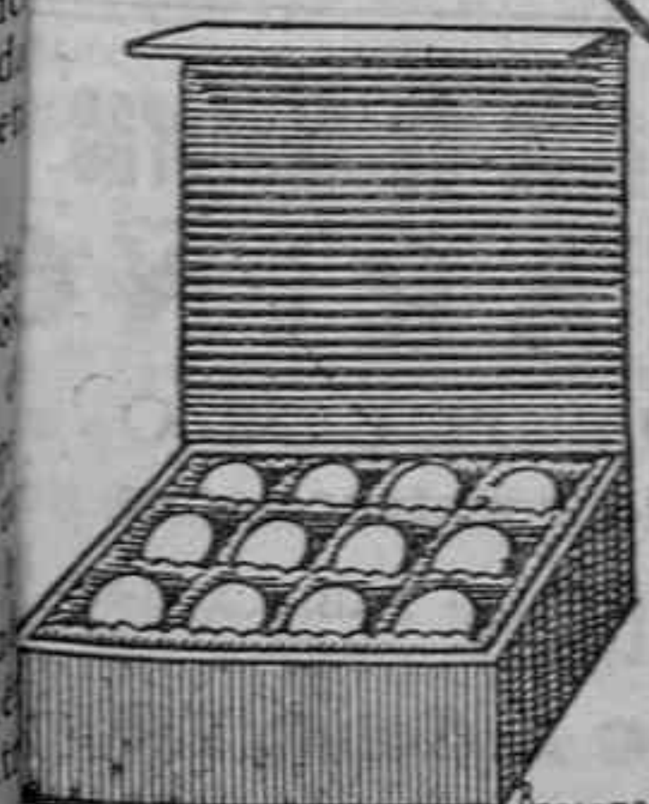
Huevos para incubar.