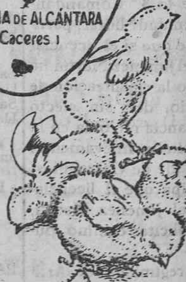
Polluelos recién nacidos