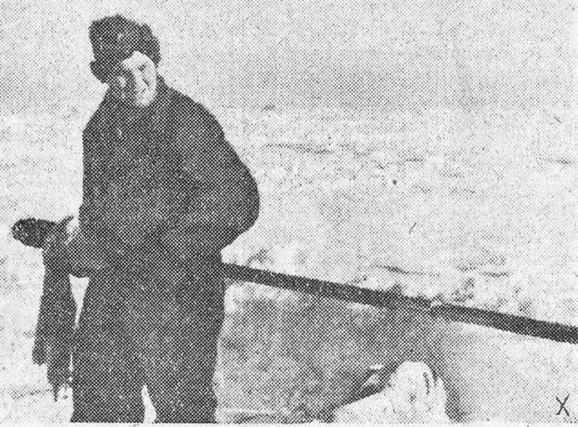
En las operaciones de limpieza de cañones pesados antiaéreos en las glaciales temperaturas de los sectores del Norte del Frente Oriental.