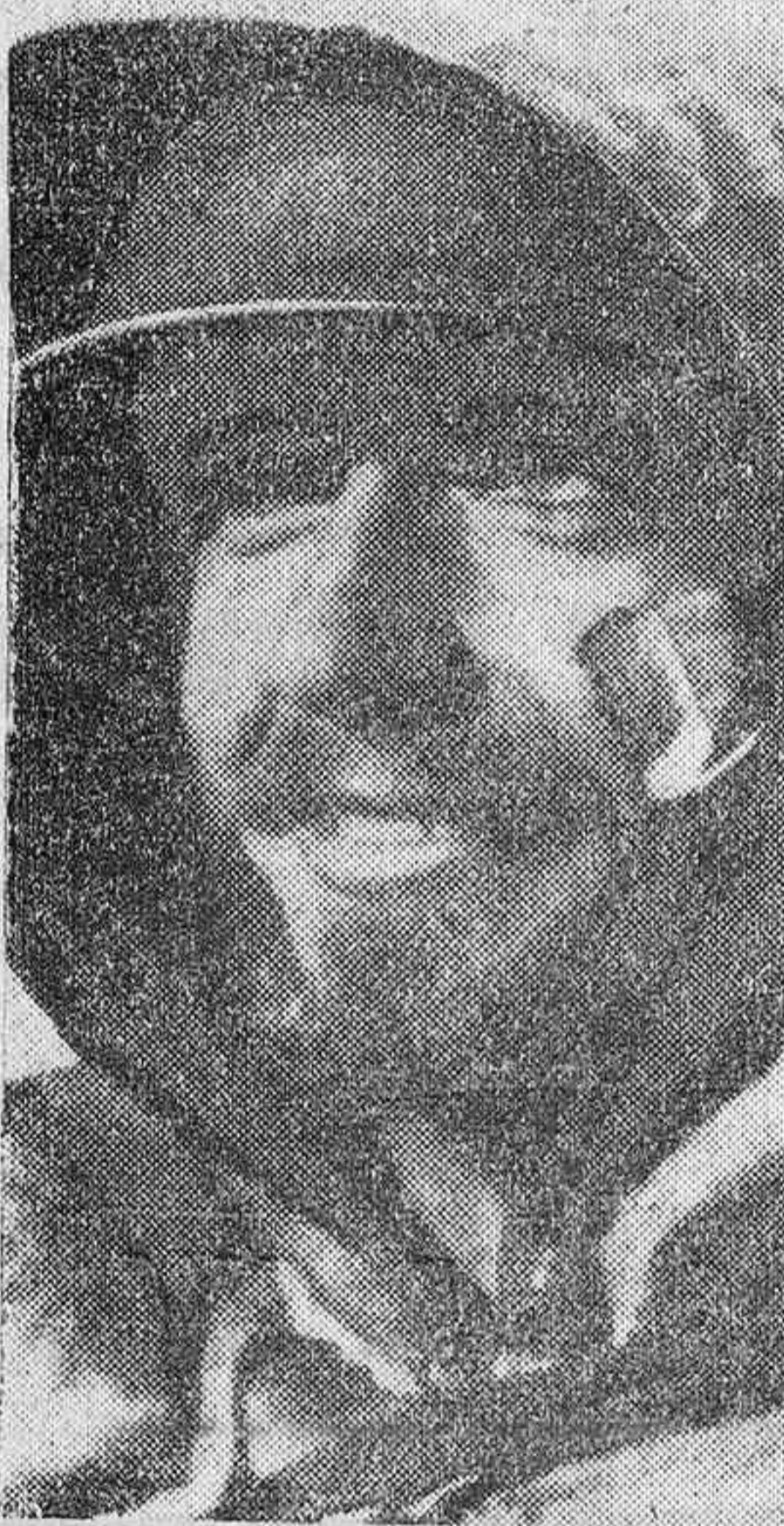
Uno de los defensores de las posiciones alemanas en el Frente Oriental.