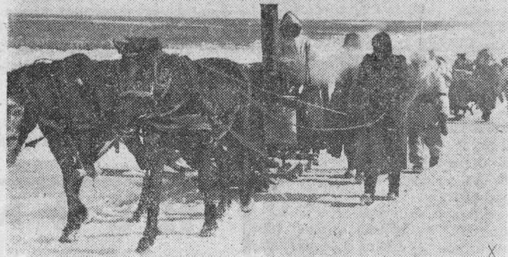
Las cocinas de campaña son arrastradas por trineos en los campos de batalla del Este.

Se ha agotado la ofensiva soviética en STARAYA RUSA