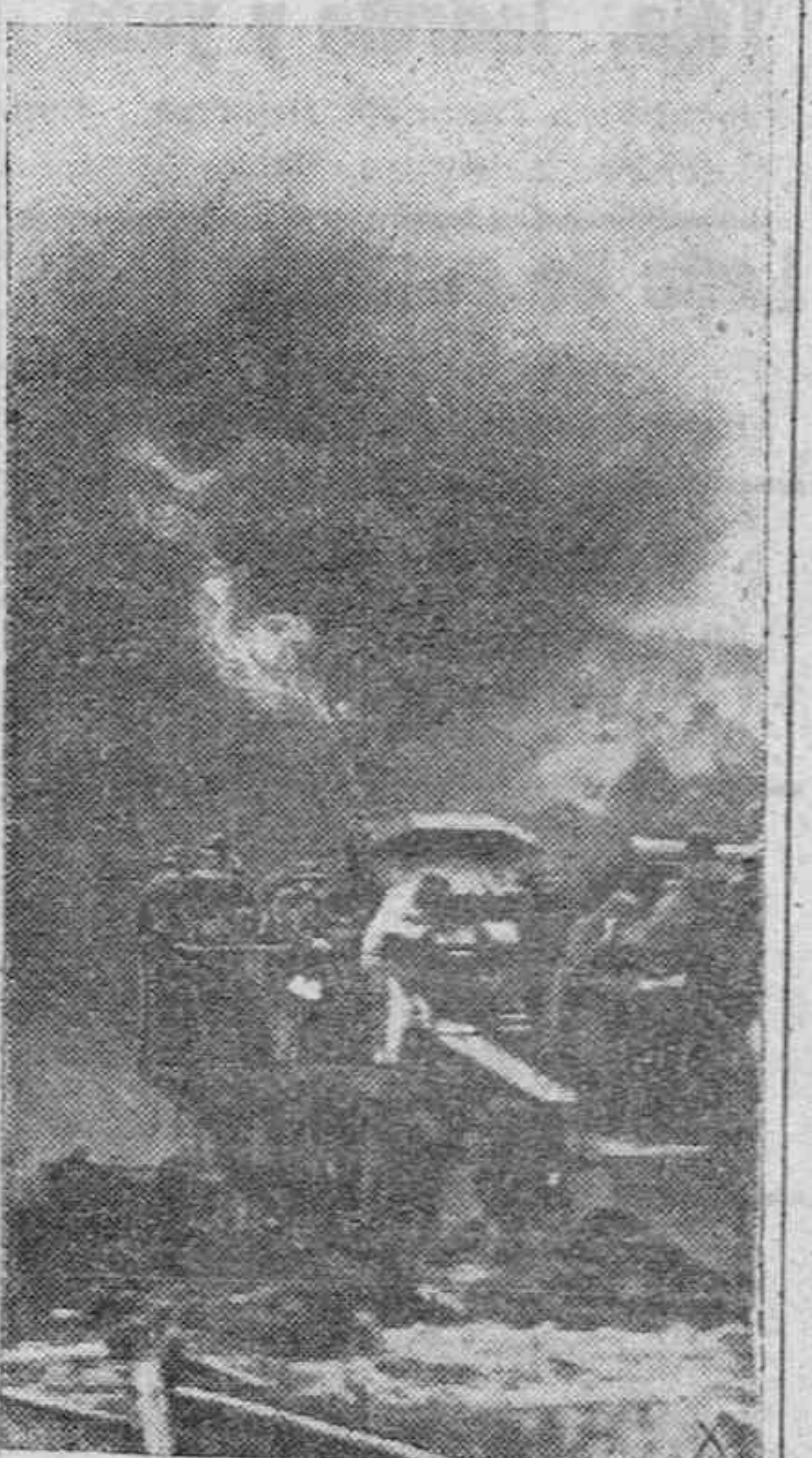
Batería antiaérea alemana emplazada sobre un tren protege a los zapadores durante su trabajo.