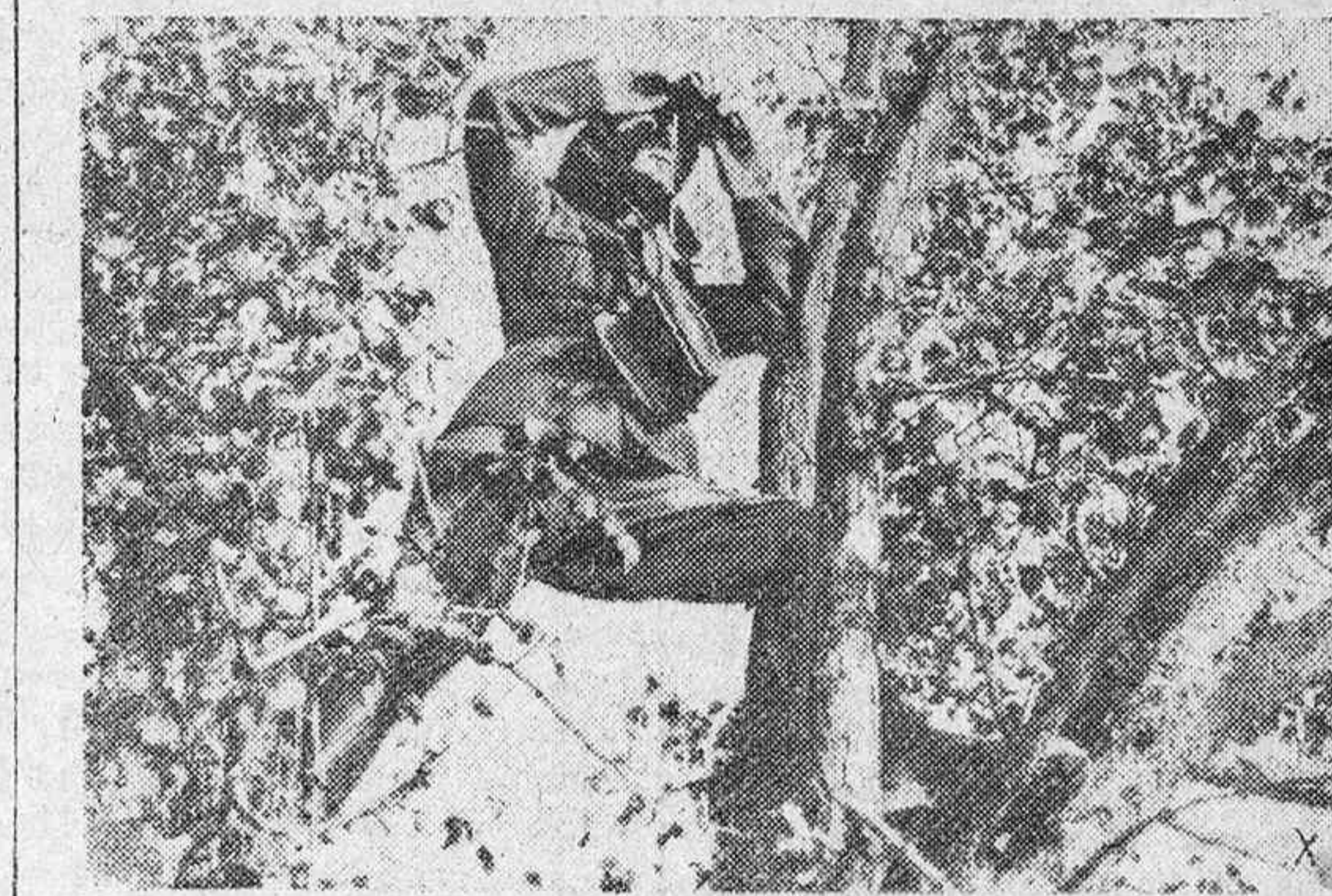
Un oficial observador de artillería comprueba la efectividad del tiro de una de las baterías.

A. Funeraria d. V. Lazurica.—Correría, 17.—Telf. 1345