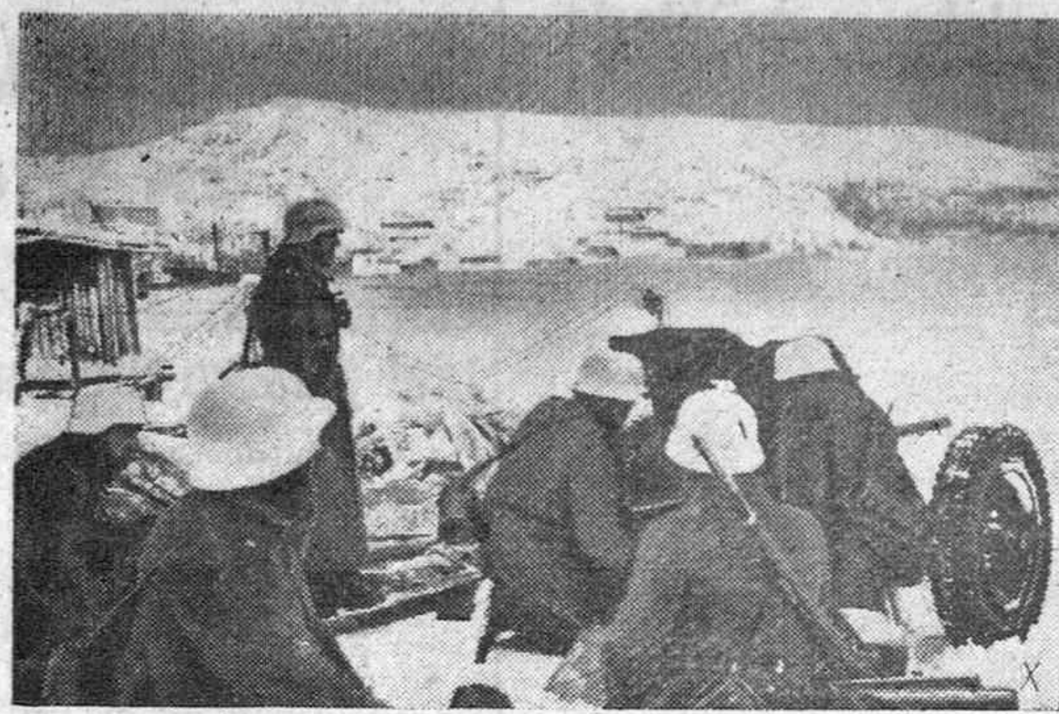
Con el fuerte frío, los soldados alemanes están siempre en guardia para rechazar ataques del enemigo. Artillería alemana antitanque es emplazada y protege el puerto del mar polar