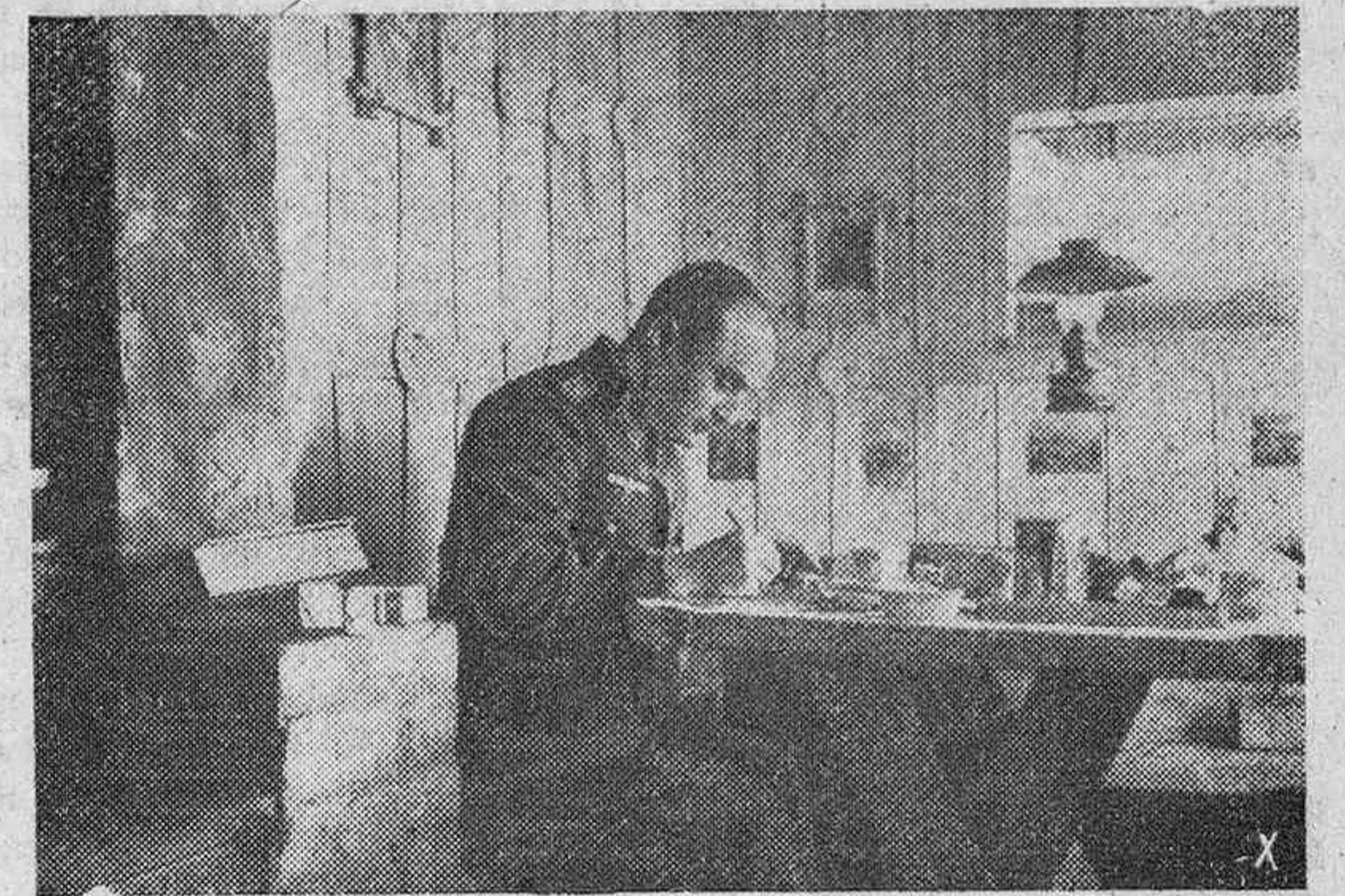
Durante el crudo y largo invierno ruso, la vida de los soldados alemanes se hace más llevadera en estas casas de madera, construidas por sus propias manos y que son calientes y limpias.