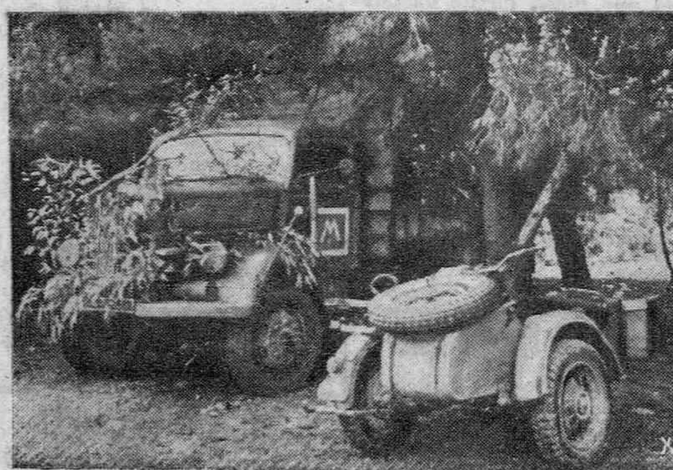
Camiones alemanes de aprovisionamiento bien confluados ante la vista del enemigo, esperan orden de partir