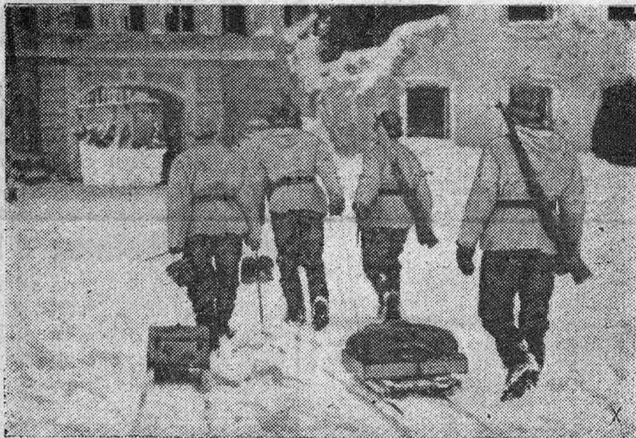
Los soldados alemanes con sus pequeños trineos con víveres y municiones pasan los patios de los antiguos castillos de los zares