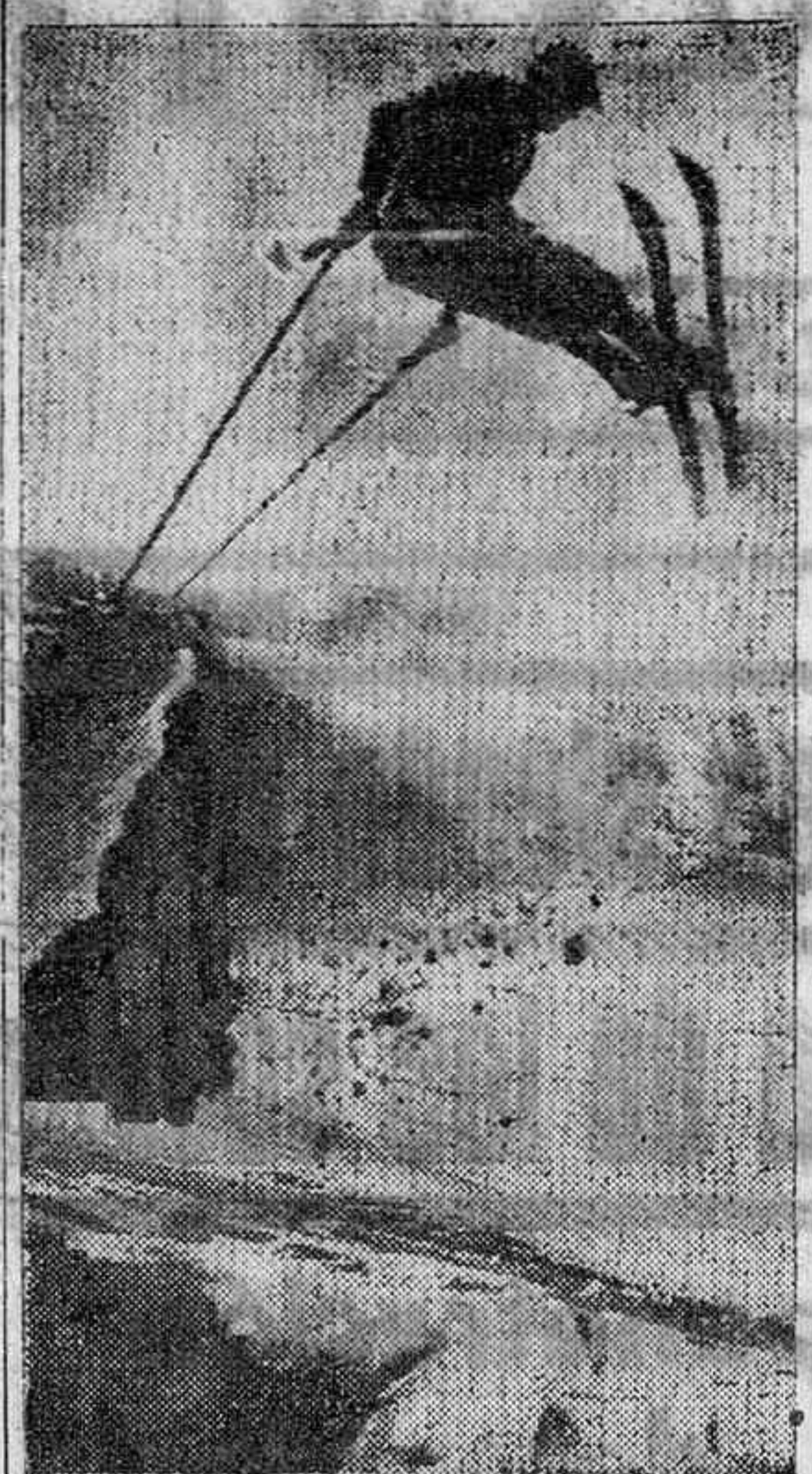
El esquí es el deporte favorito en estos meses de invierno, teniendo el mismo muchos partidarios. He aquí un magnífico salto.