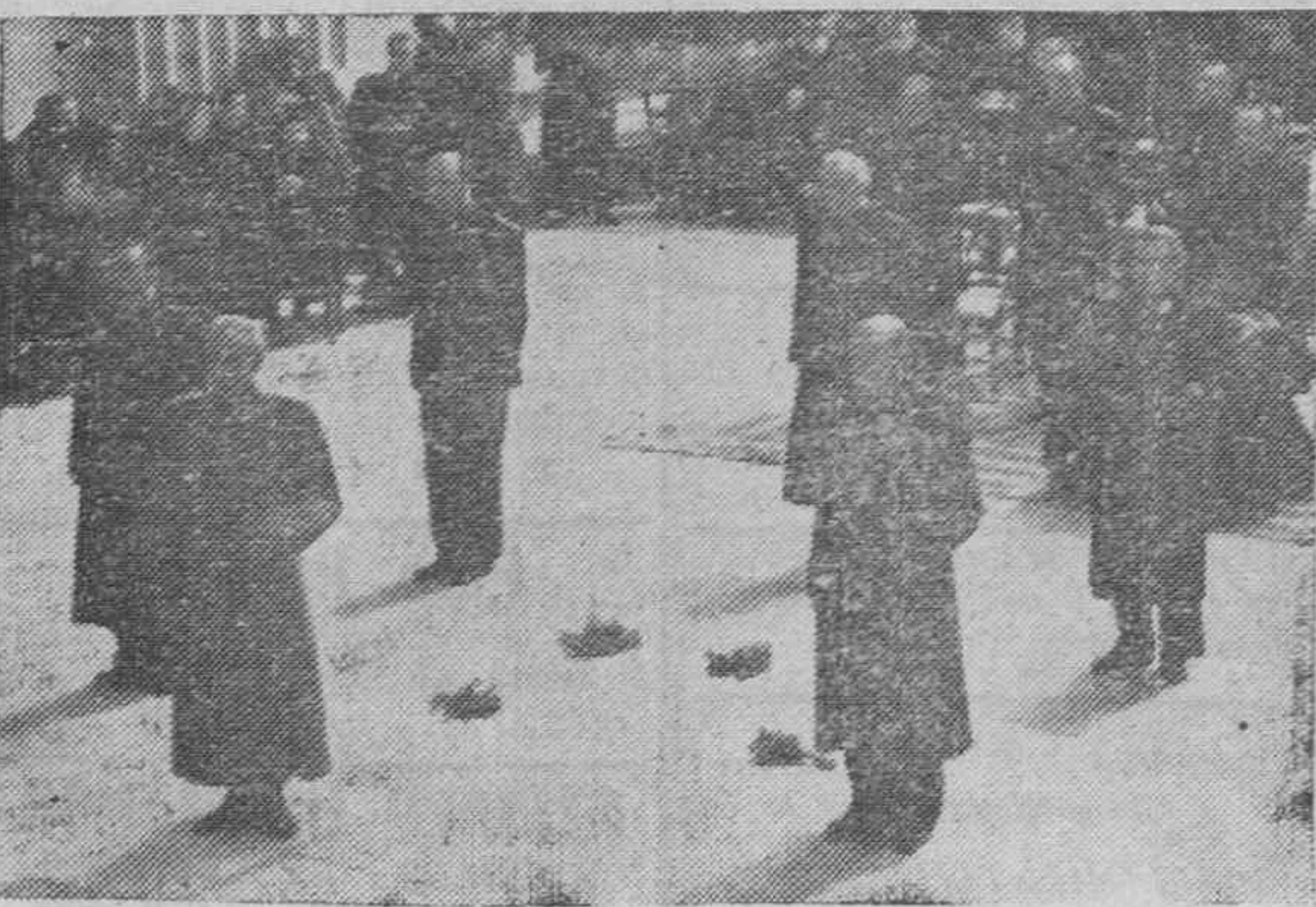
Los Jefes Provinciales que asisten al Consejo Nacional rinden un homenaje al Fundador ante su tumba de El Escorial.