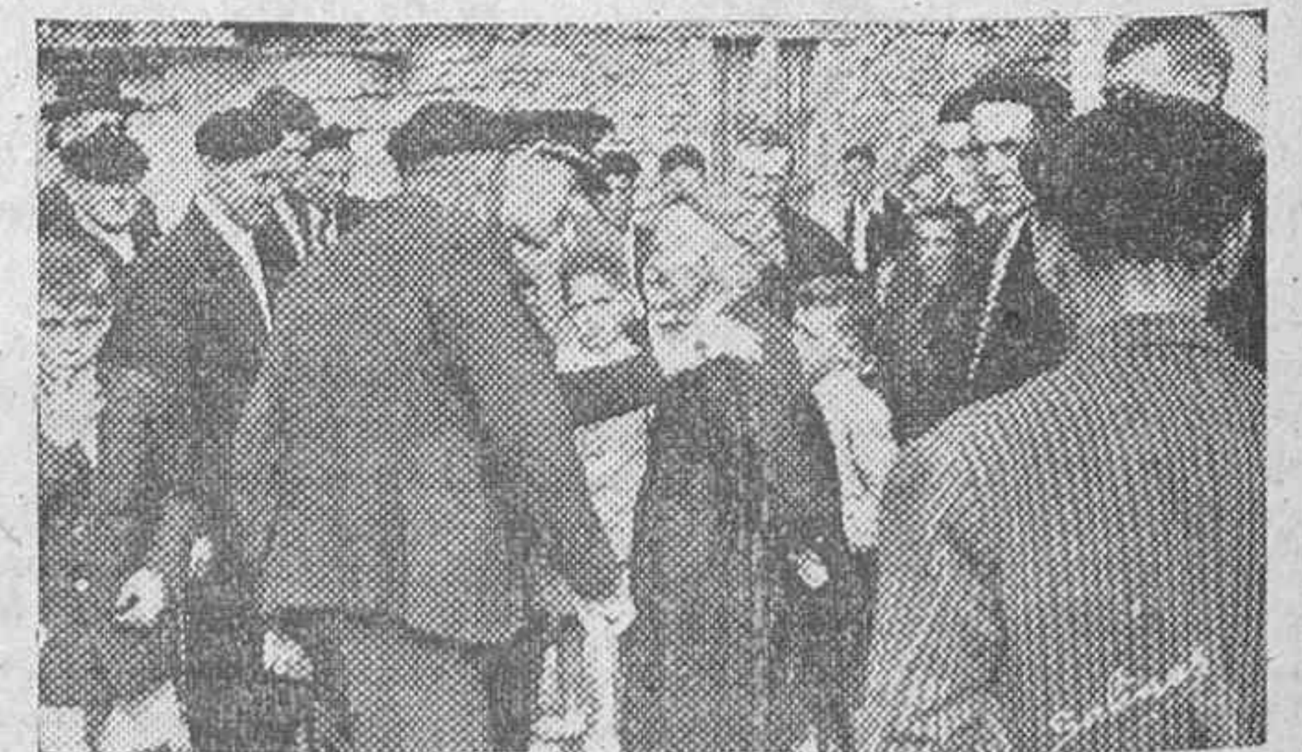
Un veterano carlista es saludado a su paso por el pueblo por el Gobernador y Jefe Provincial, el cual conversa con el superviviente de pasadas gestas.

Señaló lo hecho por el Movimiento desde el 18 de julio y reprimió a los liberales y marxistas y a los gobernantes del período republicano, terminando por pedir a todos su más inquebrantable adhesión hacia la persona de la primera autoridad de la Provincia, representación del Caudillo y Jefe Nacional y en