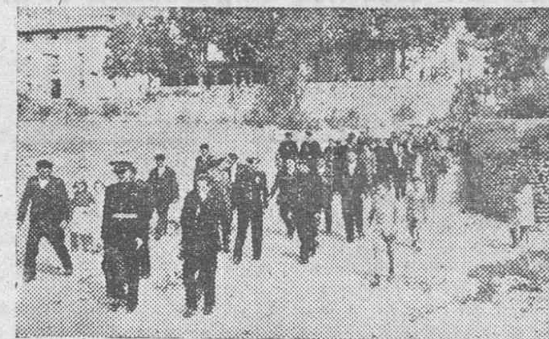
Al frente de la autoridad es locales y Jerarquías, el Gobernador civil y Jefe Provincial se dirige a la iglesia parroquial.

El Gobernador, acompañado por el resto de las autoridades y jerarquías, subió a la terraza preparada al efecto para desde la misma dirigir la palabra al pueblo. En su parte, frontera apartada dos grandes banderas nacionales junto con los emblemas del