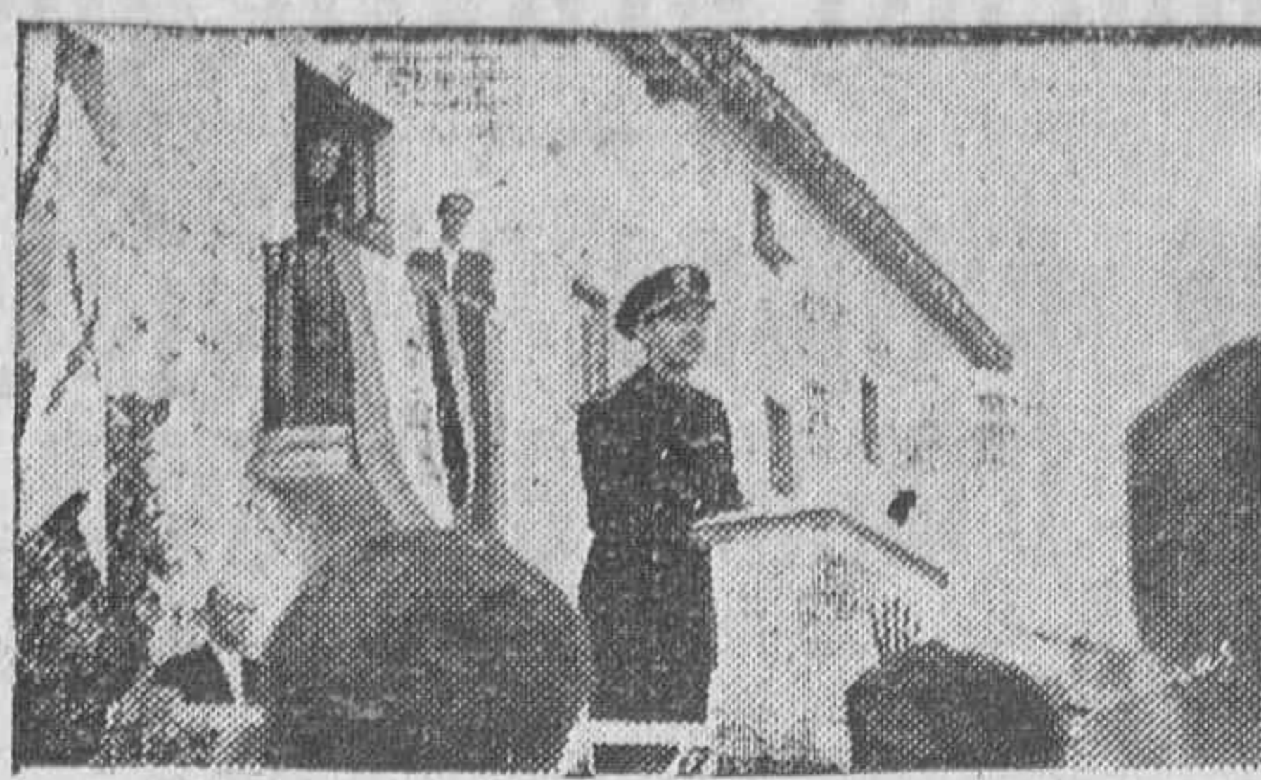
El Gobernador civil y Jefe Provincial dirigiendo su palabra al pueblo reunido ante él.

Producción yanqui. Interpretes: Cary Grant, Irene Dunne. Corto comentario merece esta cinta norteamericana estrenada ayer en el Nuevo Teatro. Sin apenas argumento y basándose en una incidencia de la vida que no puede estar acorde con nuestros sentimientos humanos y morales, ya que en el sacrificio y en el dolor se forjan las almas, y en la película pasa todo lo contrario, van pasando escenas muy bien logradas y traídas y otras no de tanta jocosidad como se las quiere revestir. Irene Dunne no brilla como en "Roberta"; pero sin embargo es lo sufi-