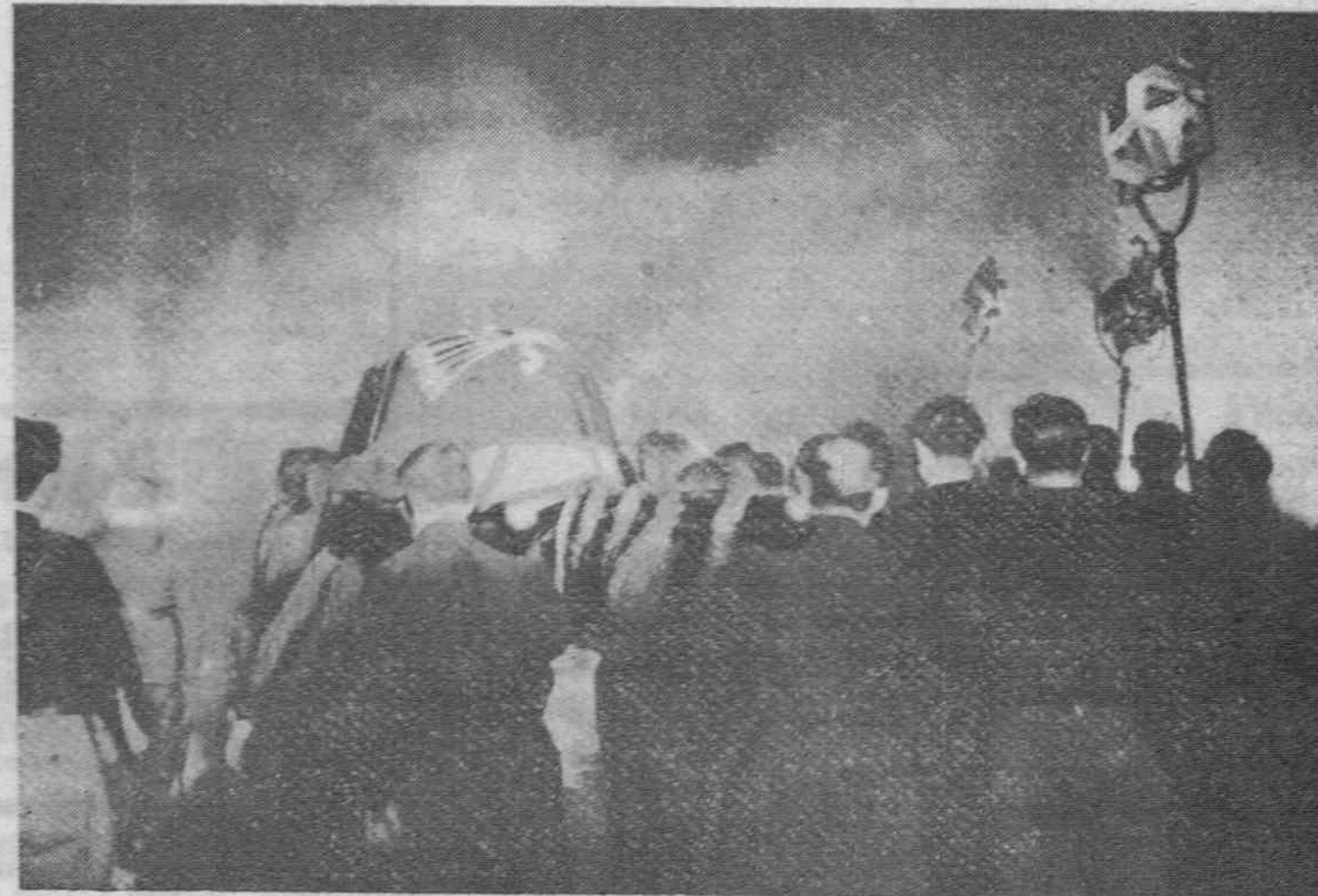
Ahora hace precisamente tres años, en relevos turnantes, los restos del Fundador de la Falange llegaban, a hombros de viejos camaradas, al Monasterio de San Lorenzo del Escorial, para ser definitivamente inhumados en la severa mole arquitectónica herreriana.