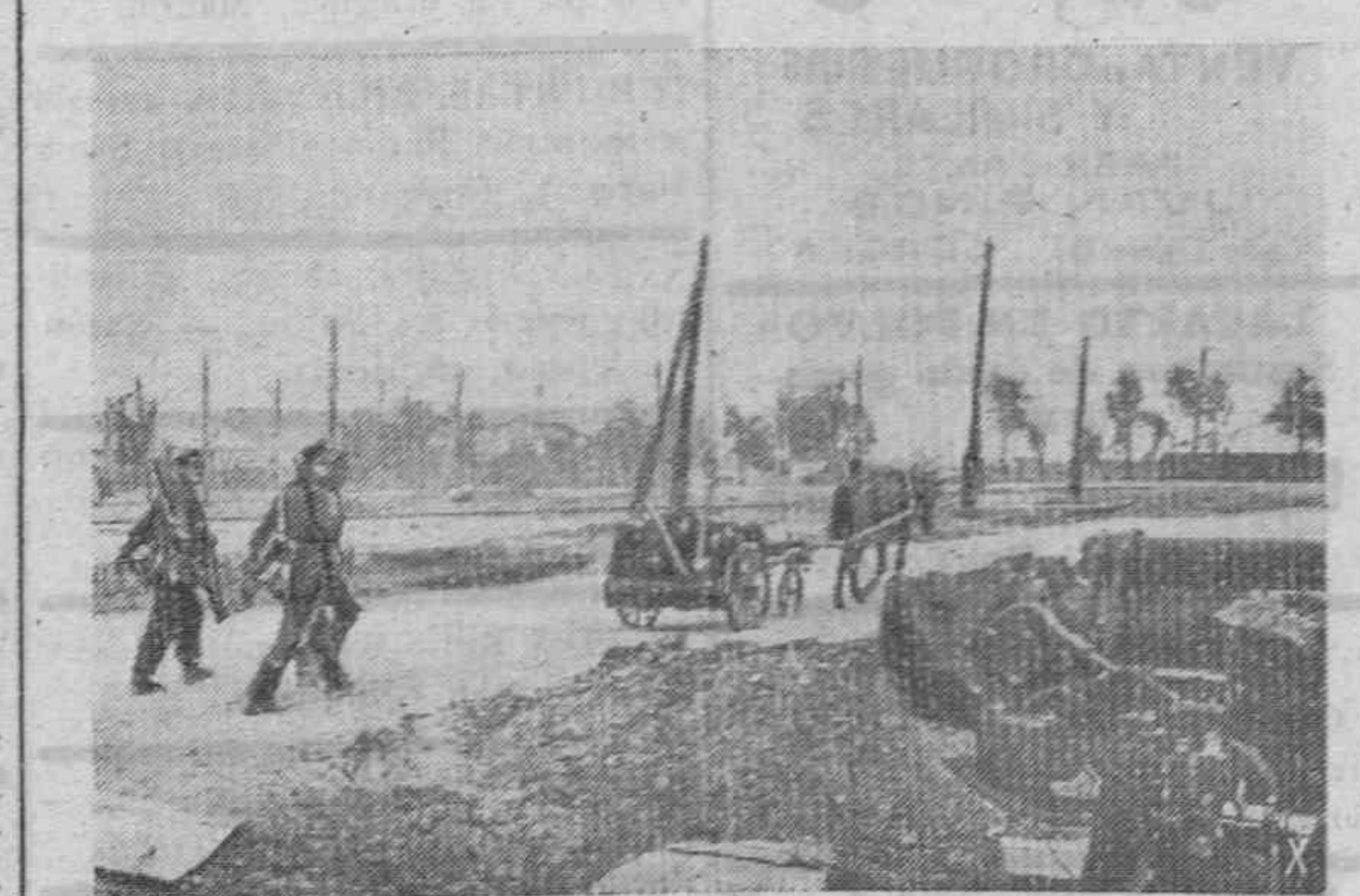
Patrulla alemana de infantería recorriendo un barrio de Stalingrado, en misión de vigilancia. De la gran ciudad del Volga ya les queda muy poco a los bolcheviques, para los que ha perdido totalmente su gran valor industrial.