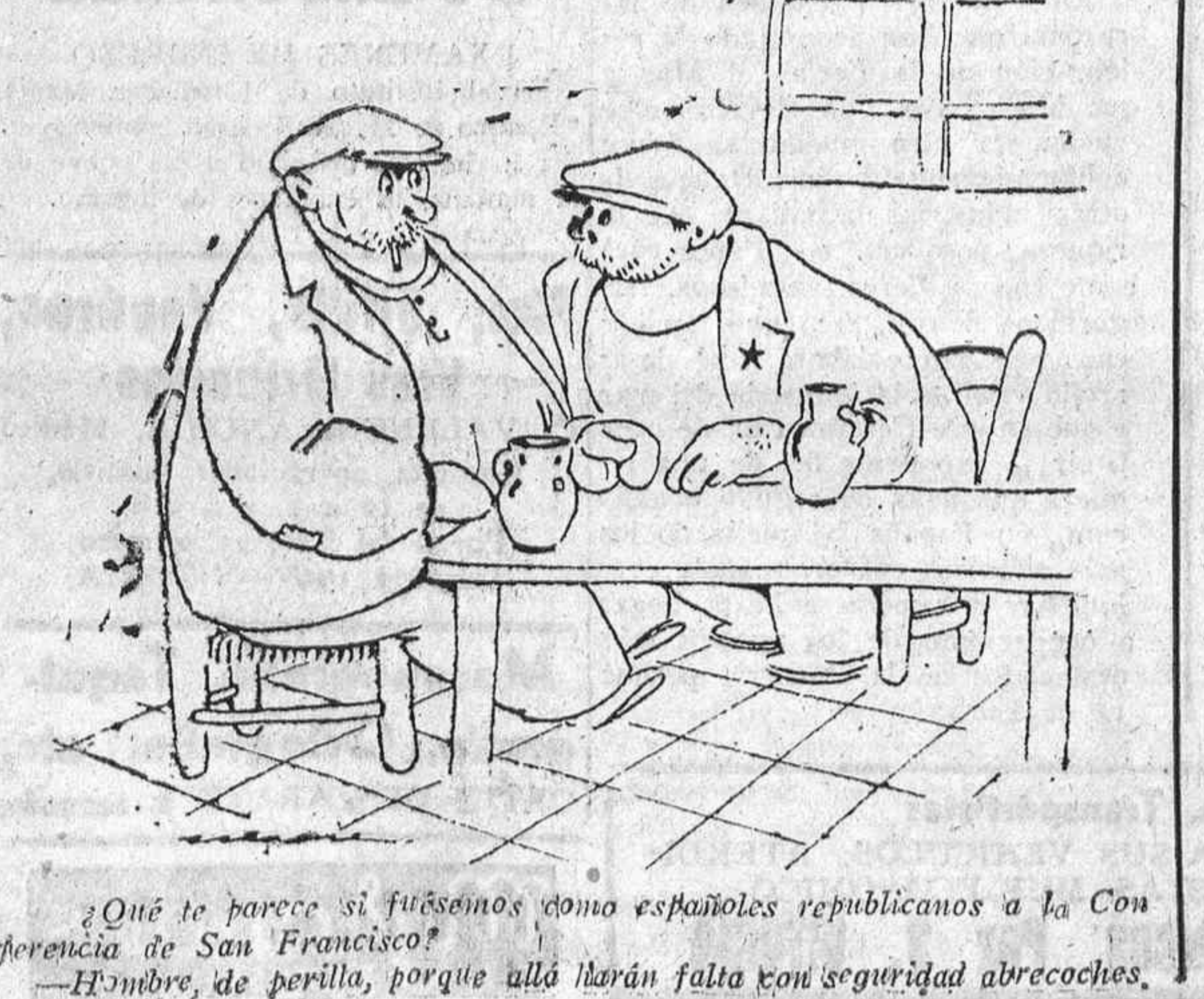
¿Qué te parece si fuésemos como españoles republicanos a la Conferencia de San Francisco? —Hombre, de perilla, porque allá harán falta con seguridad abrecoches.