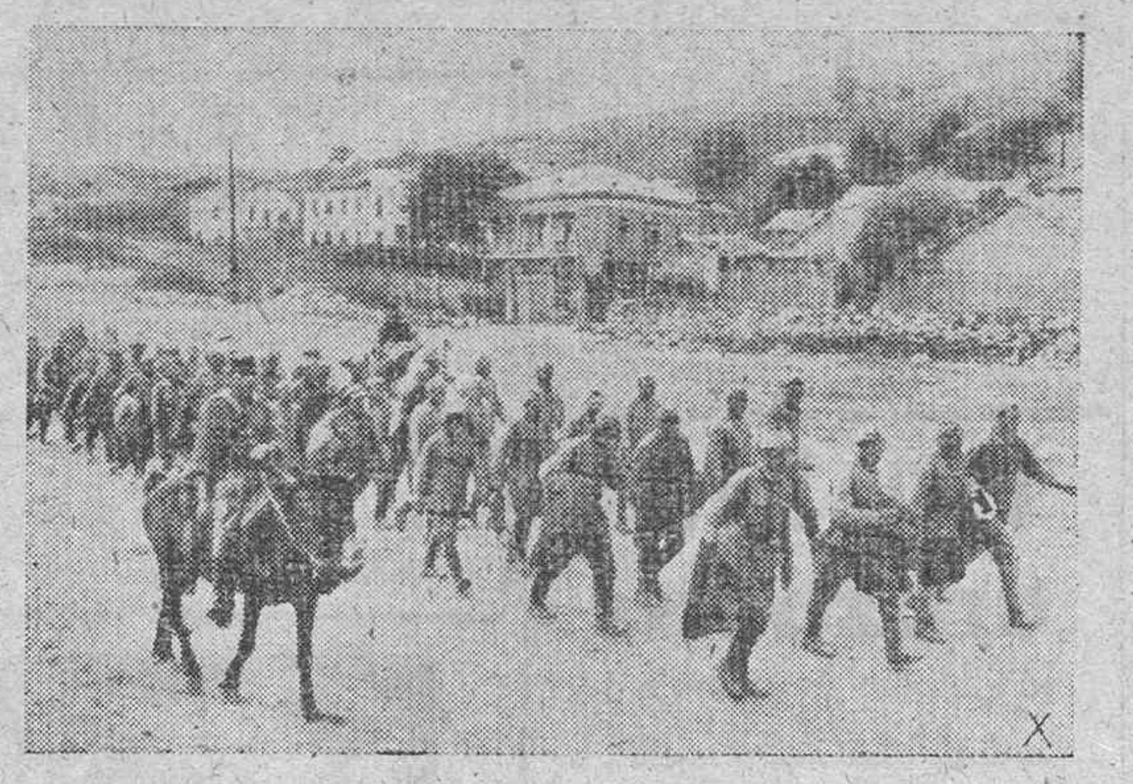
Soldados soviéticos capturados en las defensas exteriores de Stalingrado, marchan a un campo de concentración donde acabarán la guerra: de nada les ha servido su terca resistencia.