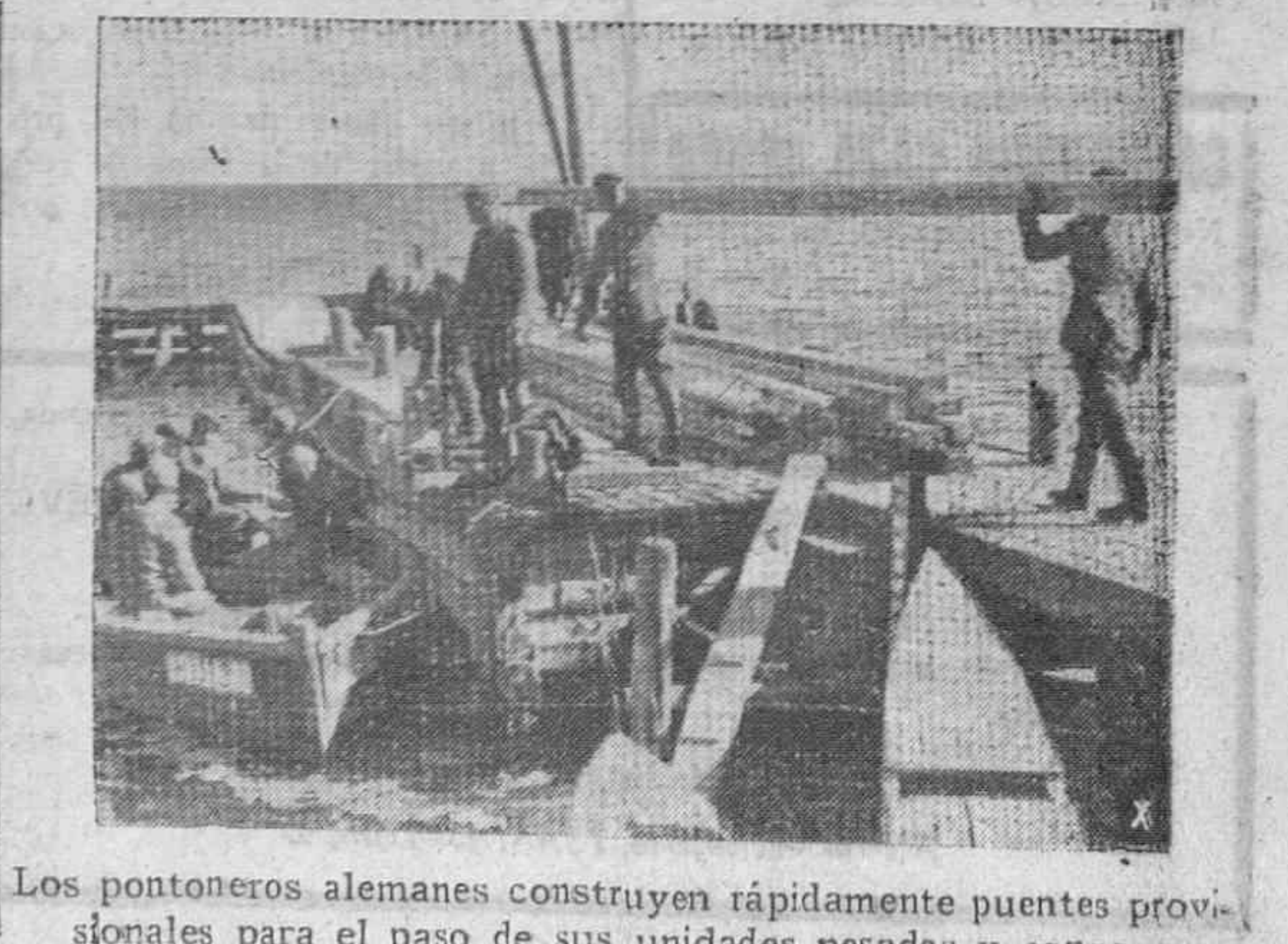
Los pontoneros alemanes construyen rápidamente puentes provisionales para el paso de sus unidades pesadas y convoyes

Washington.—El día 2 de octubre comenzará la recogida de chatarra y desperdicios y restos de metales desechos en los Estados Unidos.—(Efe).