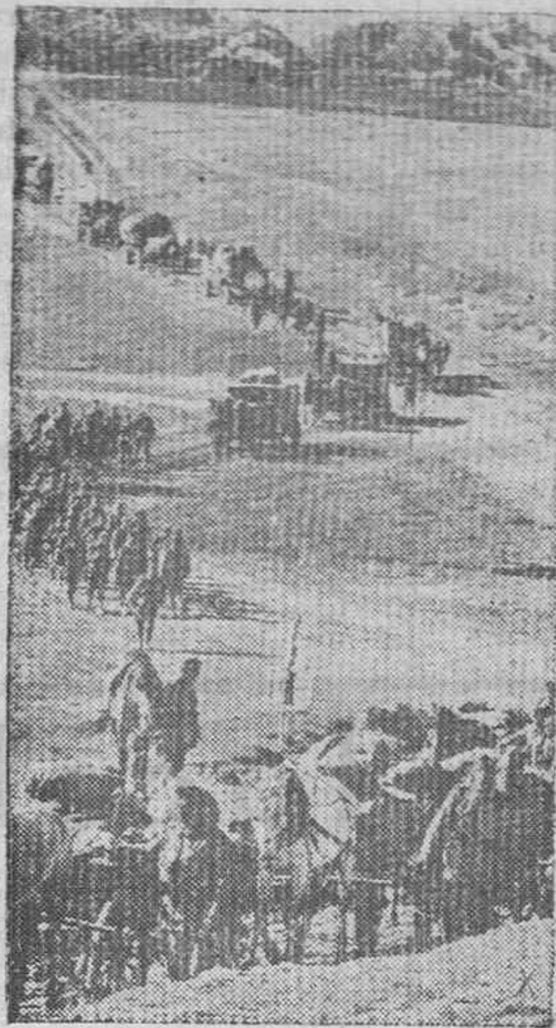
Ante Stalingrado.—Una de las columnas del Reich avanzando en dirección a la capital del Volga

Los soviets han convertido cada casa en un fortín y las calles en bastiones de artillería