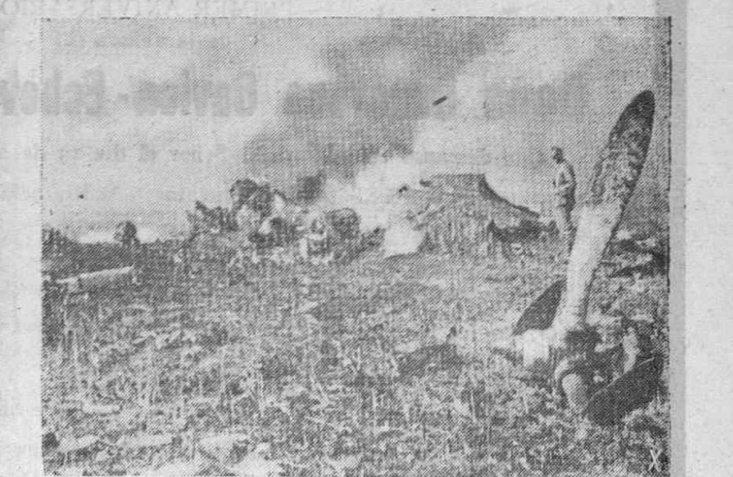
Avión soviético de bombardeo incendiado y derribado por un caza alemán. El piloto de este bombardero fué hecho prisionero.

Lisboa.—En el curso de este mes se celebrará la boda del príncipe don Eduardo Nuño de Braganza, pretendiente al trono portugués, con la princesa Maria Francisca de Orleans y Braganza. Los esponsales se celebrarán en Petropolis (Brasil), lugar de residencia de la familia. Esta boda pone fin a las enemistades que durante un siglo enfrentaron a las dos ramas de la Casa de Braganza.—Efe.