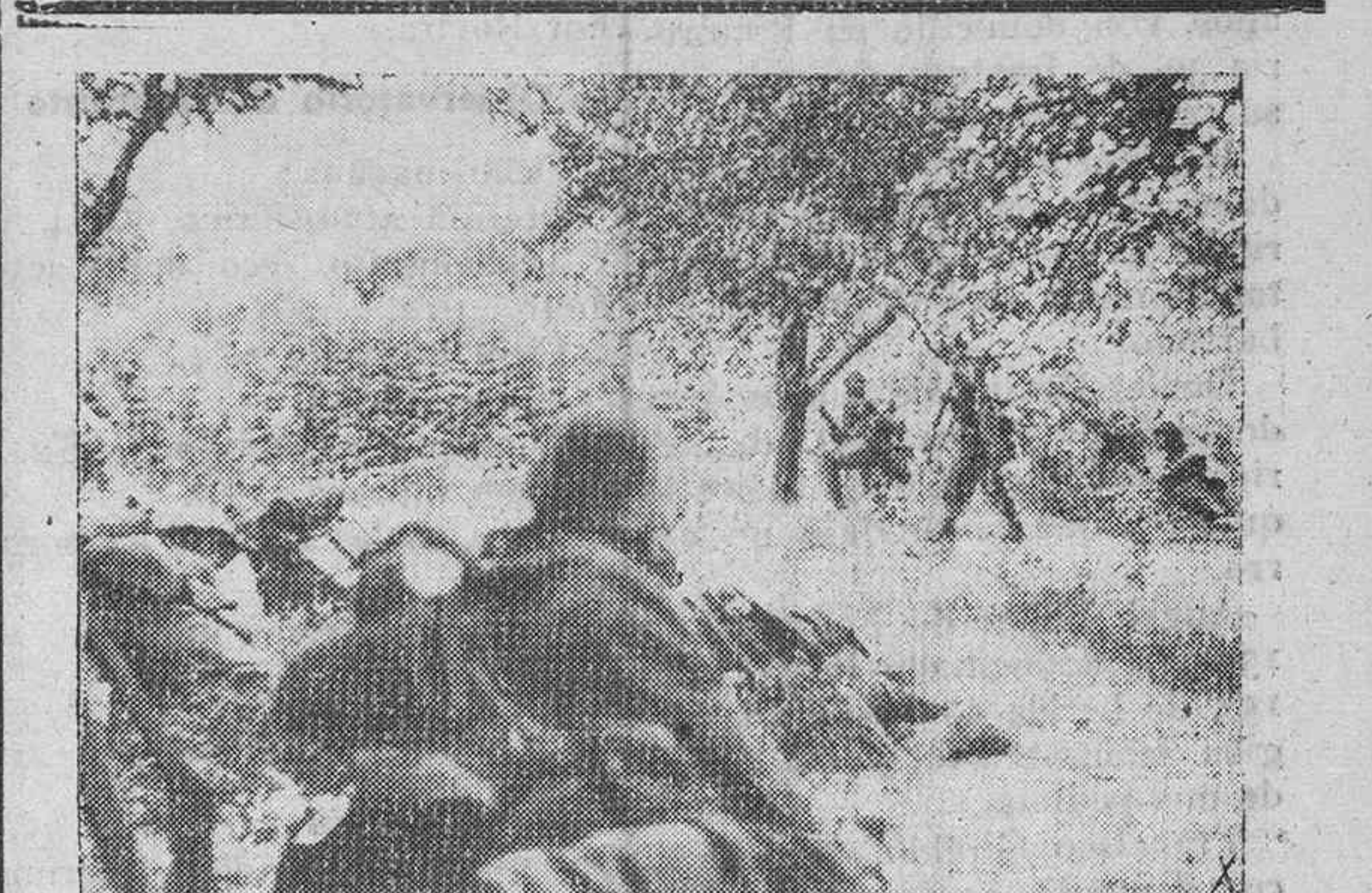
Delante de Krassnodar. — Ataque de la infantería alemana contra una trinchera a corazzada soviética.

Otras lanchas rápidas británicas resultaron igualmente gravemente averiadas. Uno de los cazas germanos alcanzó anoche su milésima victoria aérea sobre el adversario.—Efe.