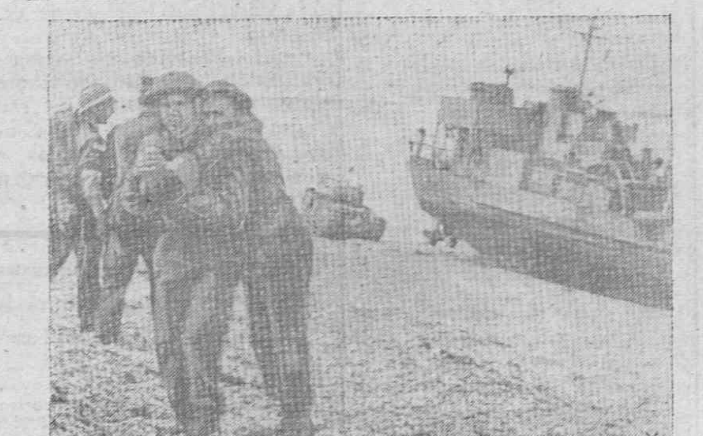
Una escena del fracaso inglés de Dieppe.—Prisioneros ingleses ayudan a sus compañeros heridos después de la derrota en el intento de desembarco.