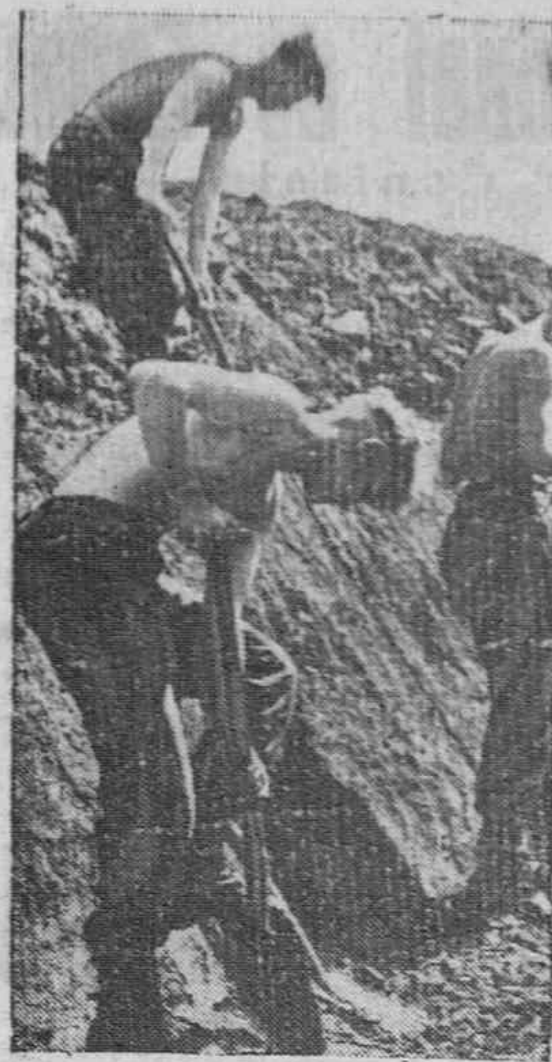
Hombres del Servicio del Trabajo Alemán construyendo obstáculos con los tanques.