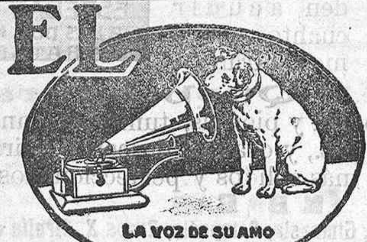
LA VOZ DE SU AÑO