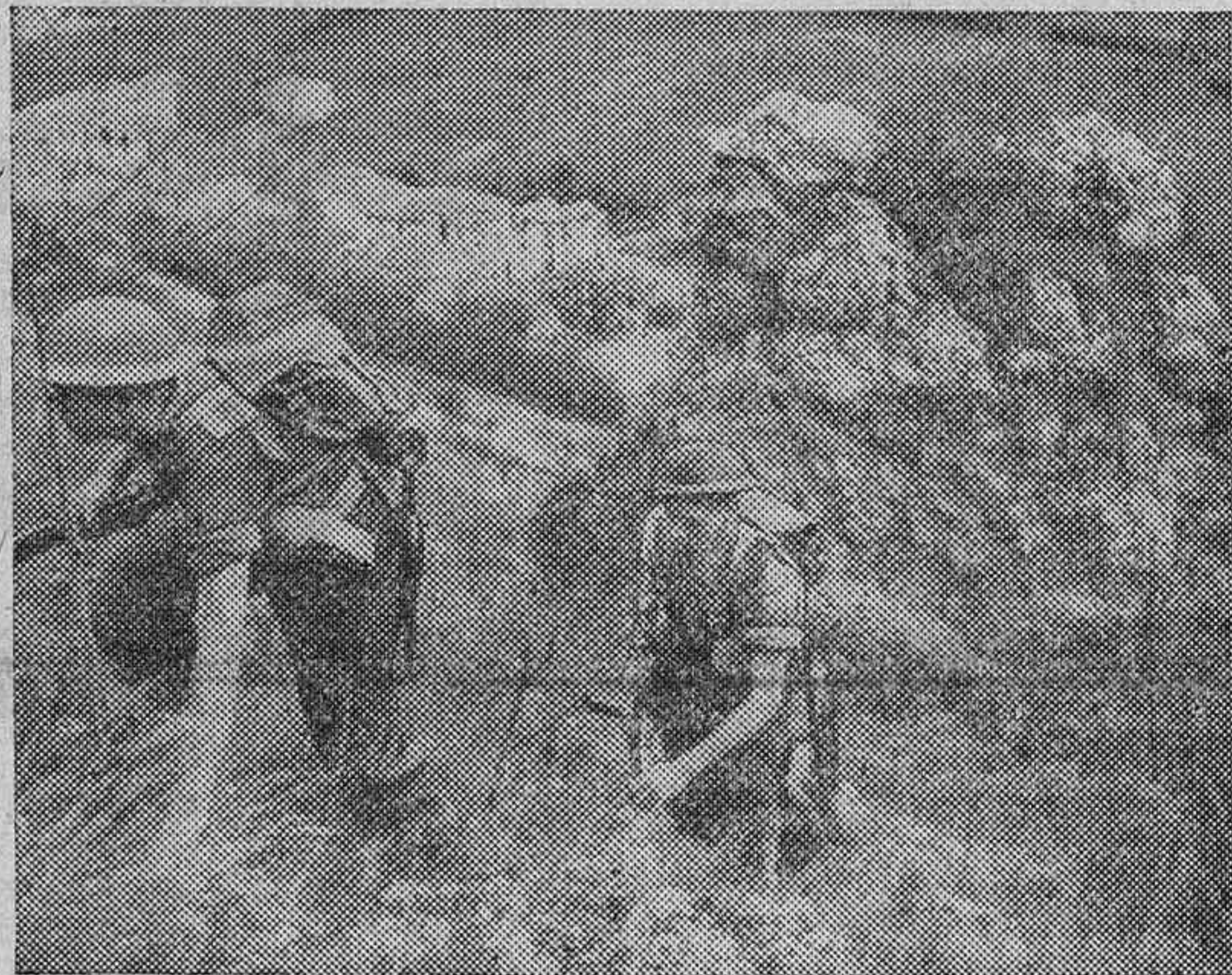
Una patrulla británica escala la ladera de una montaña durante una misión de exploración por el frente italiano.