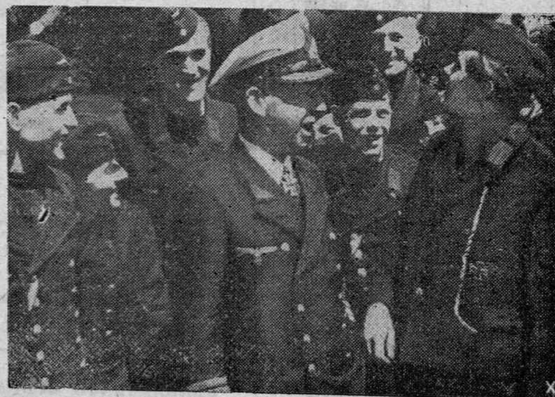
Hállase rodeado de algunos de los hombres de la flotilla de bucasminas que manda y que desde el comienzo de la invasión actual ininterrumpidamente, después de haber sido condecorado con las hojas de roble.