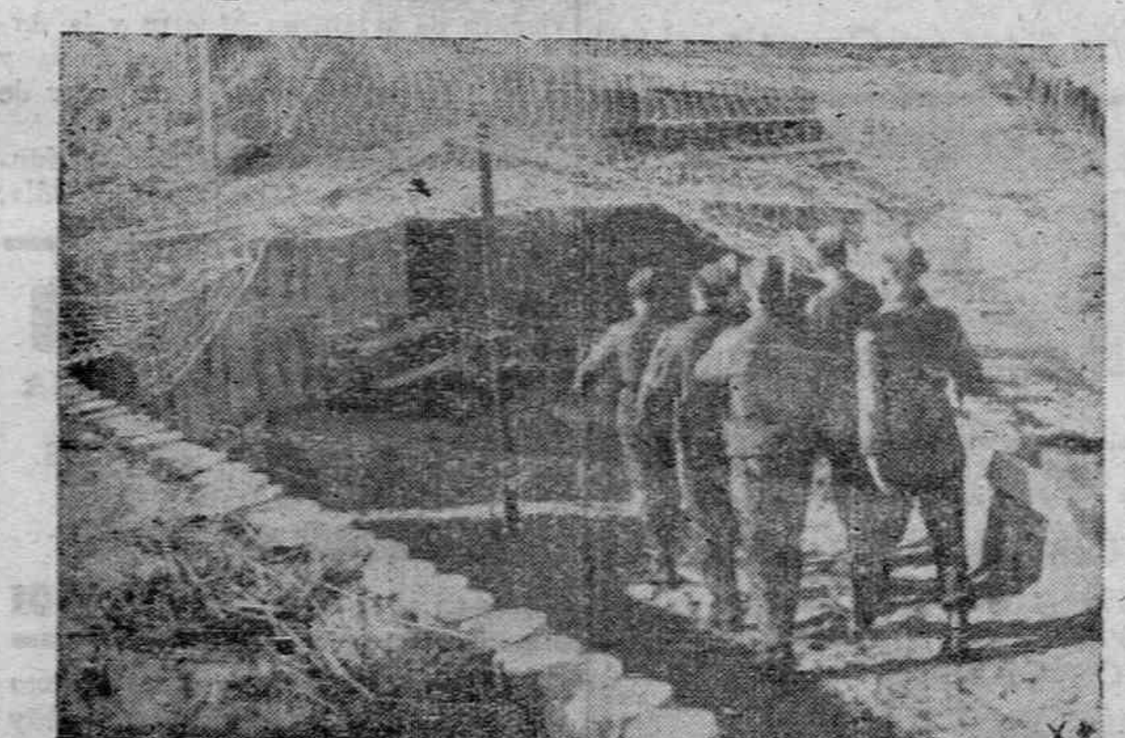
Un grupo de soldados entra a uno de los refugios construidos en los diversos centros y bases, especialmente aéreas.