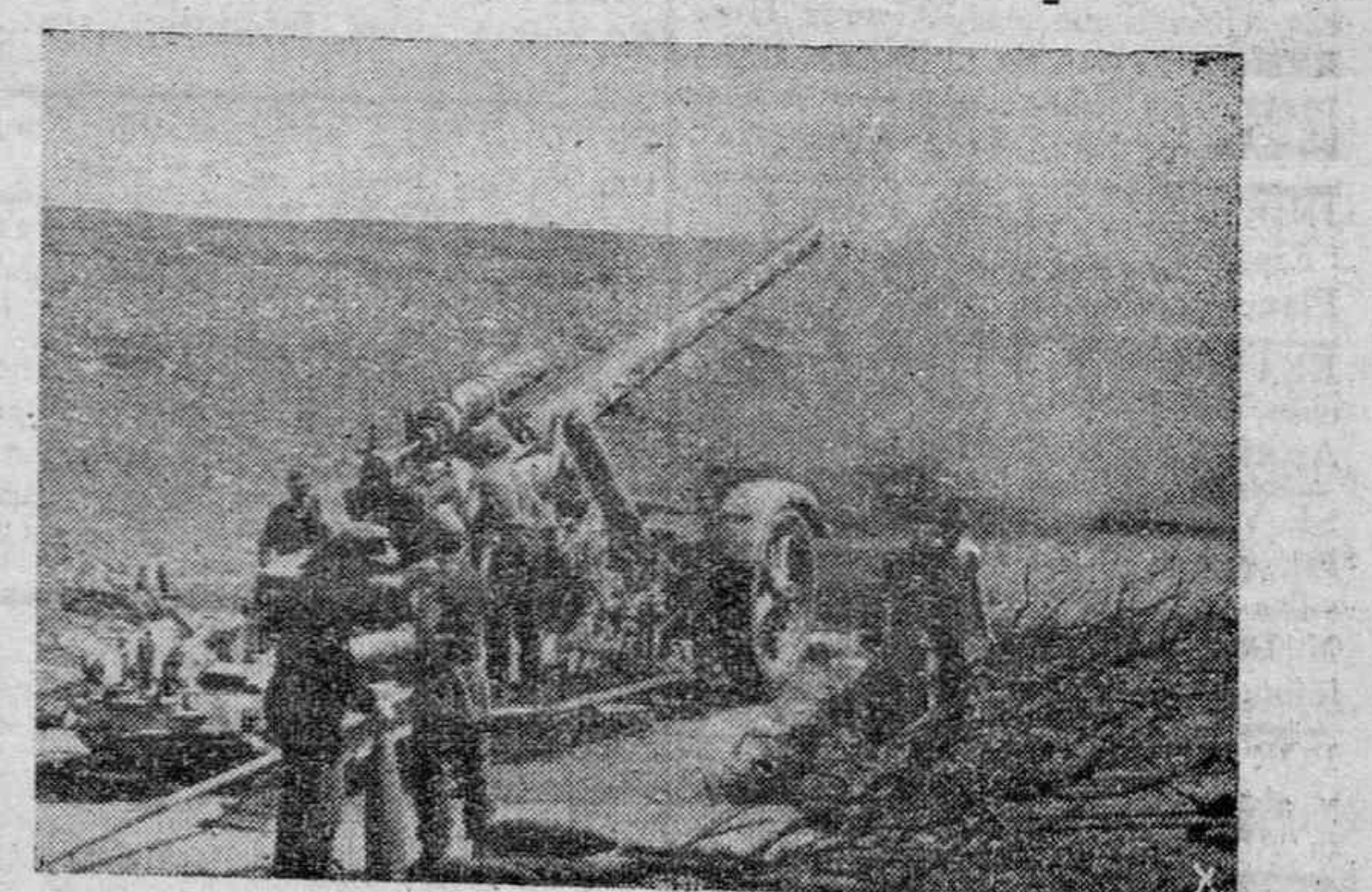
Una pieza de gran calibre de la artillería pesada germana abriendo su fuego contra las posiciones enemigas.