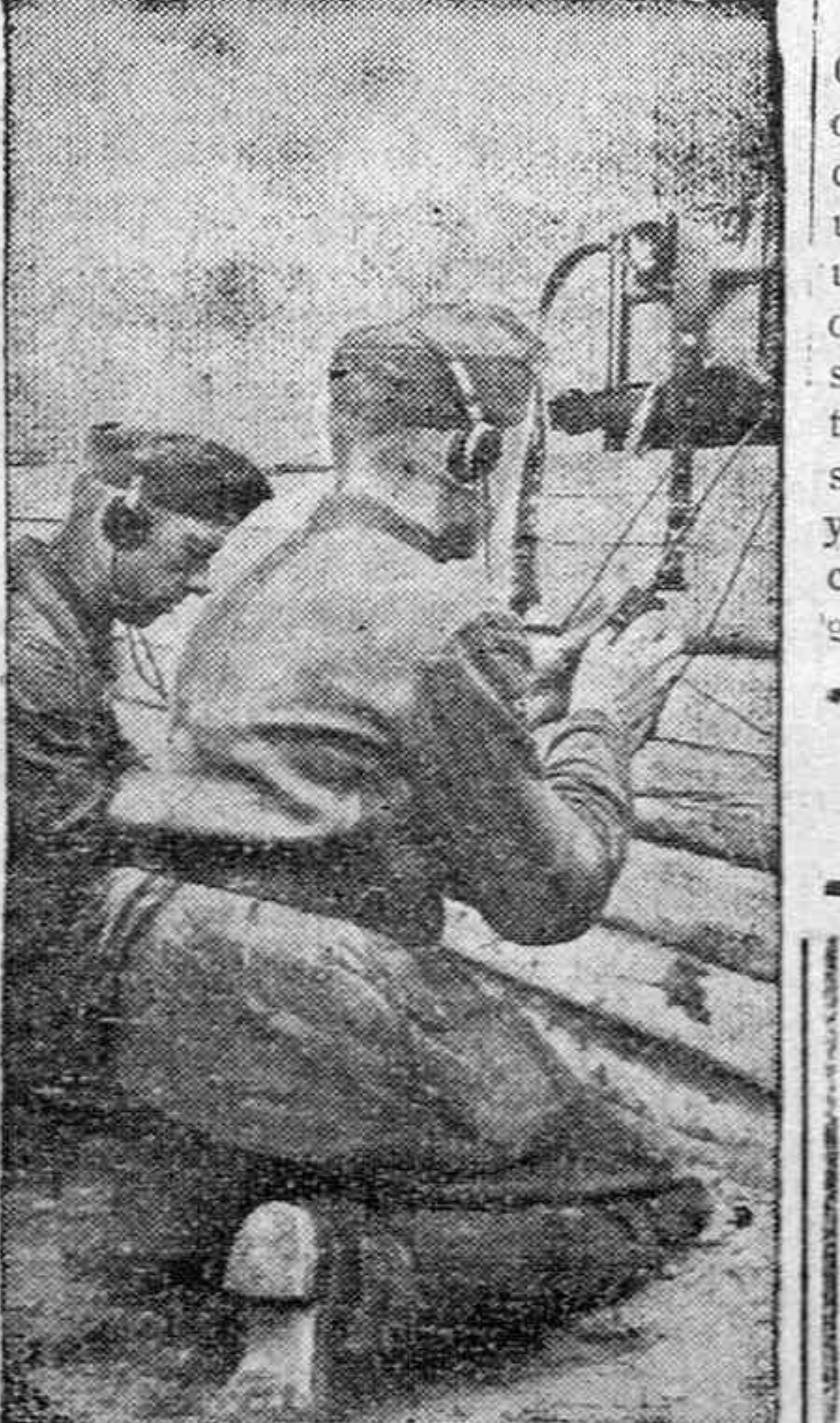
Soldados del servicio radio telegráfico transmitiendo las órdenes de campaña en los frentes de combate del continente.

Algunos de ellos estuvieron detenidos, donde fueron visitados y animados, si así se puede hablar, hasta preparar luego a gran Cruzada que, años atrás, estaba en la mente de todos los buenos españoles contra el antro comunista en que aquello desembocó.