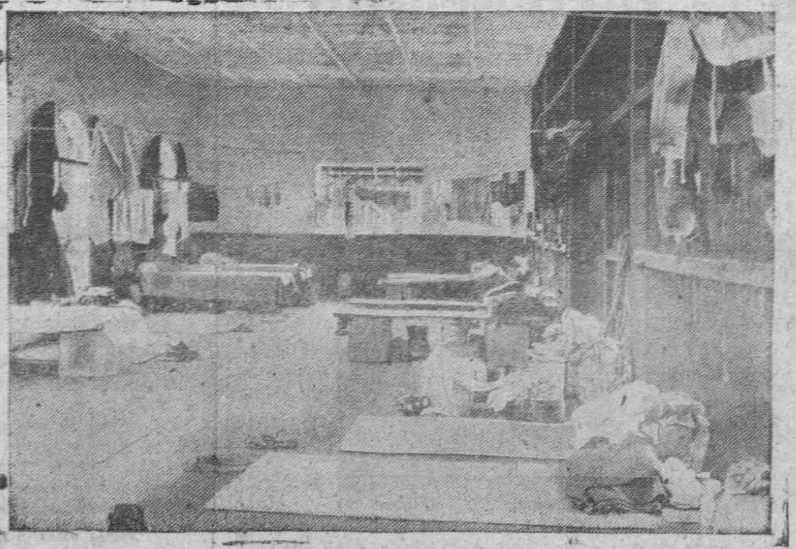
Vista de una de las celdas que usaron los japoneses para los prisioneros civiles, primeramente y, para prisioneros de guerra después.