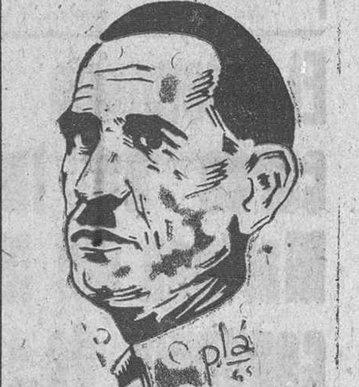
EL PRESIDENTE CUBANO GRAU SAN MARTIN

La Habana.—El "Diario de la Marina", comentando la propuesta del Senado de suspender las relaciones diplomáticas con España, publica un artículo en el que se dice que Cuba no debe asumir la responsabilidad de esta ruptura y recomienda al presidente de la República la conveniencia de un objetivo y sereno estudio de la decisión.