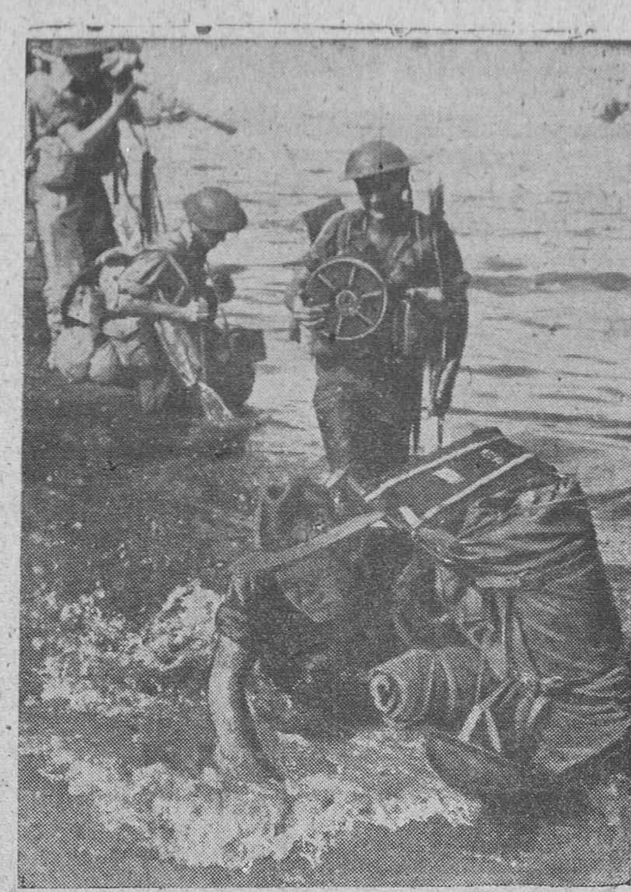
Equipos de señales siendo desembarcados por los australianos en la isla de Labuan, Borneo.