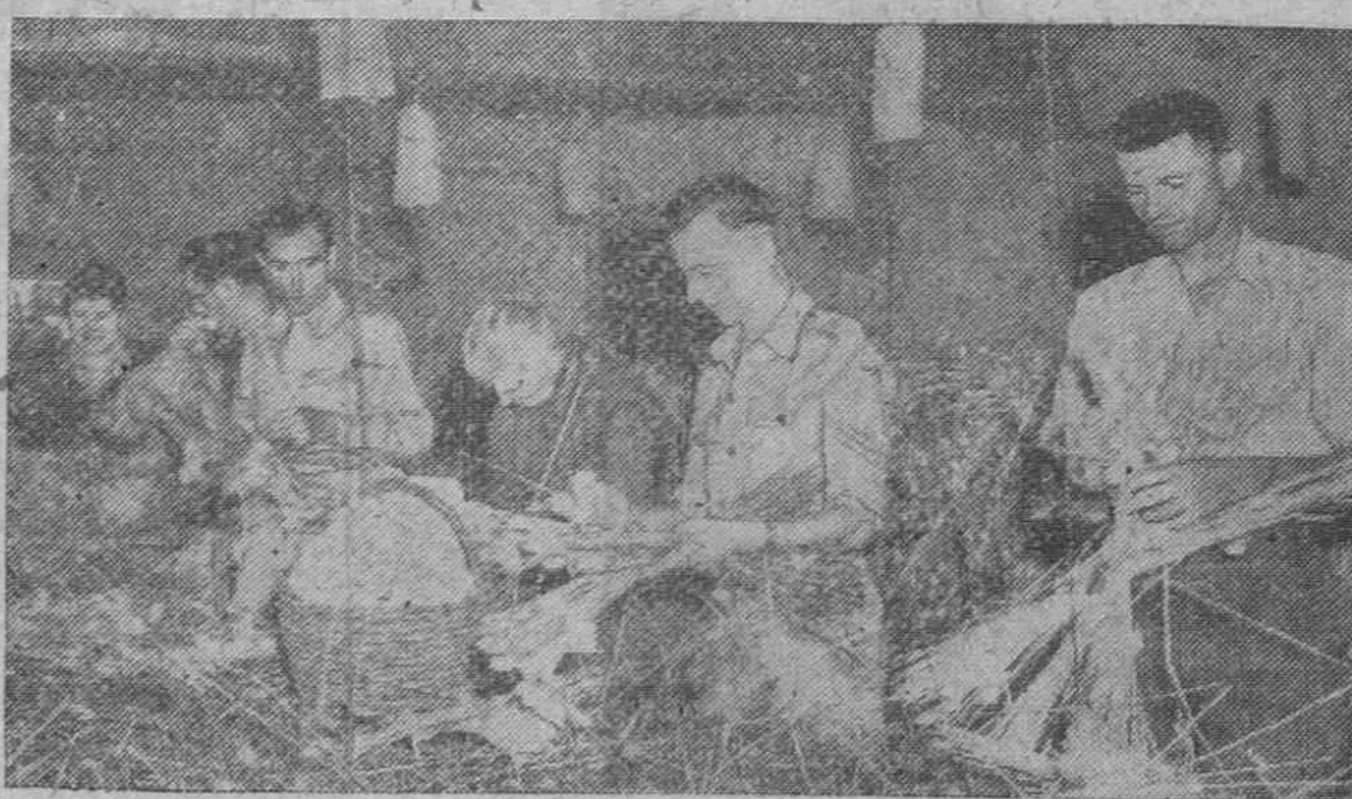
Los soldados ayudan en la recolección de la cosecha del gusano de seda en una finca del Norte de Italia. Los capullos de seda tienen que ser cuidadosamente separados de la paja, la cual ha sido la casa del gusano durante diez días.