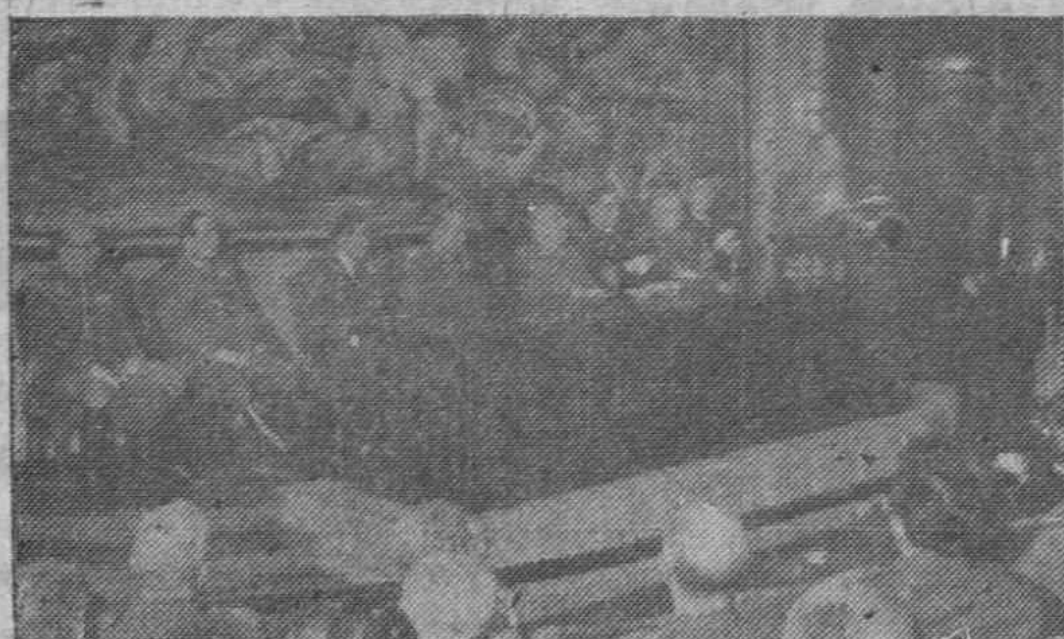
En la Escuela Superior del Ejército se ha verificado la apertura de Curso. El Caudillo pronunció con tal motivo ante los jefes alumnos un importante discurso. He aquí la presidencia del acto en el salón de actos de la Escuela.