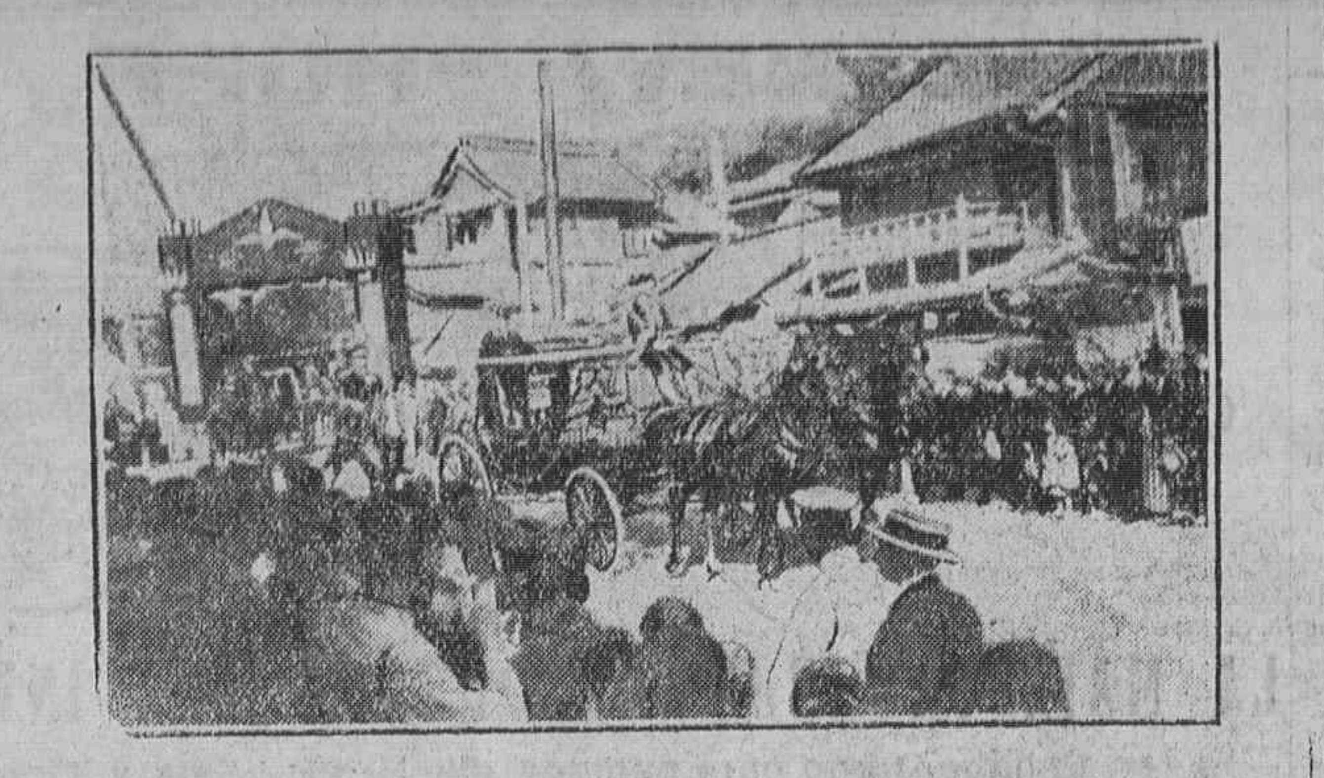
LA BODA DEL PRINCIPE CHICHIBU EN TOKIO. He aquí una foto del acontecimiento en la corte japonesa. La carroza nupcial de la novia, Mile. Matsudaira, pisando por la puerta de Kiotsukawa.