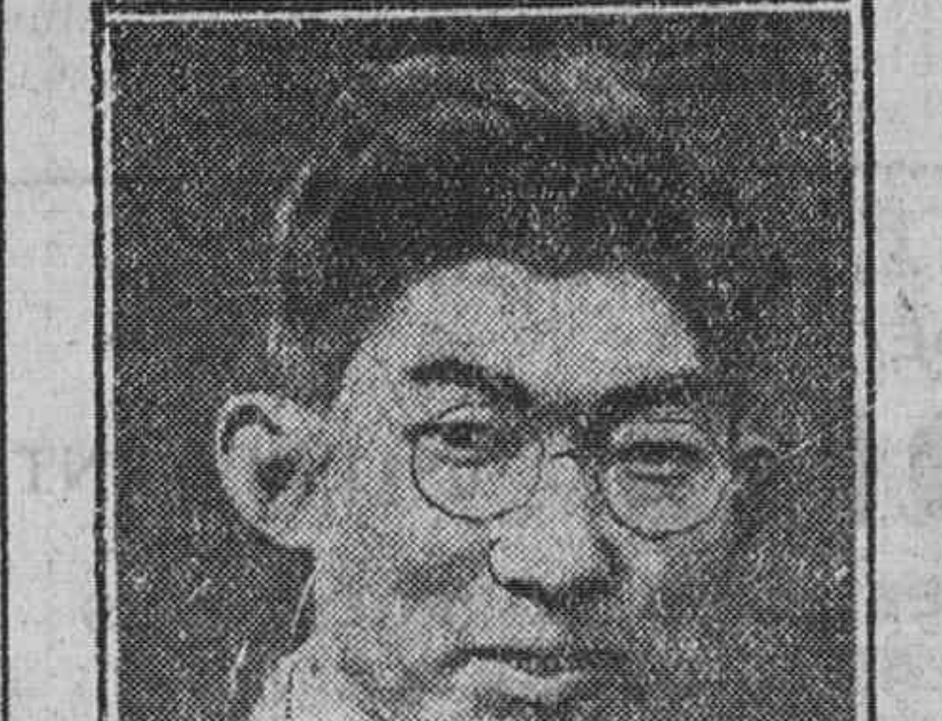
El Príncipe Chichibu y su esposa Mile. Matsudaira.