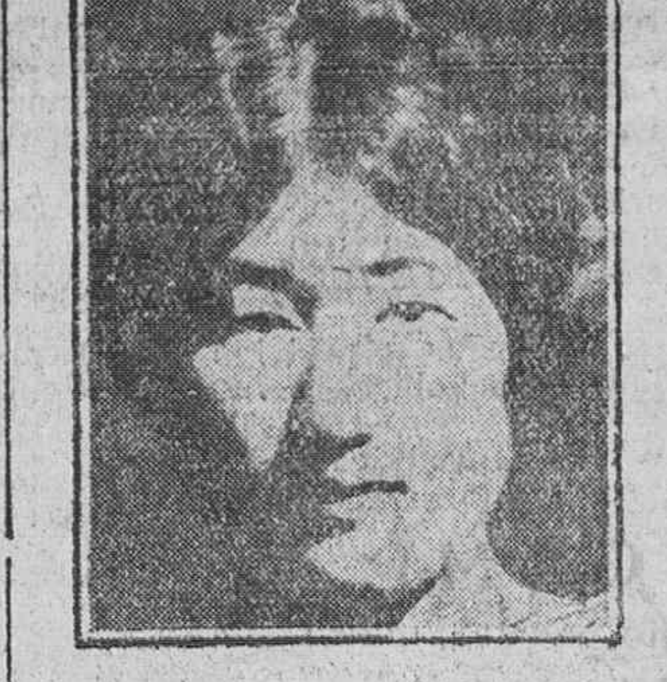
El Príncipe Chichibu y su esposa Mile. Matsudaira.