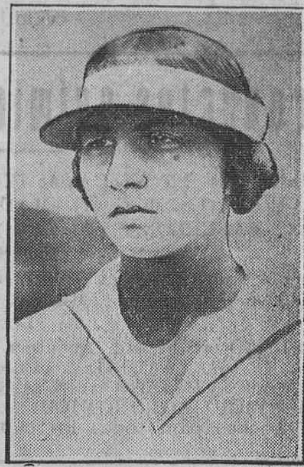
EL CAMPEONATO DE TENNIS EN WIMBLEDON

En la calle del Cristo y delante de una zapatería propiedad de Pa-