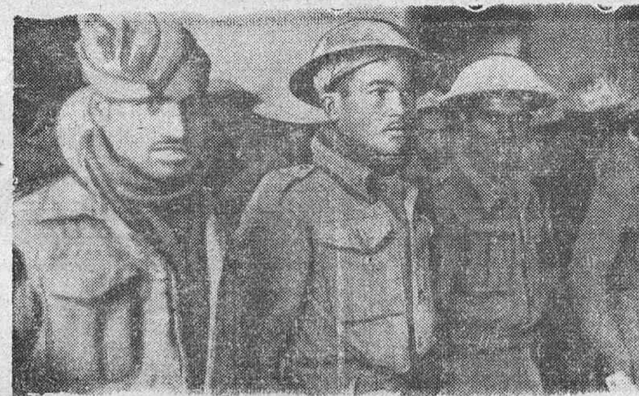
Indios, sudafricanos, neozelandeses y mestizos internacionales capturados por las tropas alemanas al Sur de Italia.