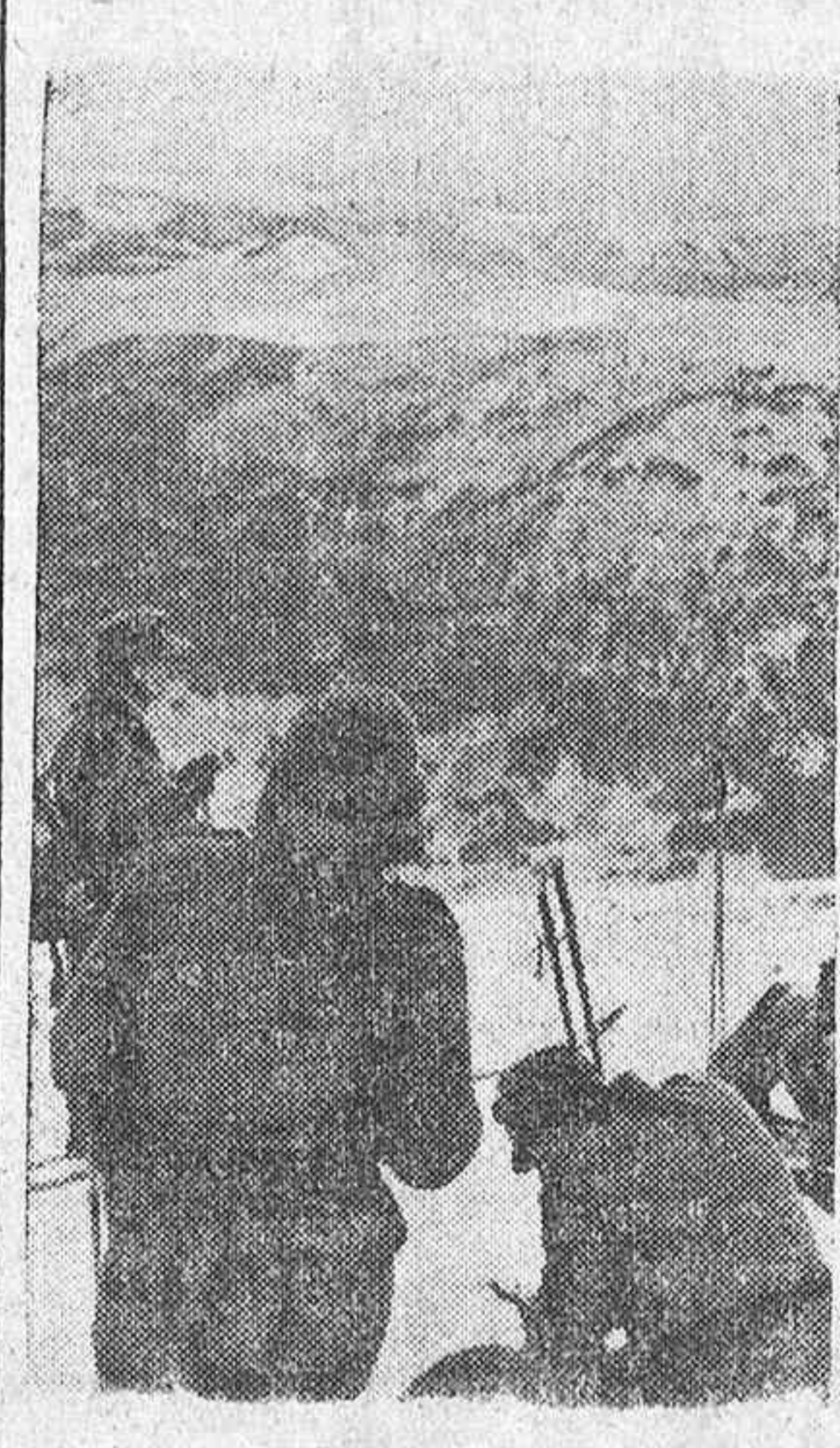
Esquiadores alemanes en las montañas del Sur de Italia.