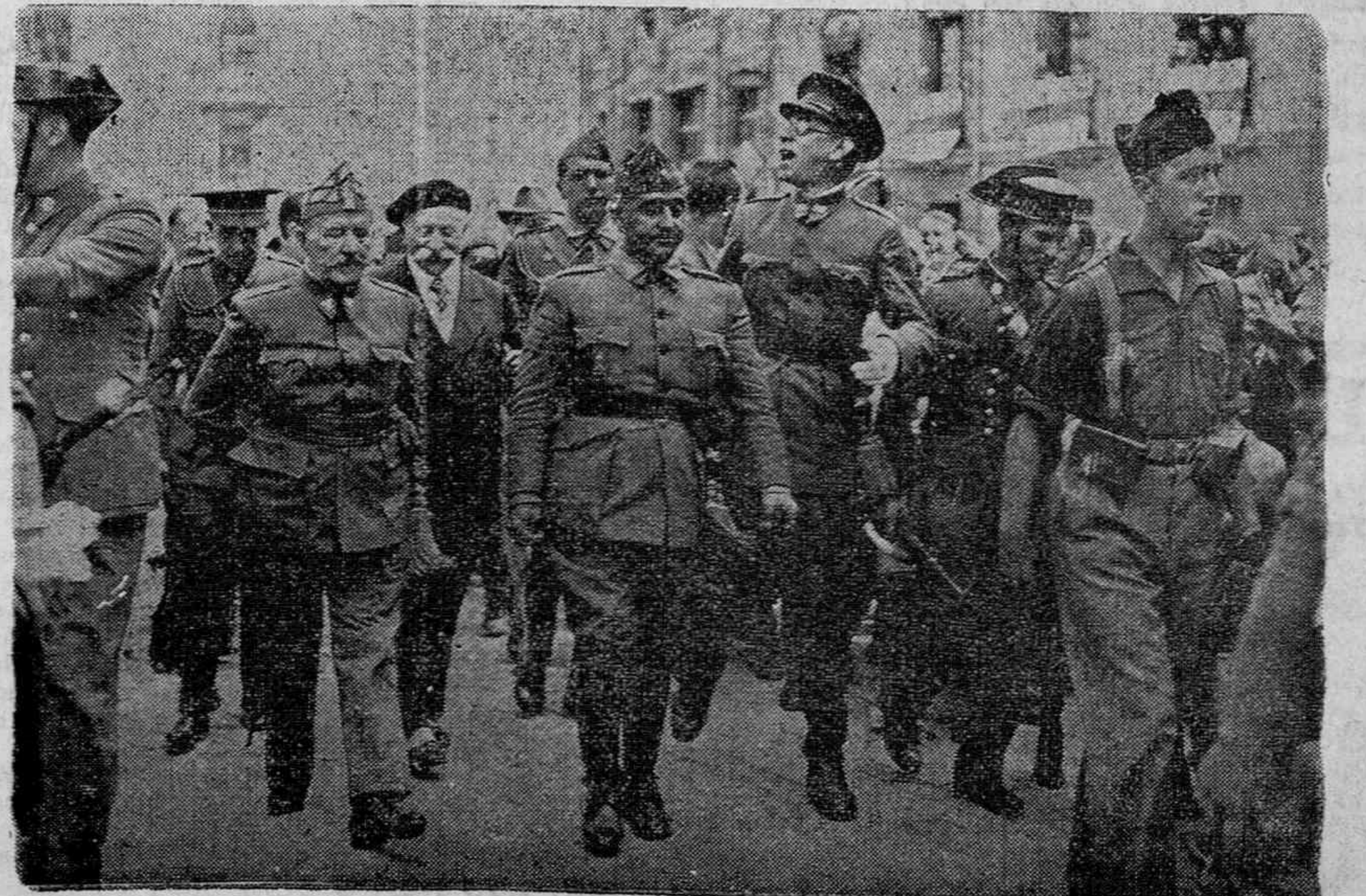
El general Franco con los generales Mola y Calvo Sotelo pasando entre aclamaciones por las calles de Burgos