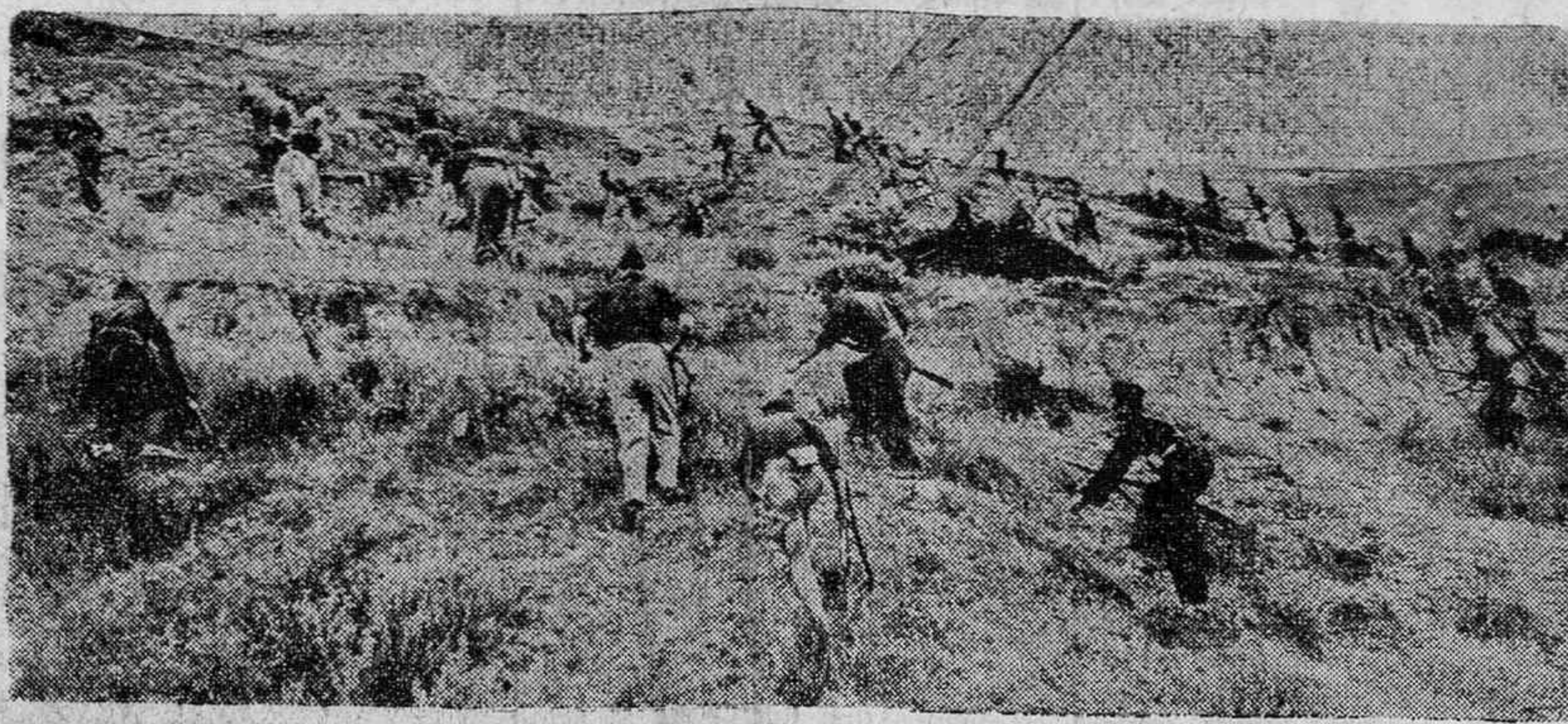
Tropas de nuestro valiente Ejército y milicias prosigen su avance hacia San Sebastián.