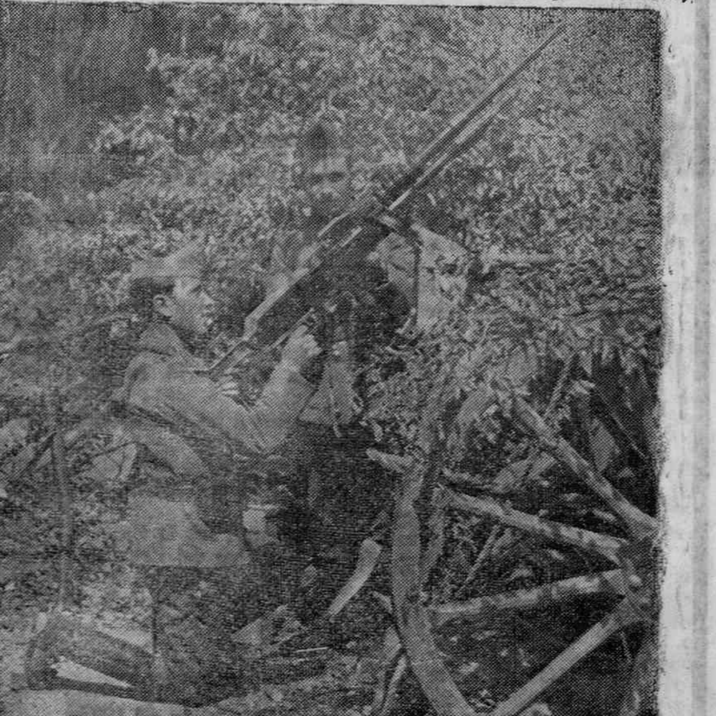
Una batería antiaérea en la Granja de San Ildefonso