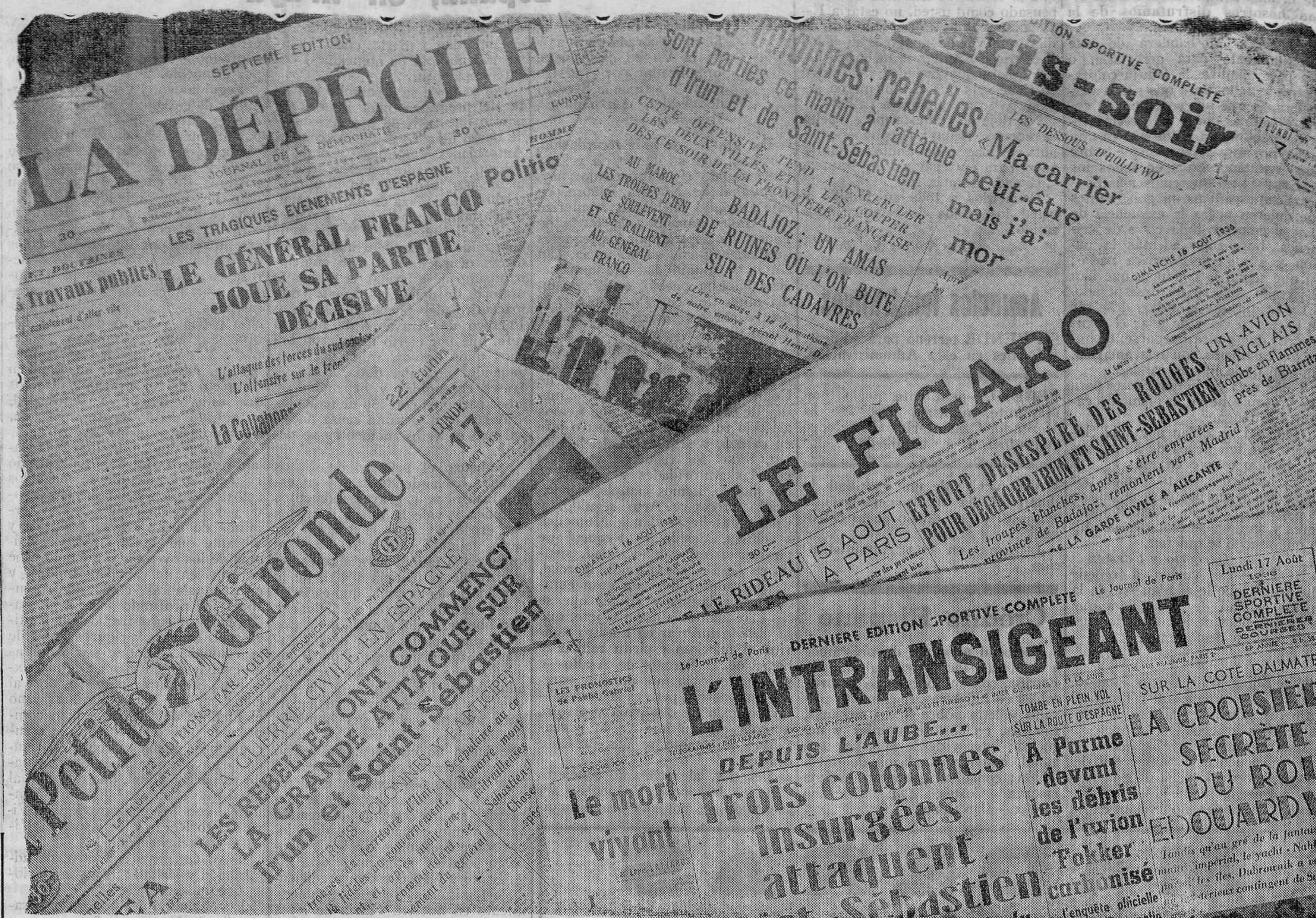
Reproducimos en este grabado las cabeceras de varios periódicos franceses fecha de ayer, periódicos de diversas tendencias, todos los cuales coinciden en que el avance de las tropas al servicio de España es arrollador

Berlín.—Según los extranjeros que han salido de Madrid por vía aérea, la situación de la capital española es penosísima, faltando los víveres. Traen la impresión de que no podrá resistir muchos días. Alemania, para la repatriación de sus súbditos residentes en la capital madrileña, ha reforzado el servicio aéreo de la Luft Hansa entre Marsella, Barcelona y Madrid. En Alicante un buque germano recogió a 500 extranjeros. El vapor "Fulda" tomó en Barcelona 230, de los cuales 115 son alemanes. Los buques de guerra alemanes que se hallan en puertos españoles, serán sustituidos a fines de agosto por igual cantidad de unidades, ya que Alemania desea mantener su vigilancia en la costa mediterránea, para que sus súbditos cuenten,