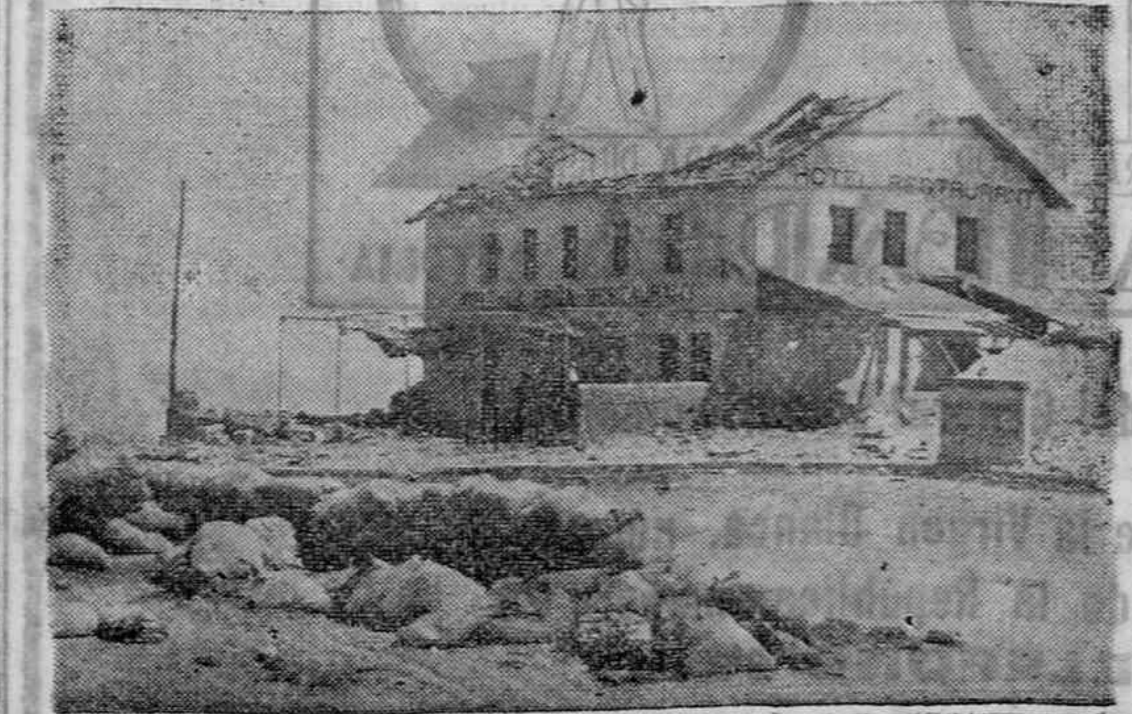
En el Alto de León

Ayuda a la Prensa Católica y Española anunciando en sus