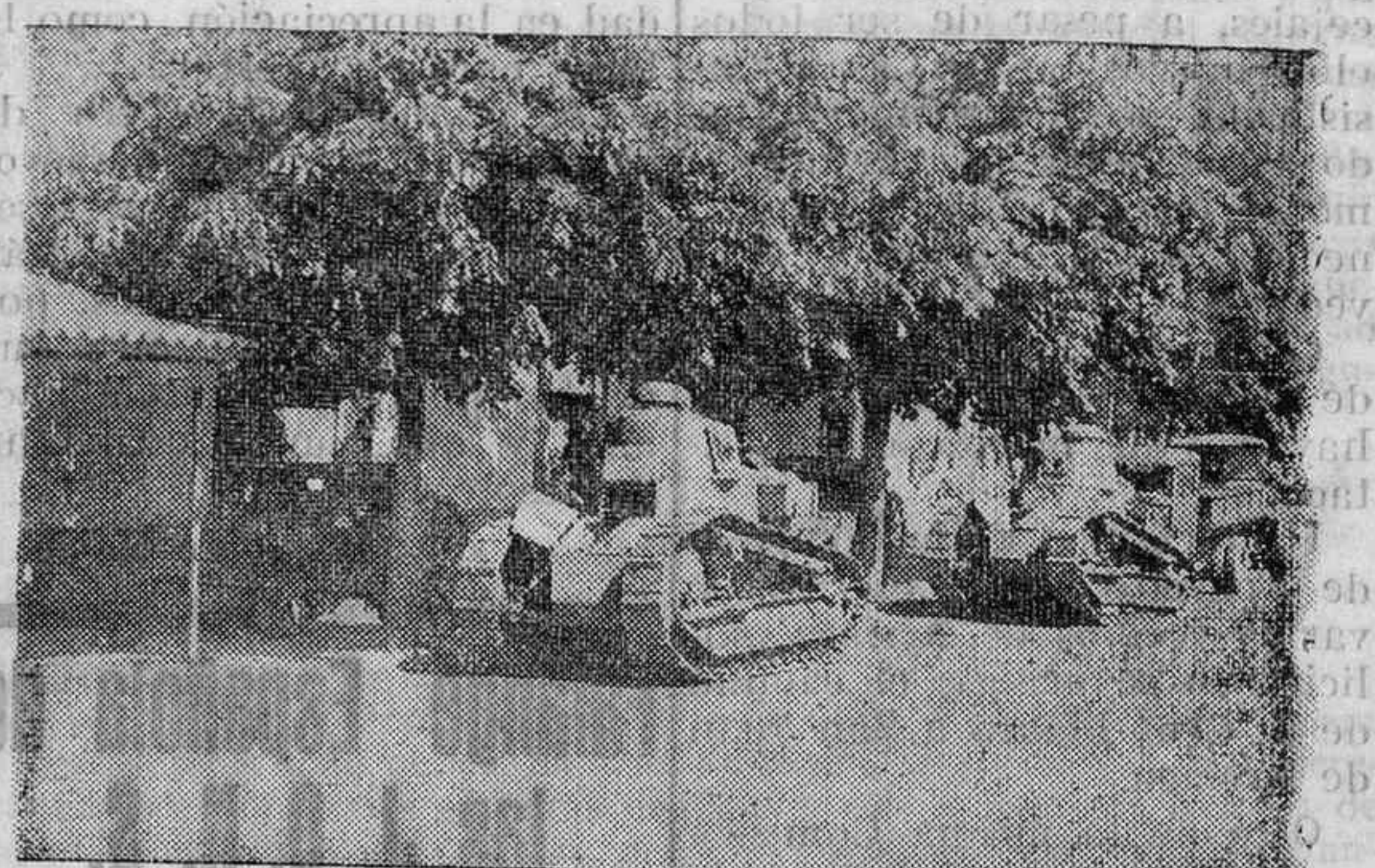
En San Rafael. Tanques y cañones cogidos al enemigo

Y diariamente se presentan nuevos voluntarios, que parecen brotar a centenares de toda la provincia.