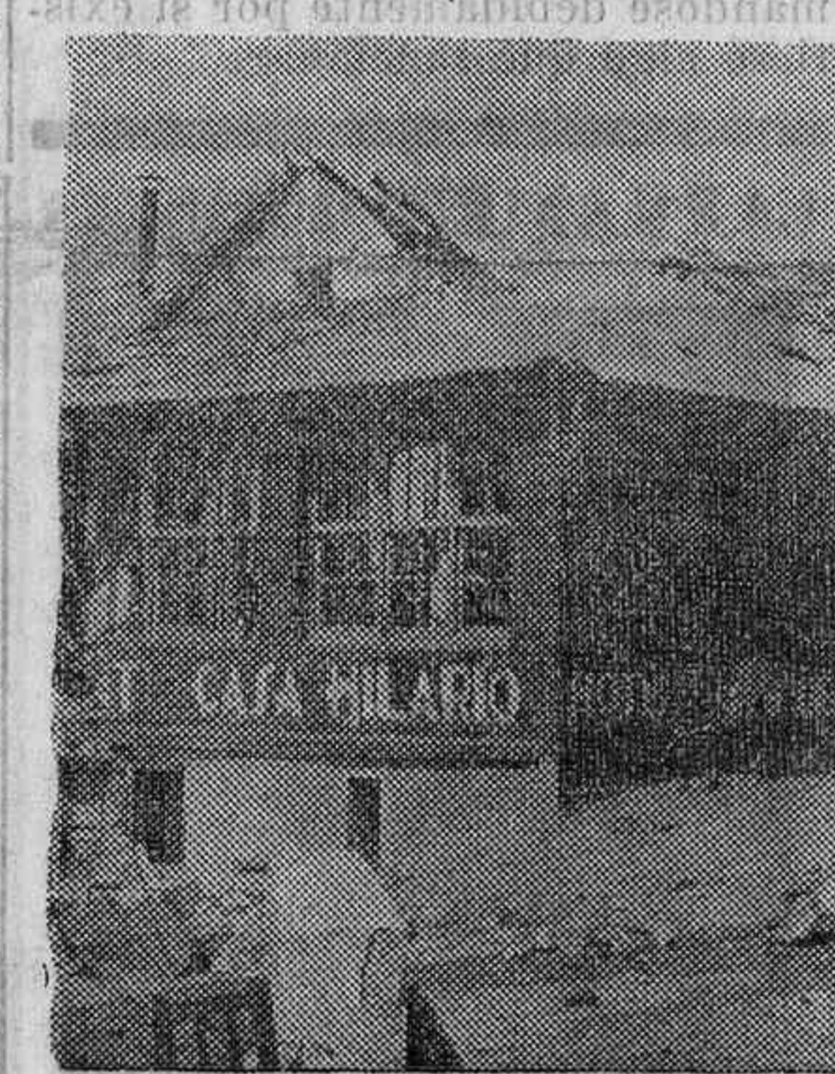
En el Alto de León

En el mismo Cuartel tienen taller de reparación de automóviles, enfermería. Nos explicaron como a todos los afiliados de Falange se les hace su correspondiente análisis de sangre, marcándose en unas pulseritas personales la graduación correspondiente a cada individuo. Para, en caso necesario, no perder ni un solo momento.