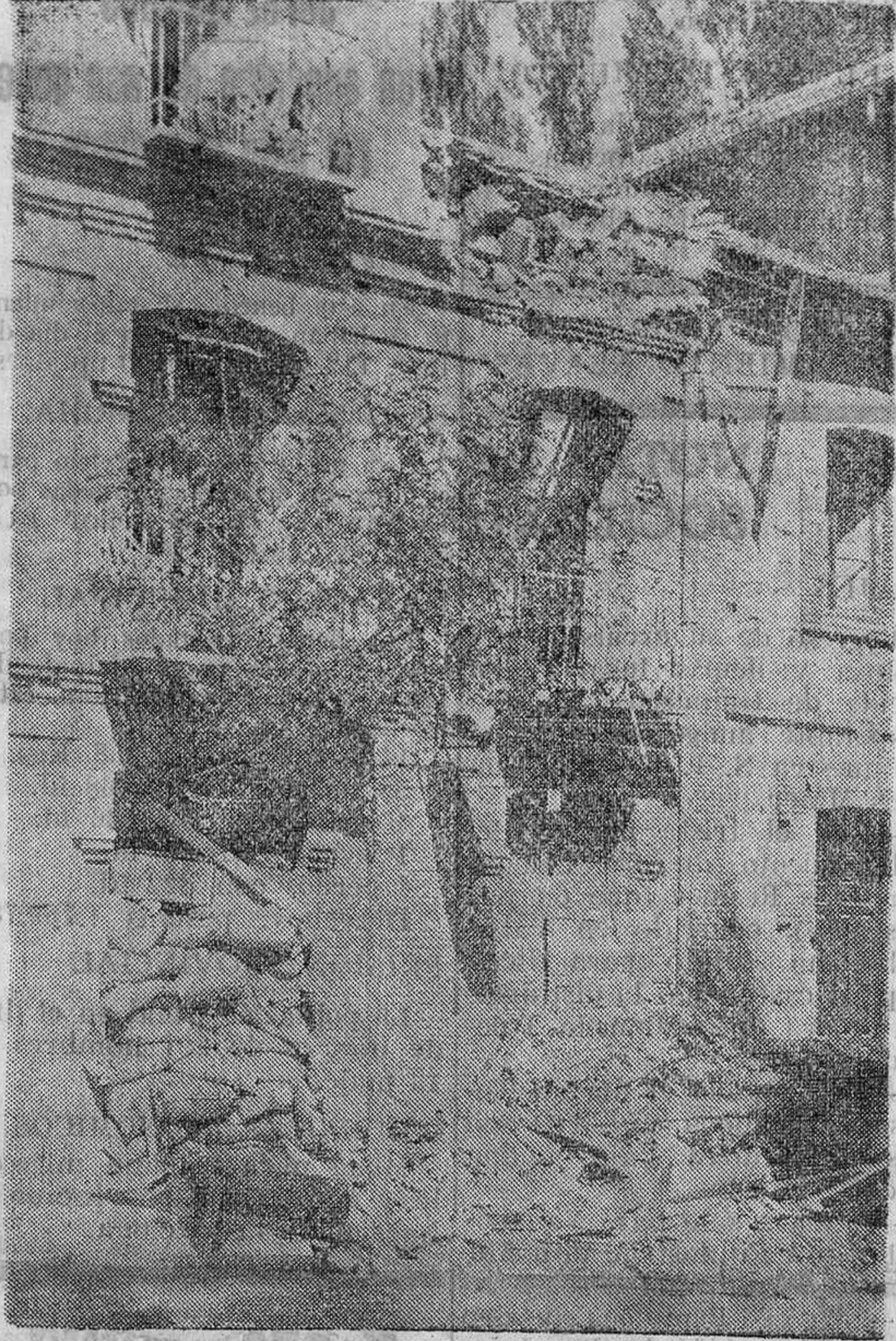
La Casa de Teléfonos de San Rafael, único edificio destruido por la artillería enemiga

El magnífico espíritu de las tropas que están cercando Madrid. - Las avanzadas a cuarenta kilómetros de la capital de España