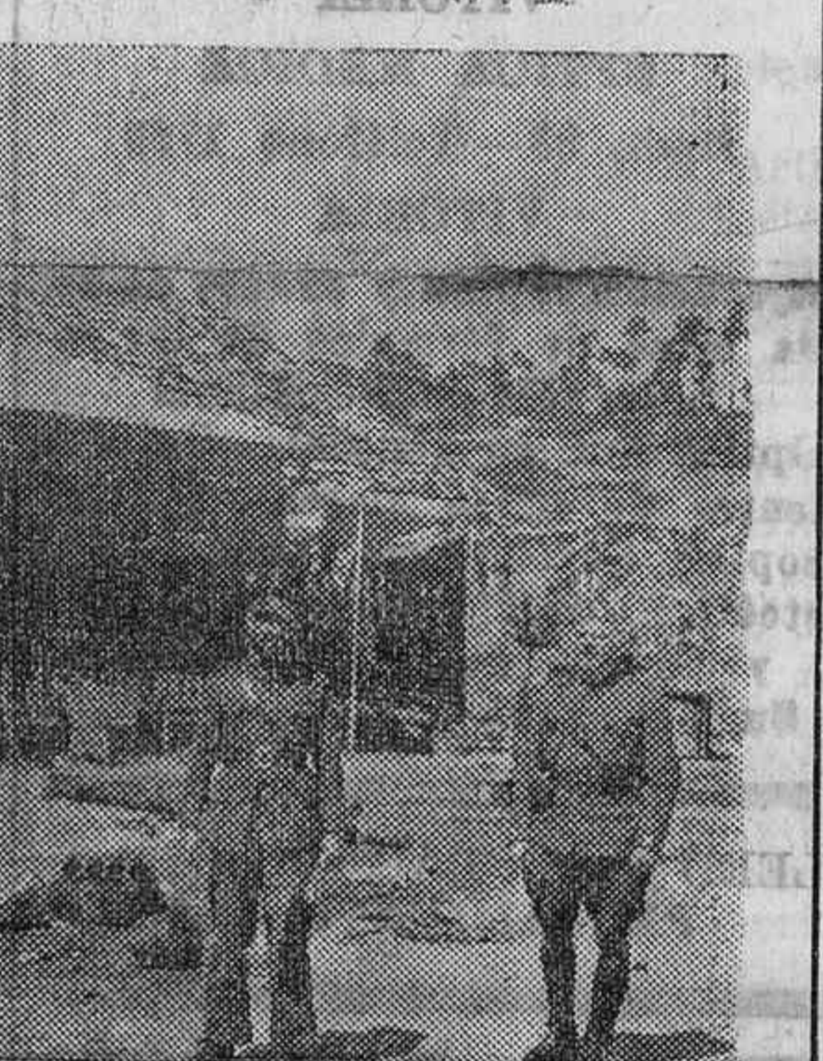
En el Alto de León

Un capitán que allí estaba relató hechos criminales cometidos en la provincia de Córdoba, antes de ser dominada por nuestras tropas. Son francamente inenarrables.