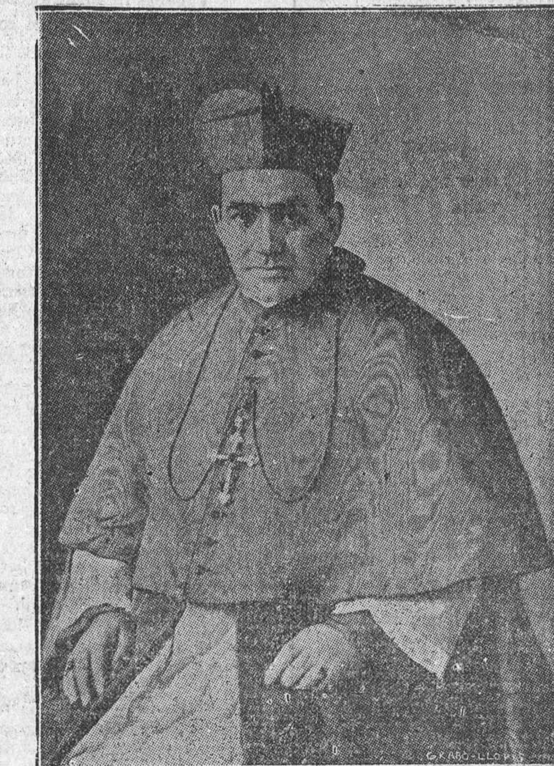
El Eminentísimo Cardenal Segura, que acaba de publicar dos hermosísimas Pastorales sobre la devoción española a la Inmaculada y sobre organización y fomento de las vocaciones eclesiásticas españolas. Hoy cumple sus años el santo y sabio Cardenal, esperanza de la Patria, al que respetuosamente le testimoniamos nuestra felicitación más cariñosa.