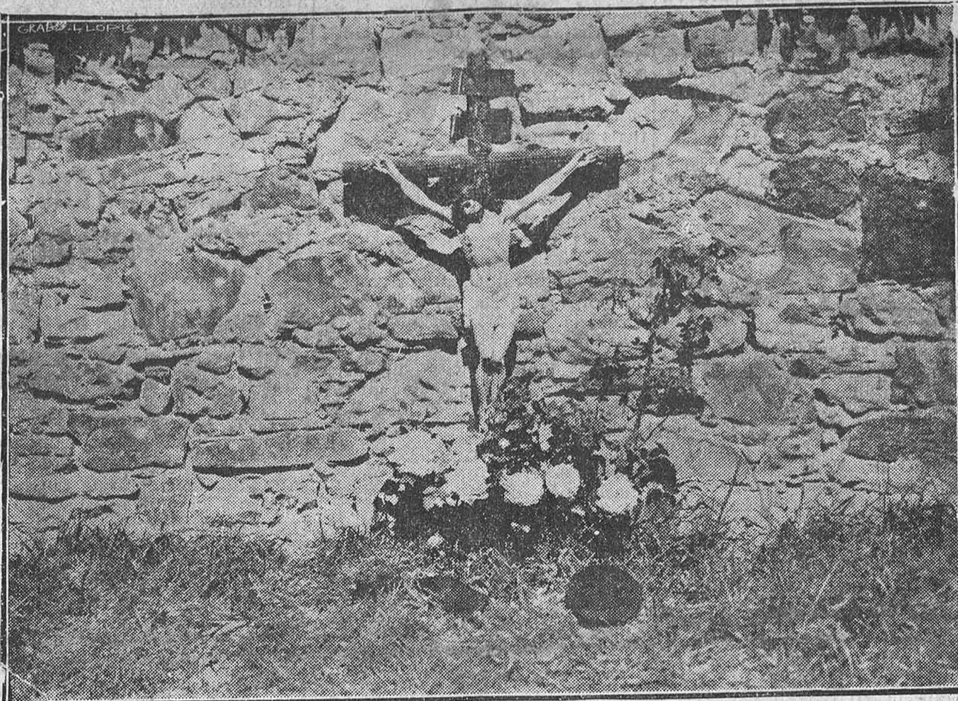
Esta es la tapia del cementerio del Bilbao donde los rojo-separatistas asesinaron tantos y tantos ciudadanos honrados, cuyo tremendo delito consistía en querer a España. En su memoria se celebraron varios actos el domingo último, a los que asistieron las familias de las víctimas, a las que se tributó un merecido homenaje.