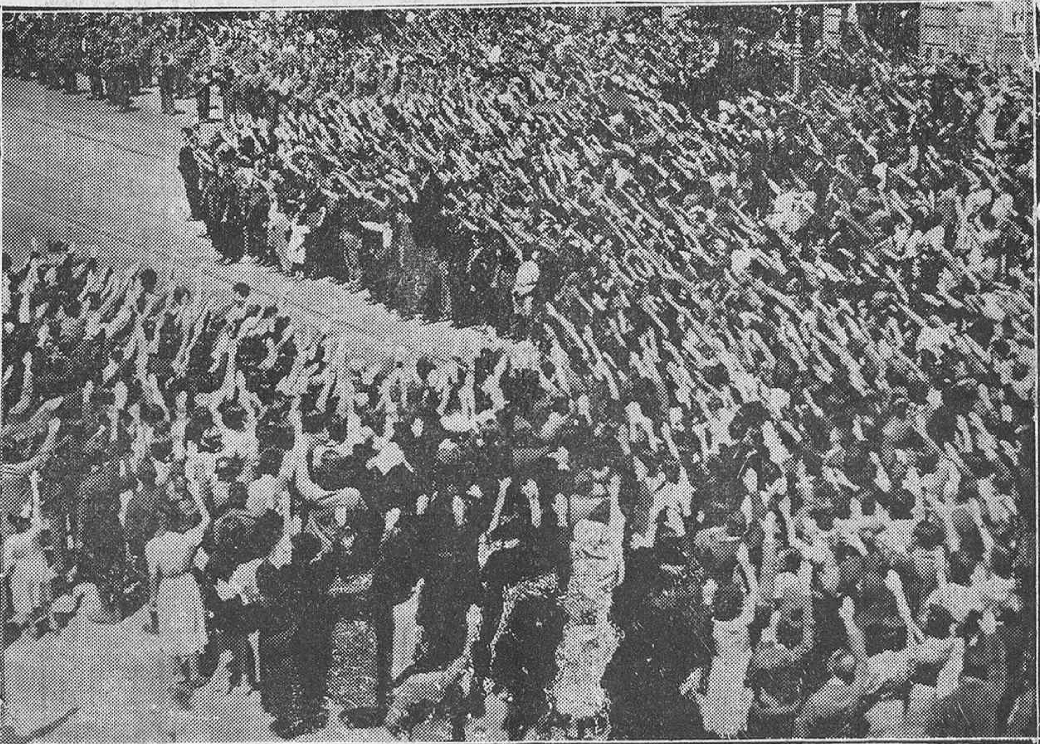
Miles de brazos extendidos saludan a la nueva España ante el palacio de la Diputación de Vizcaya, donde las autoridades son frenéticamente ovacionadas por el inmenso gentío que llenaba la Gran Vía de Bilbao con motivo de los actos celebrados en esa capital el domingo último. (Foto PENSAMIENTO ALAVES).