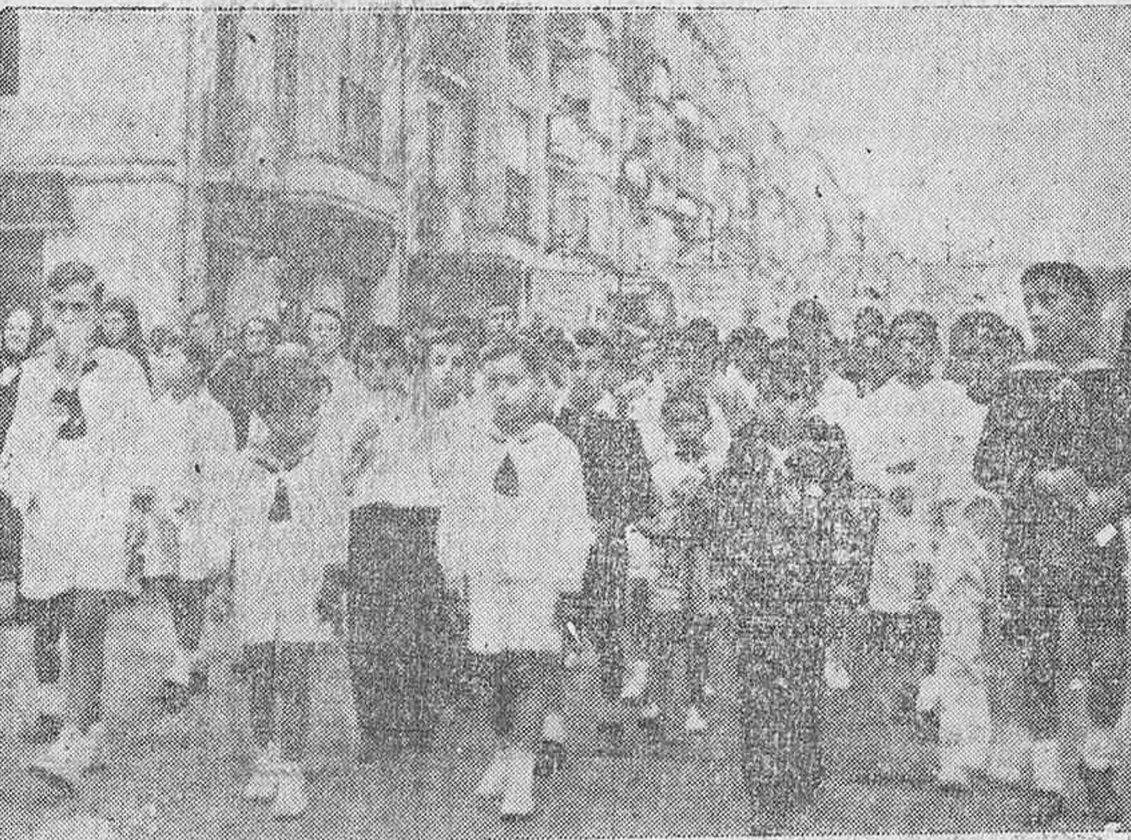
Un grupo de niños en la procesión de ayer. (Foto Ceferino).