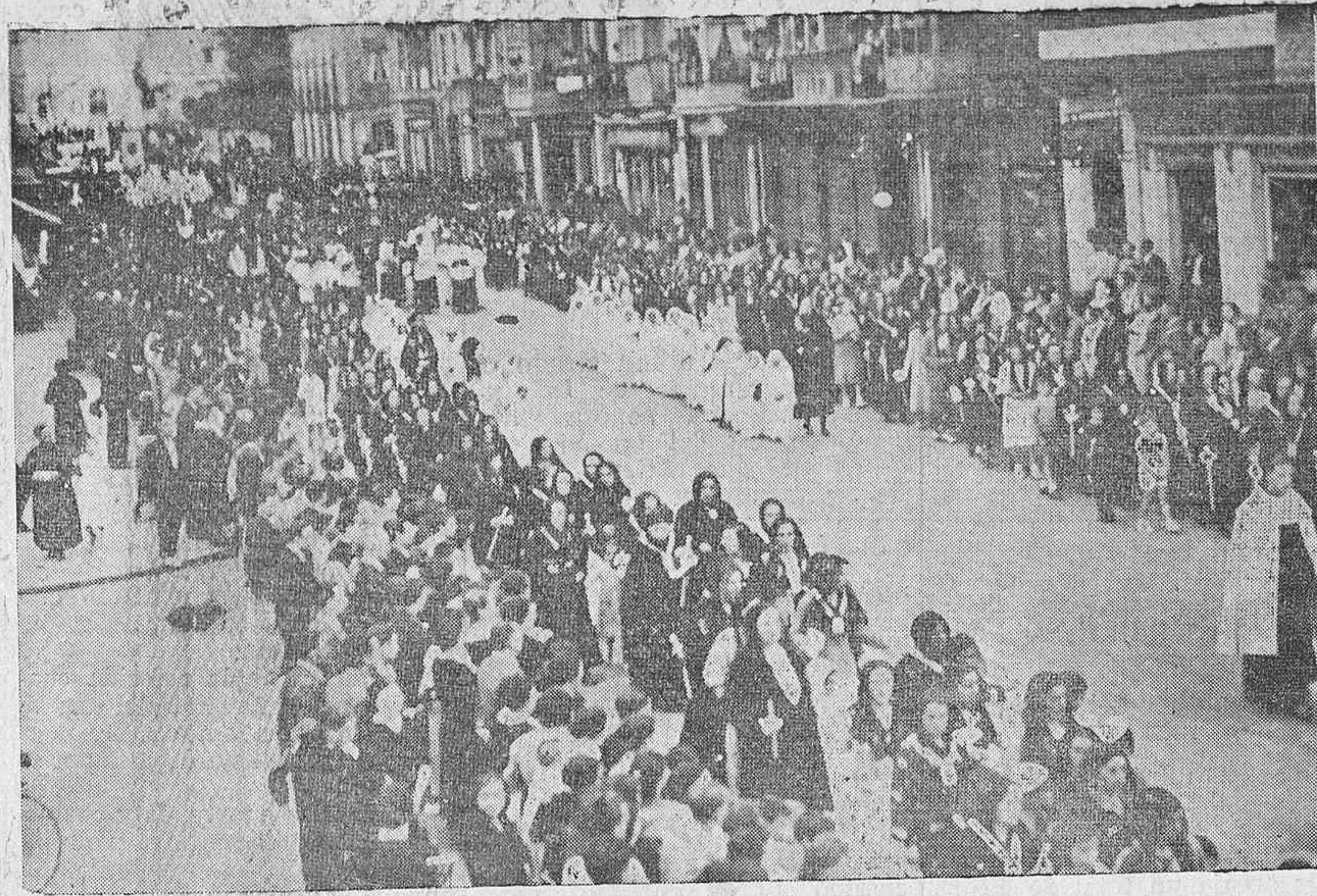
Un detalle de la procesión de ayer, a su paso por la calle de Dato.