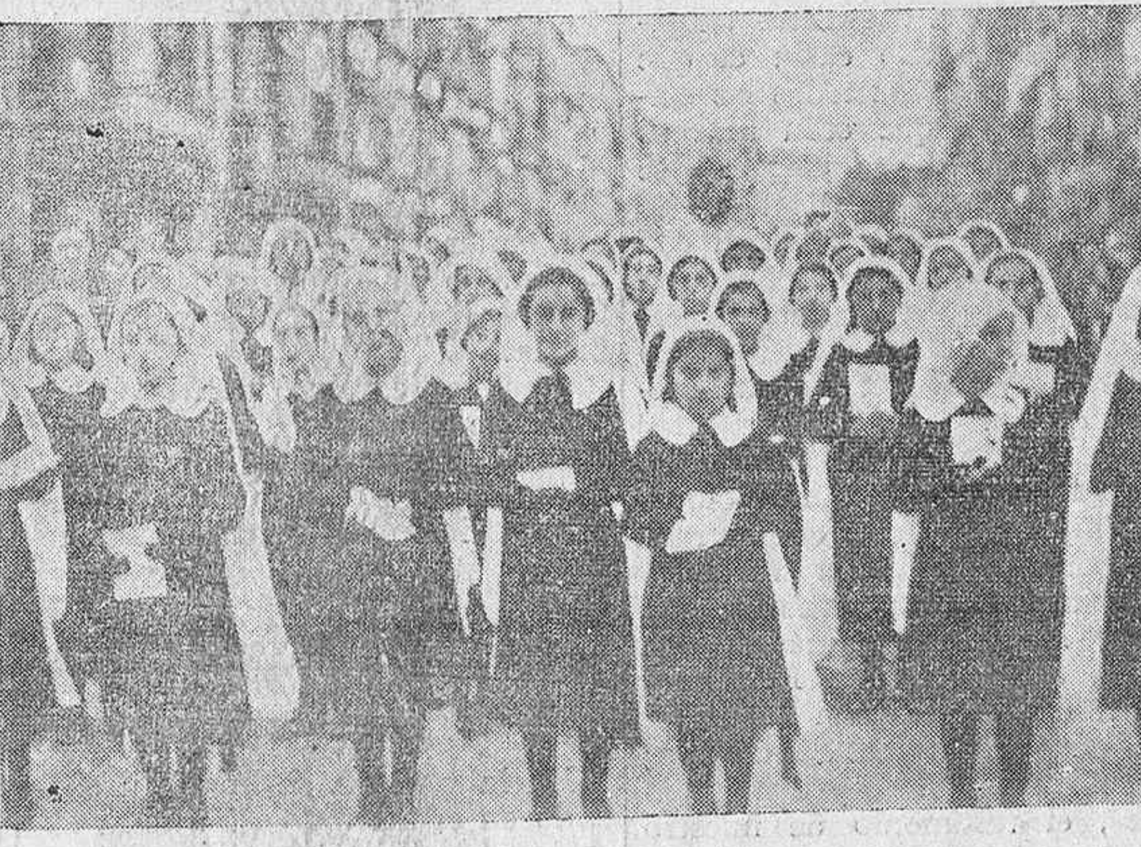
Las niñas del Colegio del Sagrado Corazón de Jesús, en la procesión de ayer.