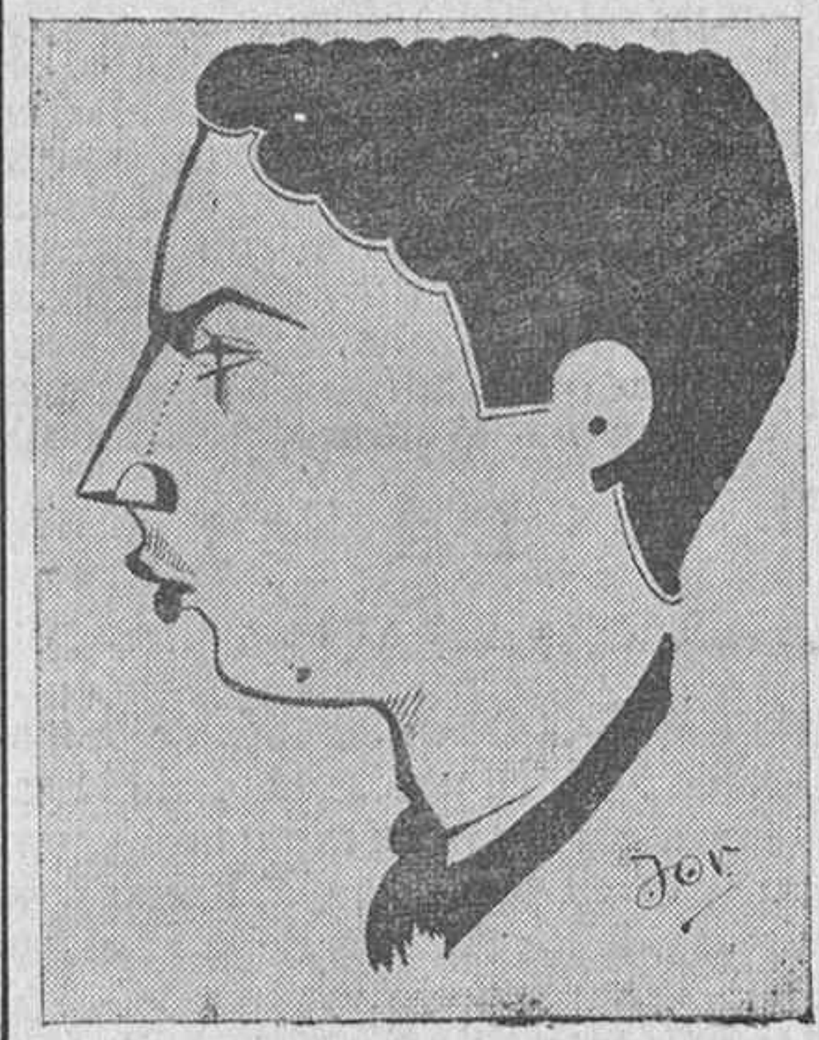
'El Bedel', visto por J. O. V.

quista fué una obra española, comprendiendo con este nombre también a los portugueses, pues tanto en éste como en otros importantes hechos, solos se encontraron los españoles.