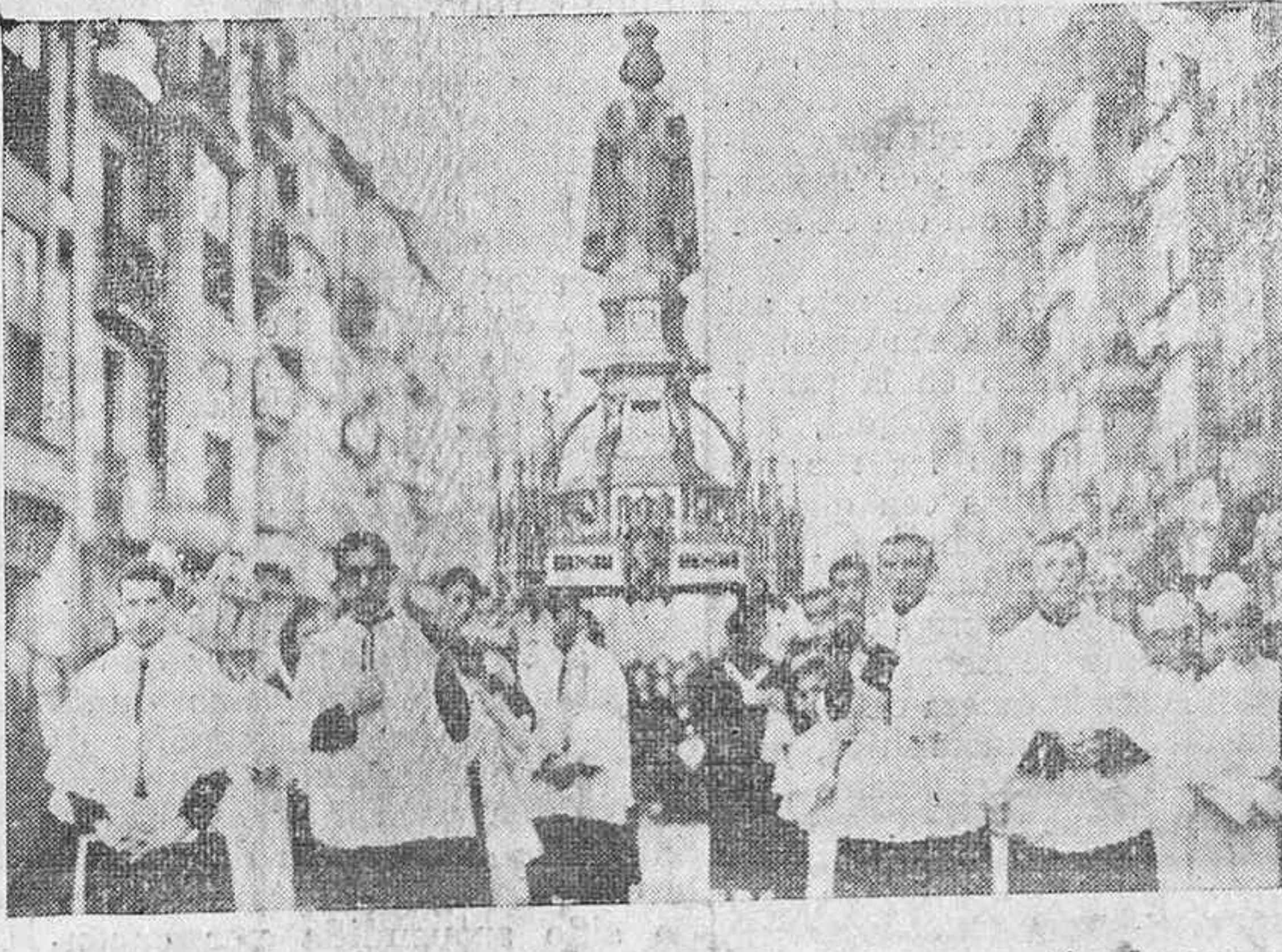
La imagen del Niño Jesús de Praga, en la procesión de ayer. (Foto Ceferino).

URQUIOLA OCULISTA Calle DATO, 8, 1.ª Dcha.