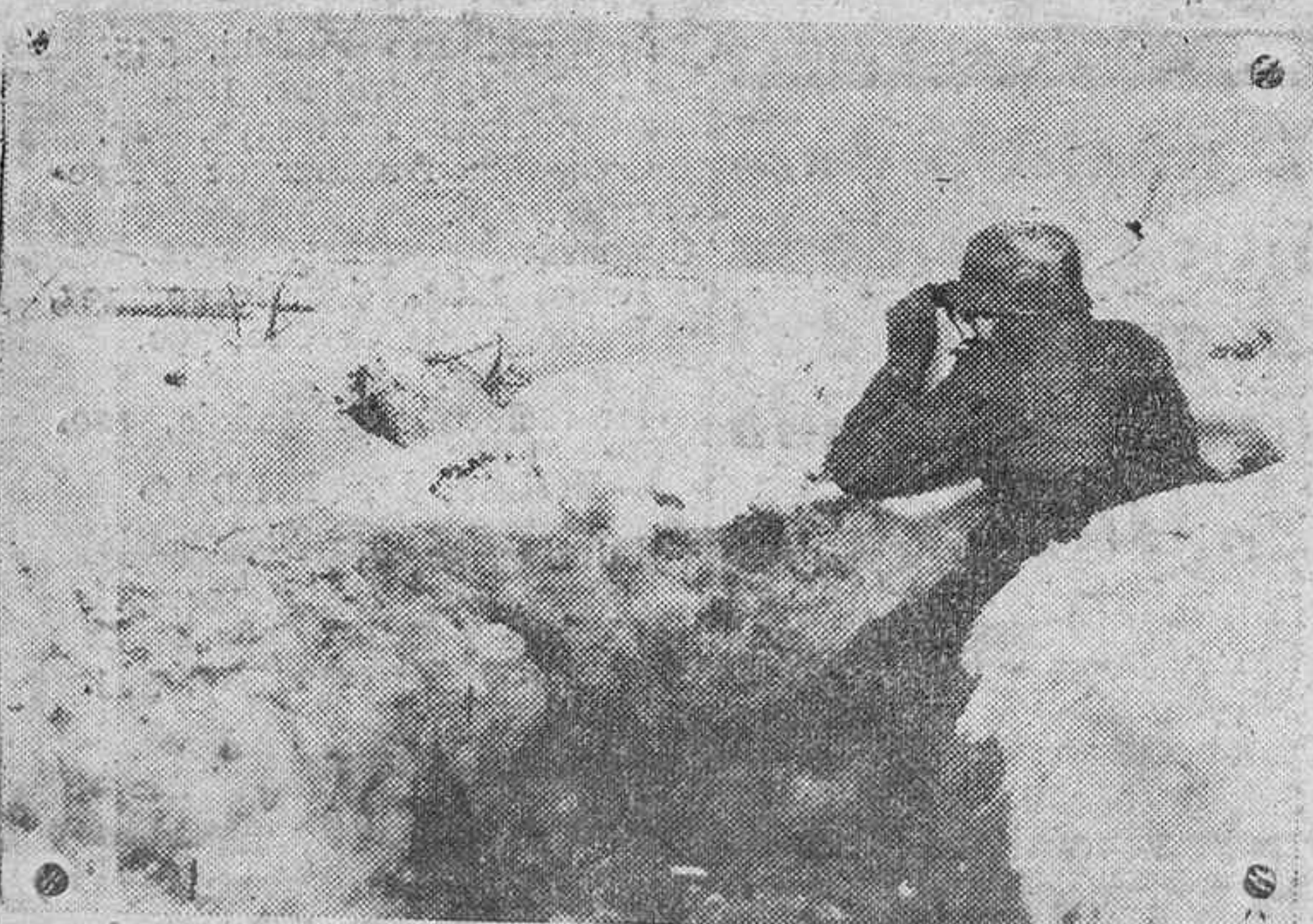
Desde un grupo de trincheras se observan las enemigas para conocer siempre sus actividades.

Tokio. —Un movimiento sísmico, registrado en la mañana de hoy en esta isla japonesa, ha producido graves daños y unos 160 muertos y 164 heridos. —Efe