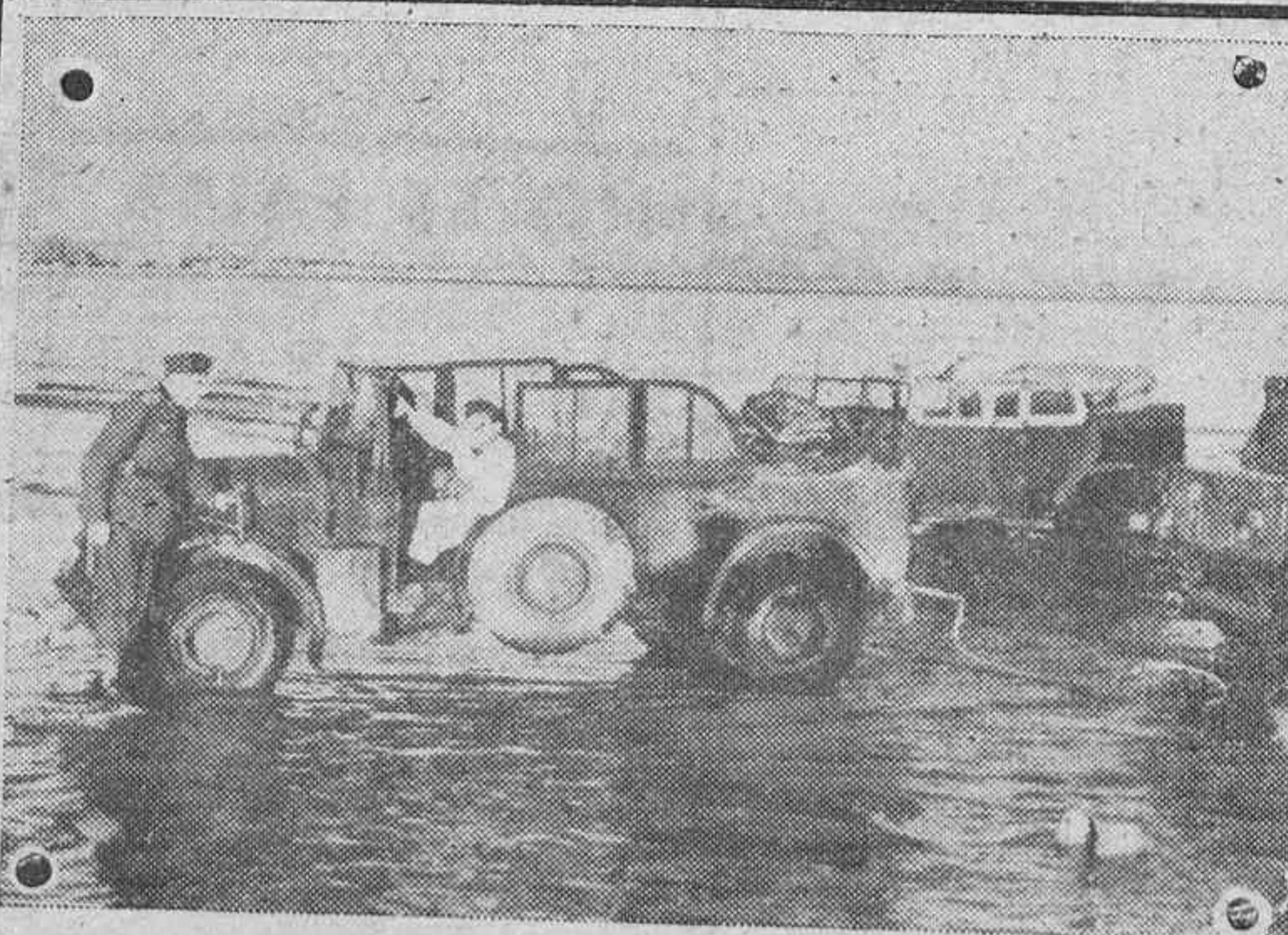
Soldados alemanes limpiando sus coches que han realizado una buena marcha.