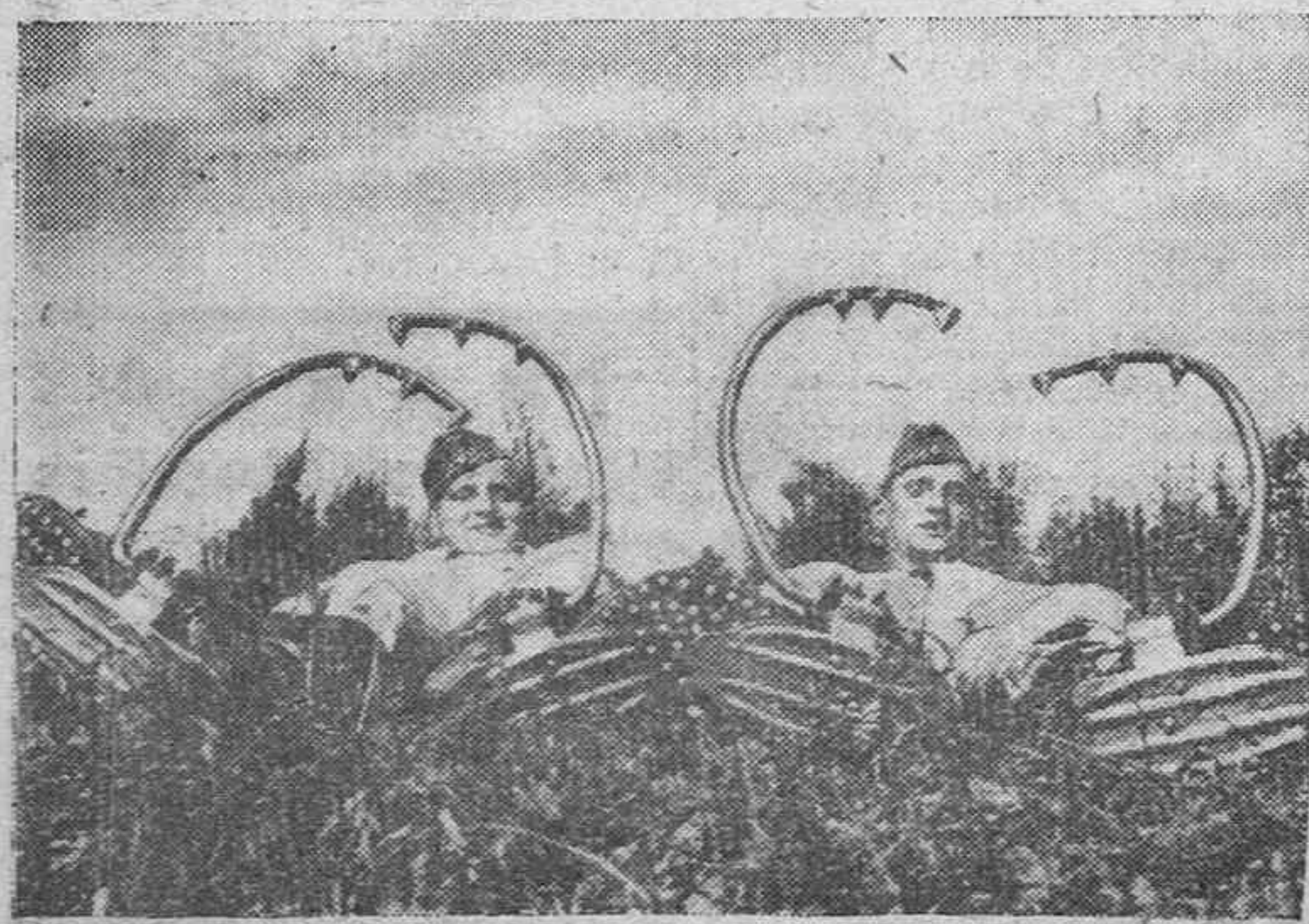
La primera mirada a esta foto nos produce la sensación de un extraño animal. Pero no son más que dos soldados alemanes de transmisiones en Rusia, que con sus garfios causan esta curiosa impresión

Lector: Haced vuestras compras y solicitud los servicios de los anunciantes de este periódico.