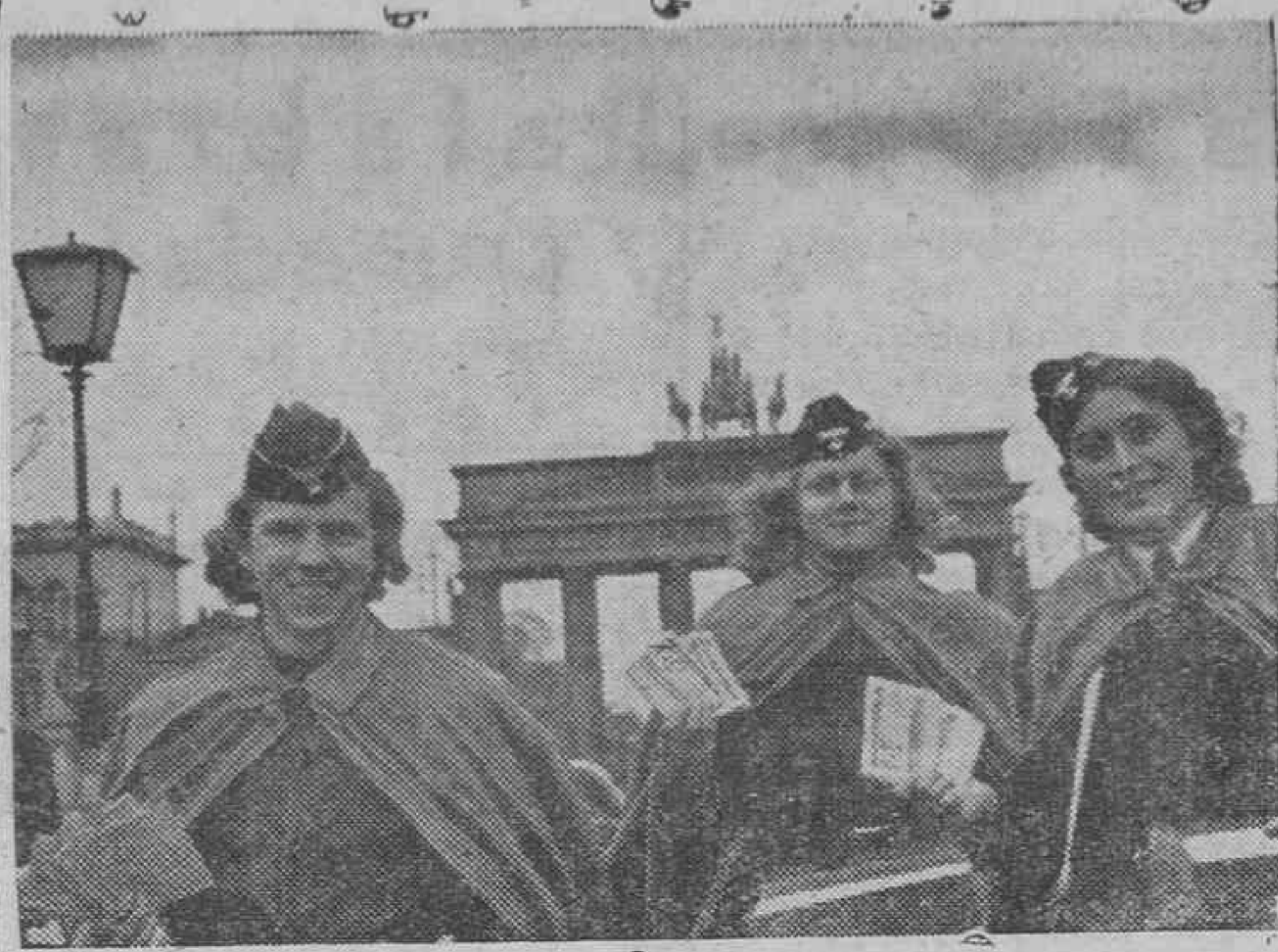
Jóvenes alemanas de la obra Auxilio de Invierno en un día de reparto de billetes de la lotería benéfica de esta organización, que tanto éxito ha tenido últimamente.

Perteneció a la Redacción de "El Día Gráfico" y fue perseguido con saña desde la iniciación de la dominación roja en Barcelona. Estuvo condenado a muerte, pero logró evadirse de un modo audaz y casi novelesco y llegar a la España de Franco.—Cifra.