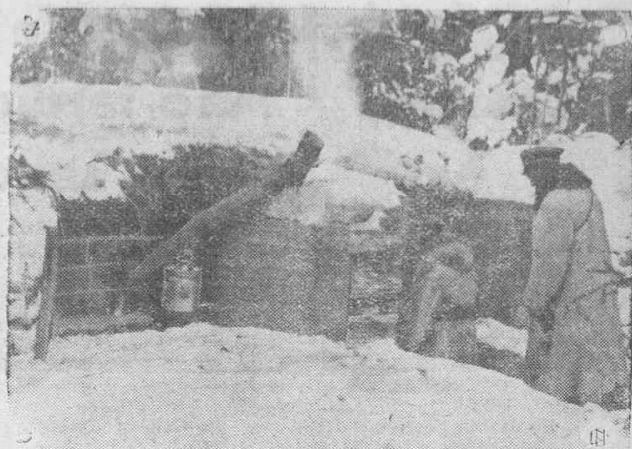
Refugio del puesto de mando de un batallón alemán perfectamente instalado y camuflado en un bosque del frente del Este.

Roma.—El comunicado italiano da cuenta de haber sido rechazados los destacamentos de exploración ingleses al sureste de El Mekili. Las concentraciones