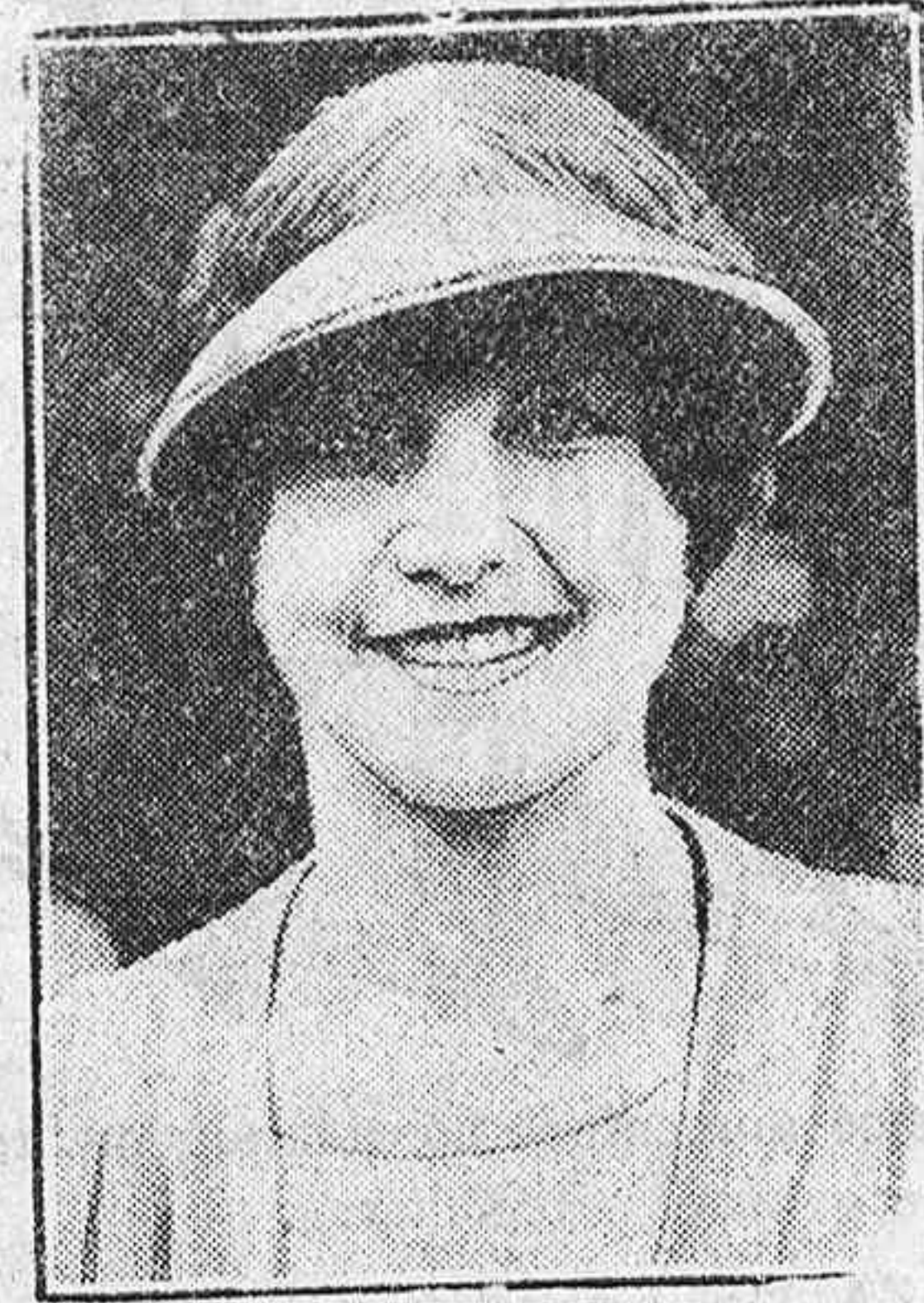
La famosa jugadora de tennis Helen Wills, ahora señora de Moody, ha llegado a París para asistir a las famosas competiciones de Croix Catalan.