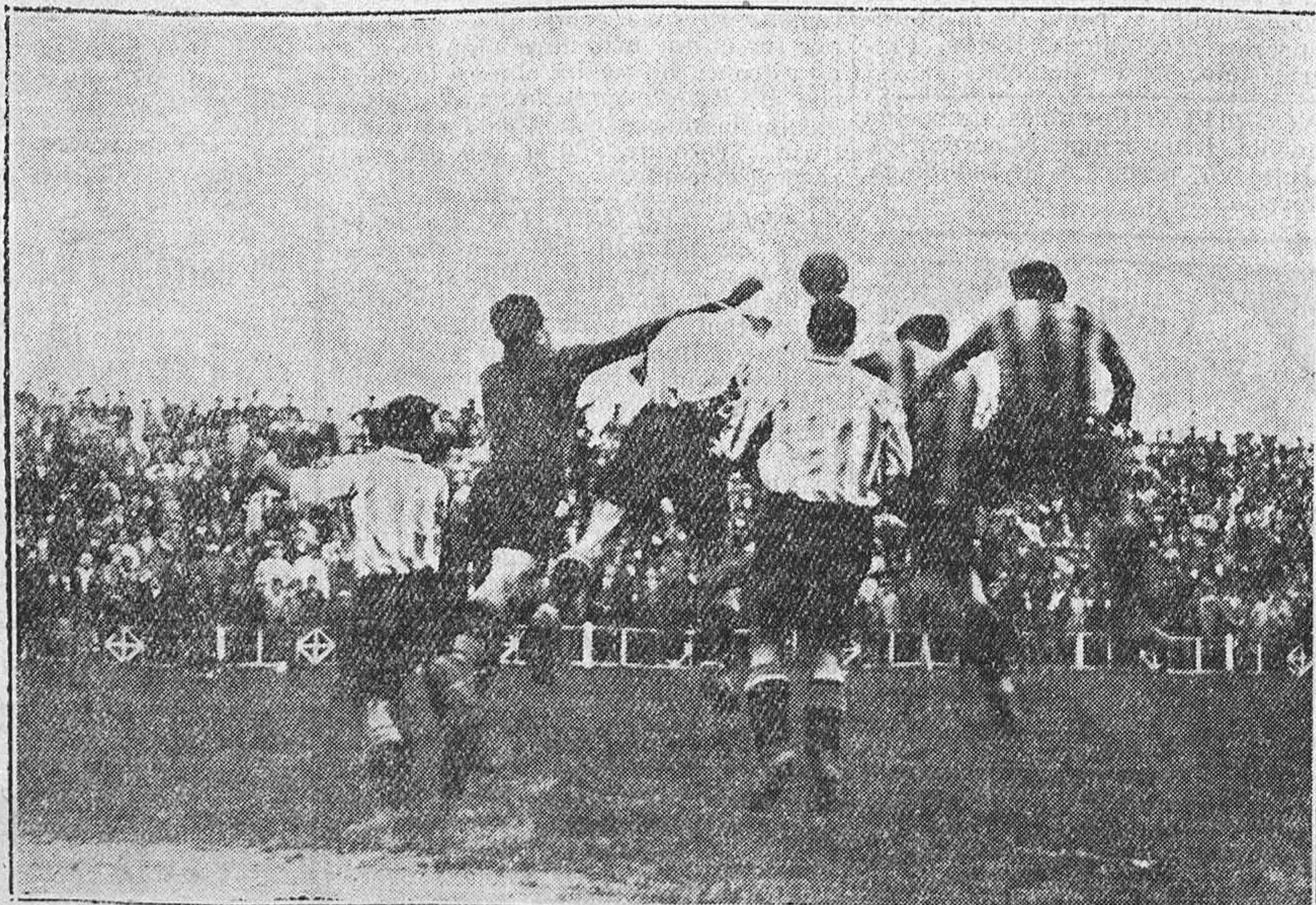
BERISTAIN Y QUINCOCES DESPEJANDO UN CENTRO