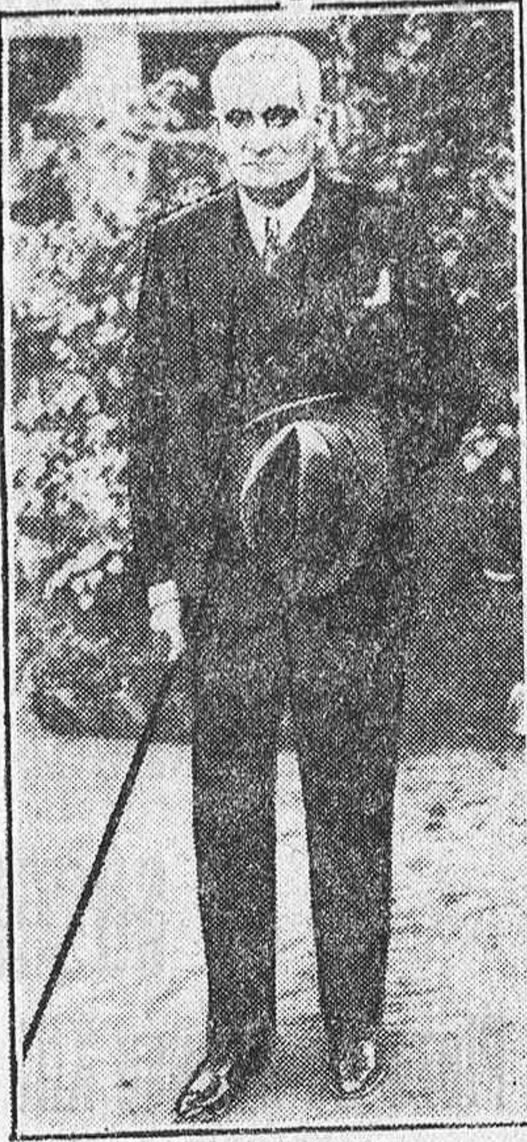
Francia y el Afghanistan

INDEPENDENCIA, 7, 1º (Frente a la Plaza de Abastos)