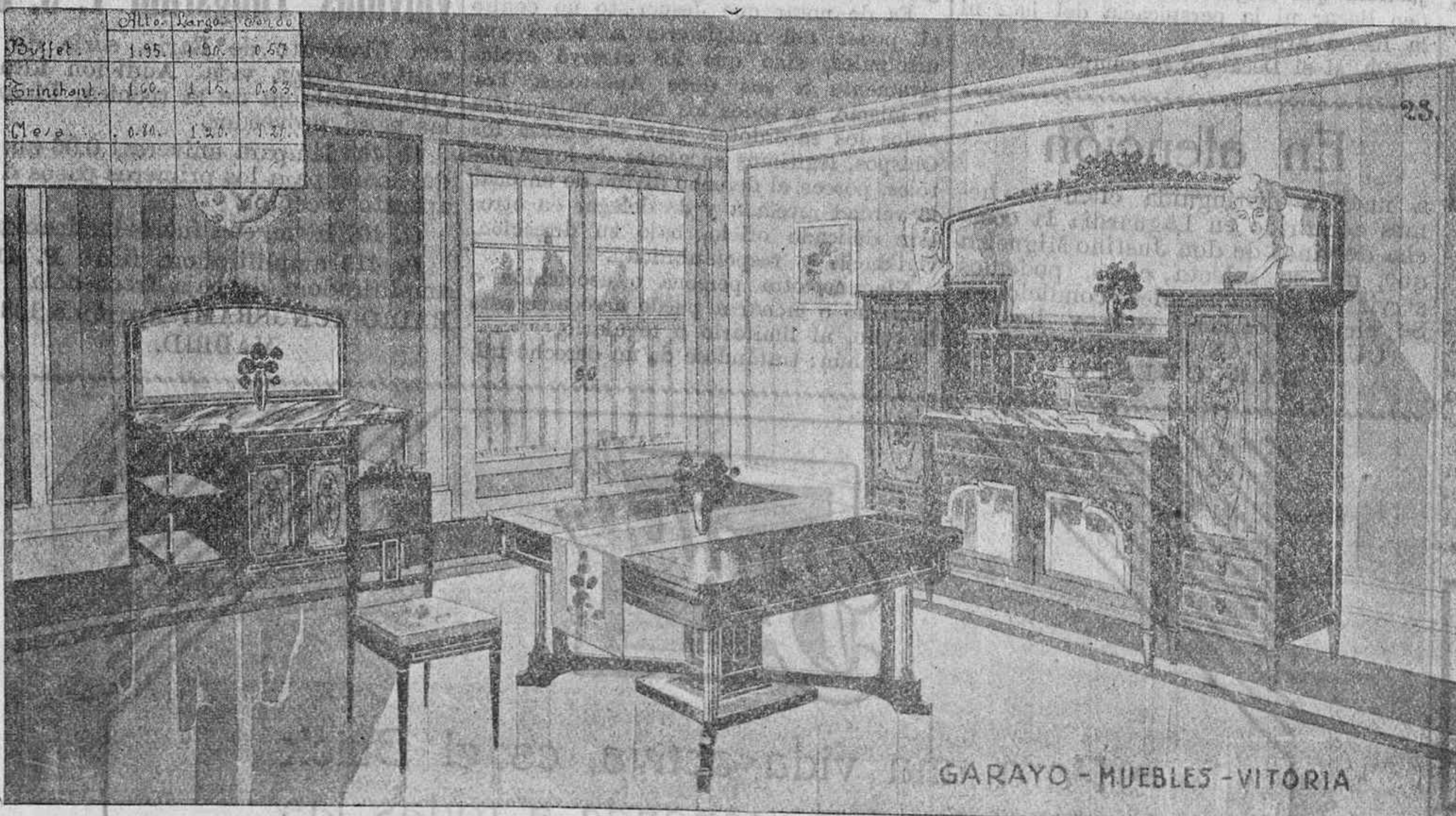
GARAYO - MUEBLES - VITORIA

Despachos, comedores, alfombras, gabinetes, aparatos de luz, etc., etc.