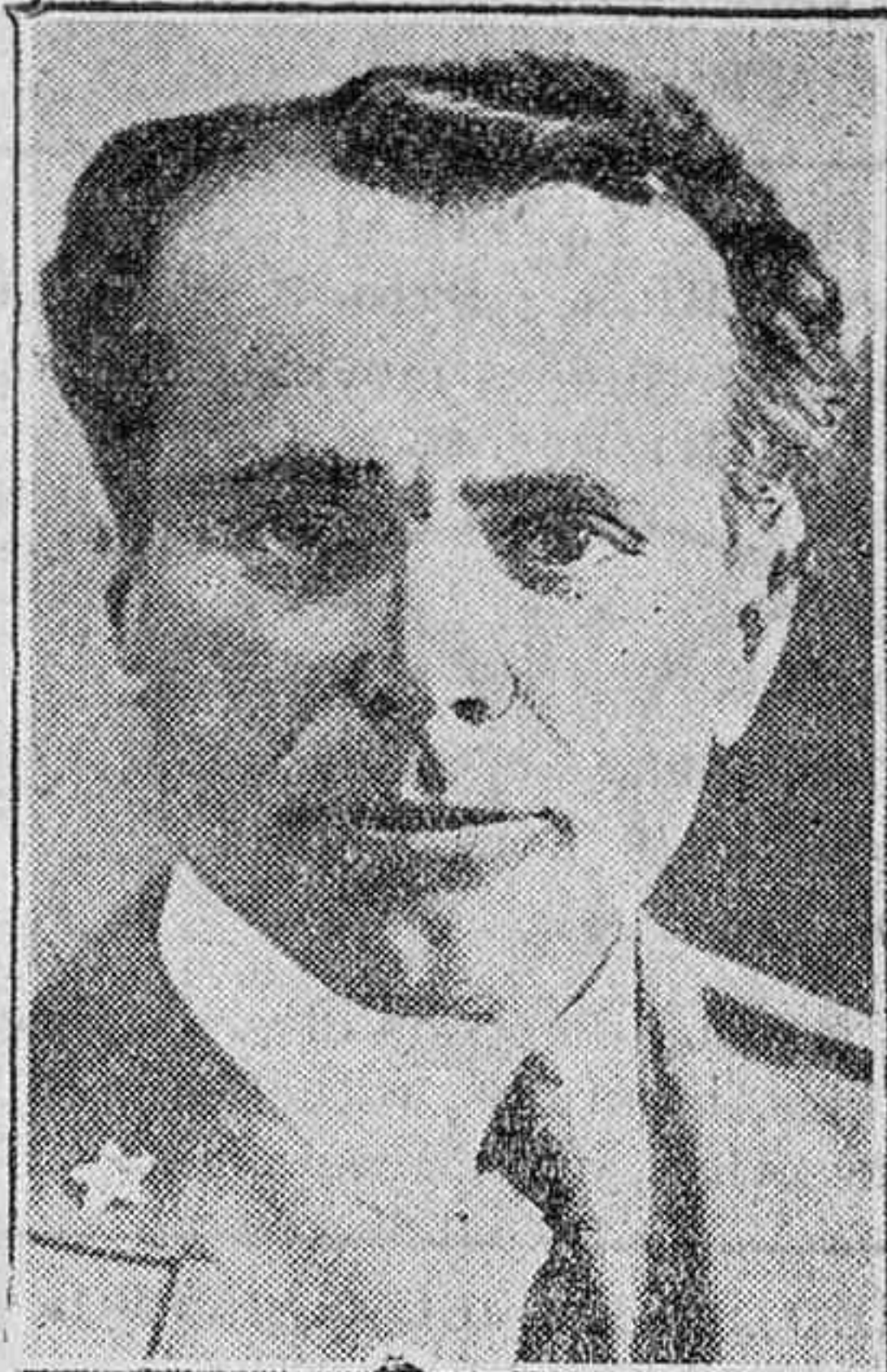
EL GENERAL NOBILE jefe de la tripulación del «Italia», que se halla herido en un brazo y una pierna.

NOTAS DE AMPLIACION En el Consejo se ocupó Primo de Rivera de una combinación de Gobernadores que venía preparando en diversas conferencias con Martínez Anido, sin que queda a definitivamente aprobada, pues falta todavía algún nombre que se