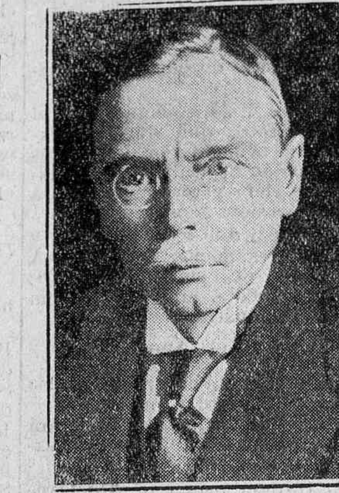
El general von Seckt, antiguo ministro de la guerra alemán, que acaba de ser nombrado embajador de su país en Londres.

EL VAPOR NORUEGO «BRAGANZA» CON AVIONES A BORDO AVANZA HACIA EL ESTE OSLO.—El sabio noruego Hoel, pro-