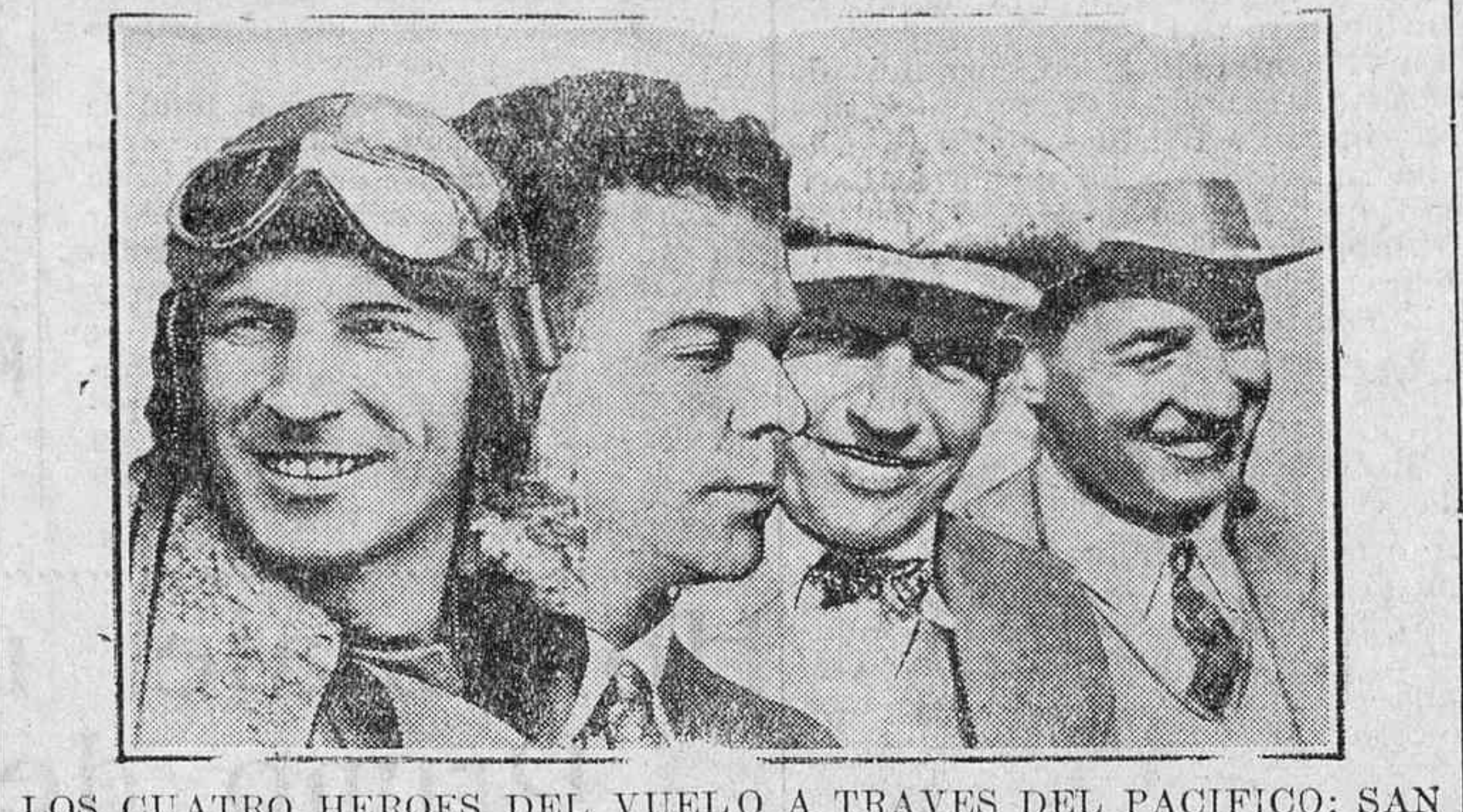
LOS CUATRO HEROES DEL VUELO A TRAVES DEL PACIFICO: SAN FRANCISCO - BRISBANE.

ONDULACIÓN PERMANENTE completa y perfecta 25 pesetas. CASA CALVILLO Dato, 21 En Madrid, por este año, creo que no se desestera, que el verano es un engaño; Bien. Pues CHOCOLATE EZQUERRA