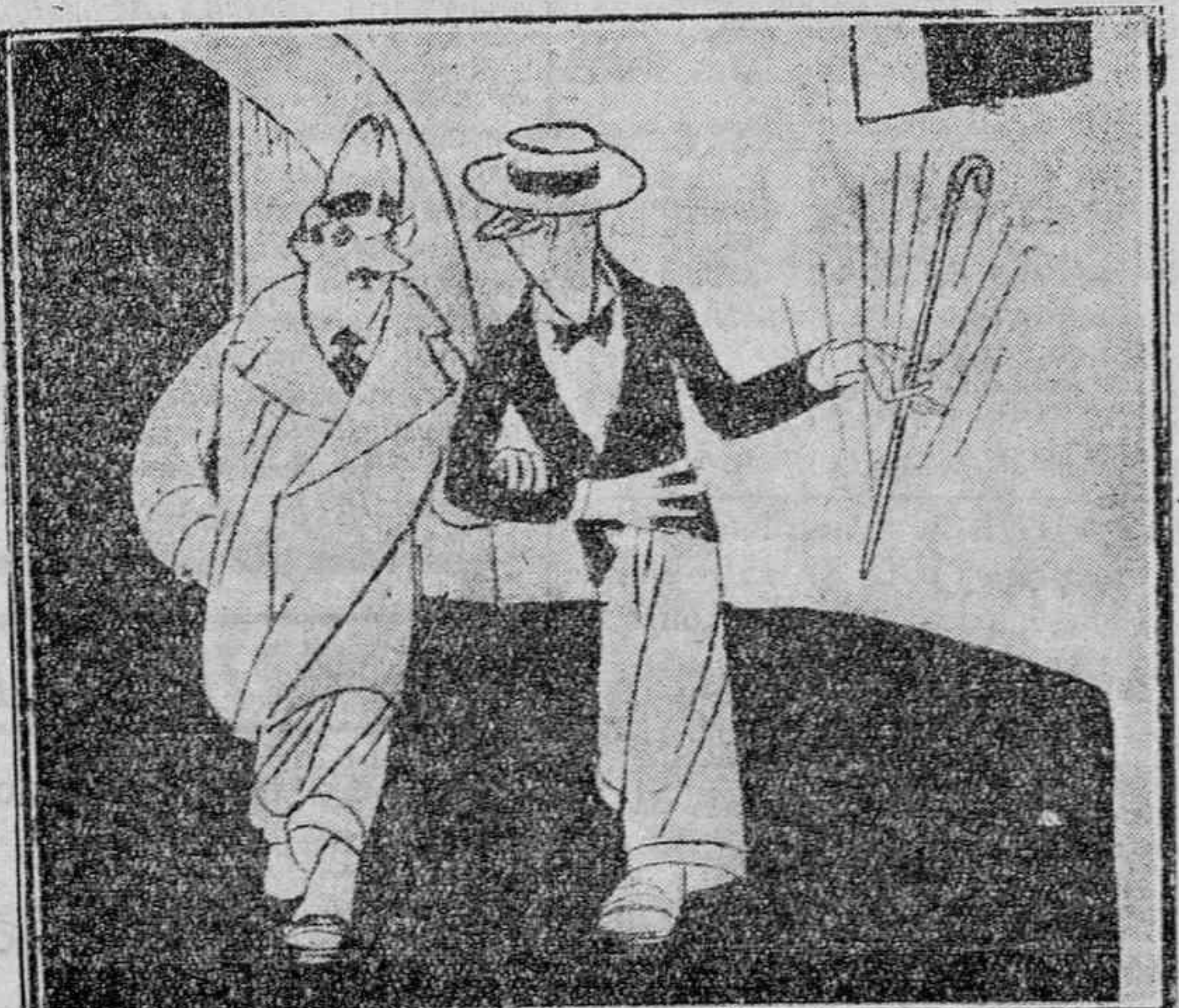
EL HUMOR AJENO —He descubierto un específico; pero no sé cómo hacerle propaganda gratis. — Hombre!, muy sencillo. Cuéntaselo a tu mujer.

Se hace saber al público que el despacho ordinario de la Presidencia, Comisión Provincial y Oficinas, es por la mañana de OCHO A UNA. En casos de necesidad o urgencia, natural y obligadamente, todos están a la disposición y servicio de todos en cualquier lugar y momento. Las horas indicadas, se han establecido en términos de normalidad, con el fin de que el resto del tiempo útil, los señores Diputados y empleados de la Casa, puedan atender más ordenada y sosegadamente al estudio y resolución de los asuntos de su incumbencia.