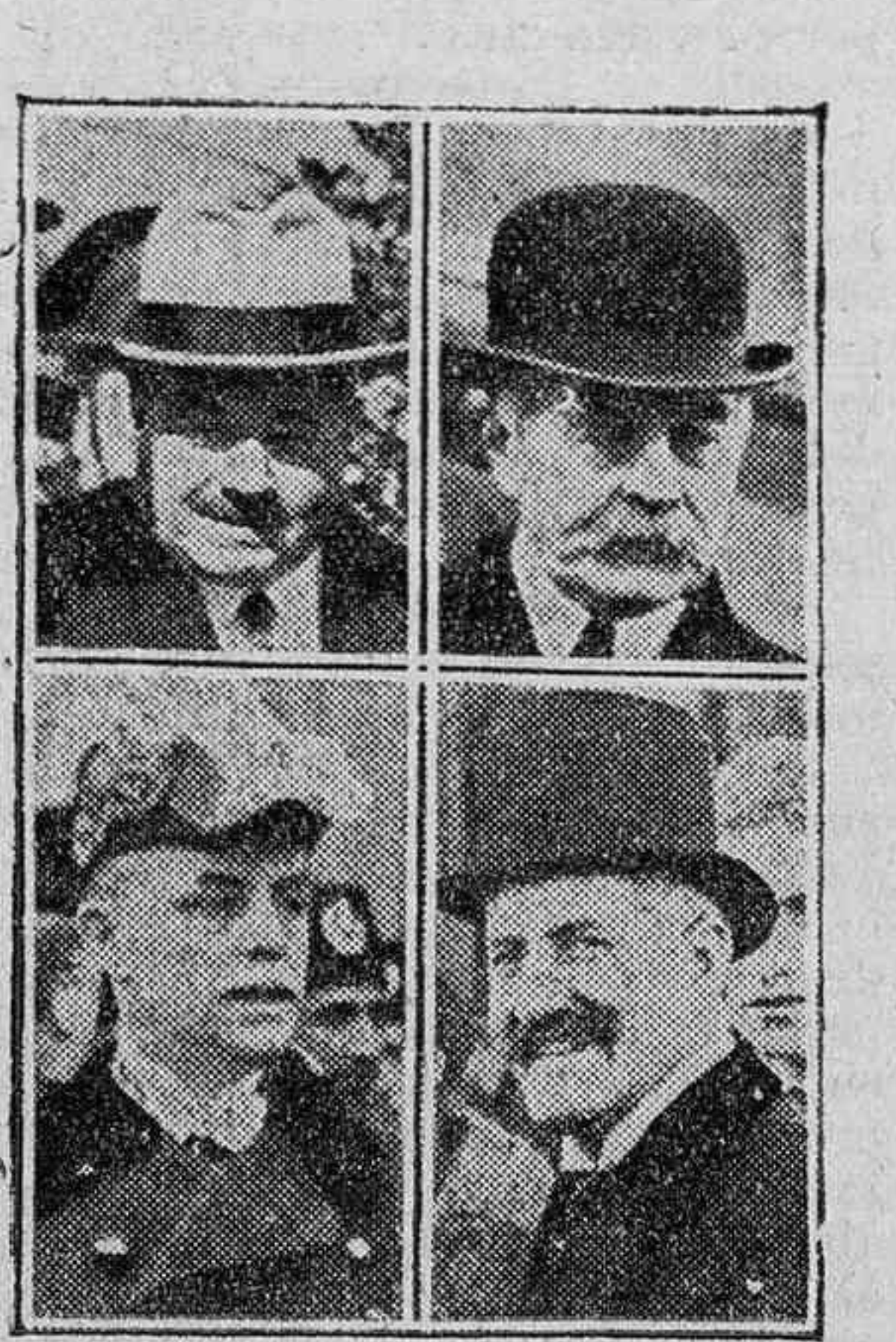
LA CONFERENCIA SOBRE TANGER Fotografía de los cuatro representantes que asisten a esta conferencia. Arriba: de izquierda a derecha, Quiñones de León, Lord Crewe, Abajo: Mauzoni y Philippe Berthelot.