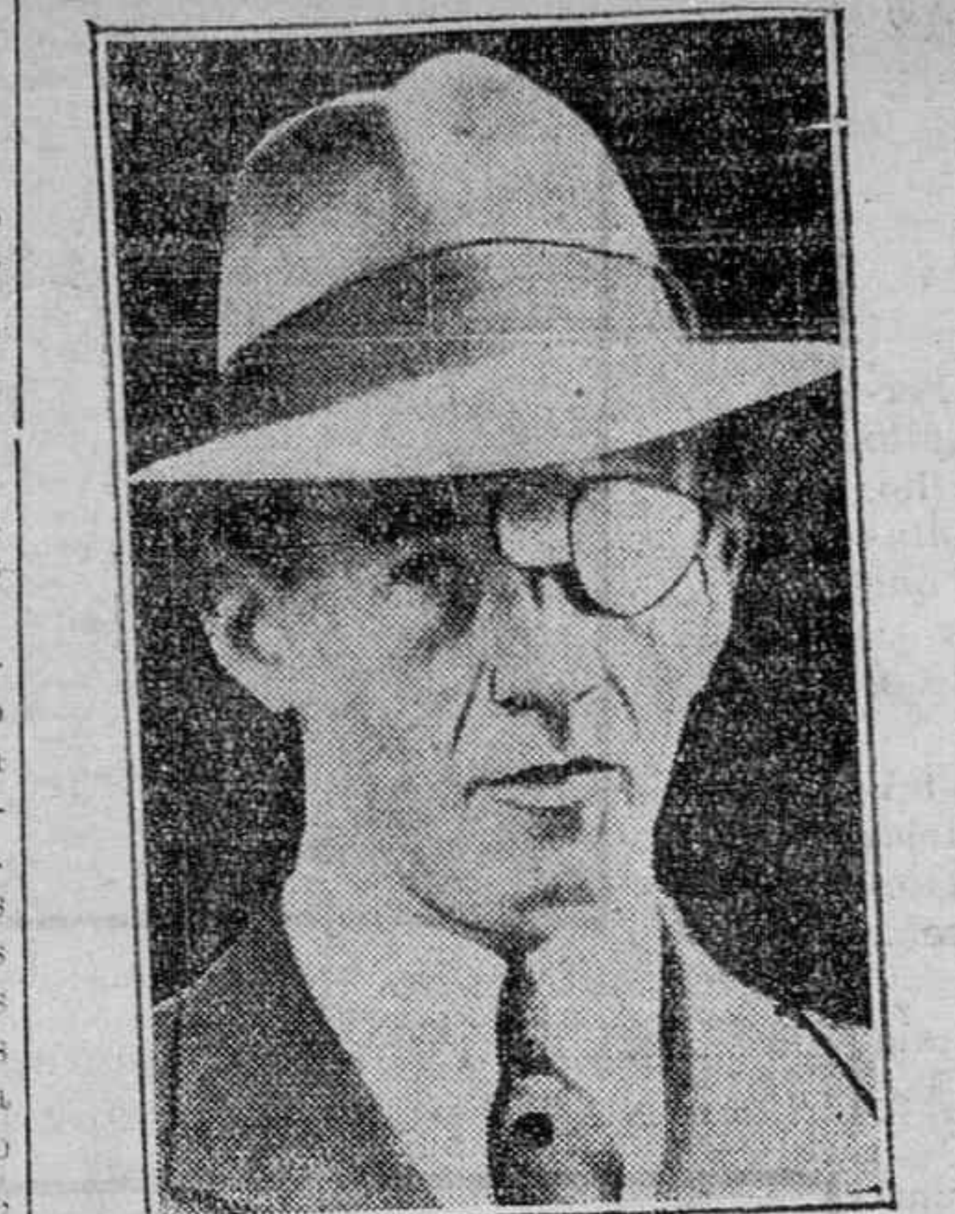
HINCHCLIFFE el piloto inglés cuyo paradero se ignora.

Resultado de todo esto fué que a los pocos años, a instancias de los señores Obispos, y súplicas elevadas por la M. R. M. General, El Prefecto de la Sagrada Congregación de Obispos y Regulares, Cardenal Gotti, después de haber amablemente alabado y recomendado, el la Congregación de las Bernas Mercedarias de la Caridad, el Santísimo Padre Papa León XIII concedió el Decreto Pontificio aprobando el Instituto y sus Constituciones, en la fecha memorable de 24 de abril de 1901.