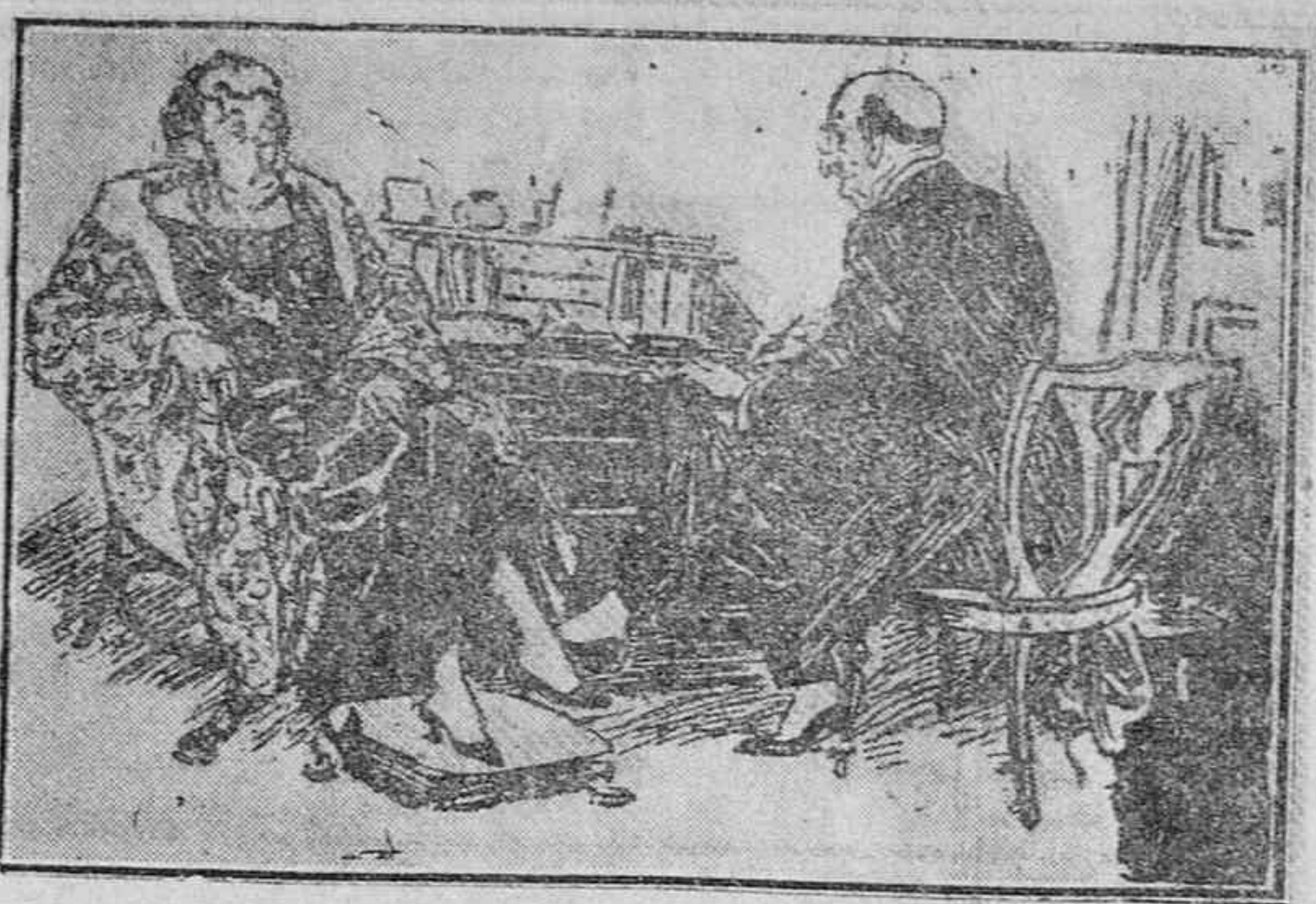
EL MEDICO (escribiendo la receta): —Usted tomará esta medicina cada cuatro horas. LA SENORA (nueva risa): —Doctor, le advierto que nuestros recursos nos permiten tomarla con mayor frecuencia.

MEDICINA EN GENERAL LABORATORIO DE ANALISIS CLINICOS CONSUTA DE 3 A 5 M. IRADIER, 24, 1.º