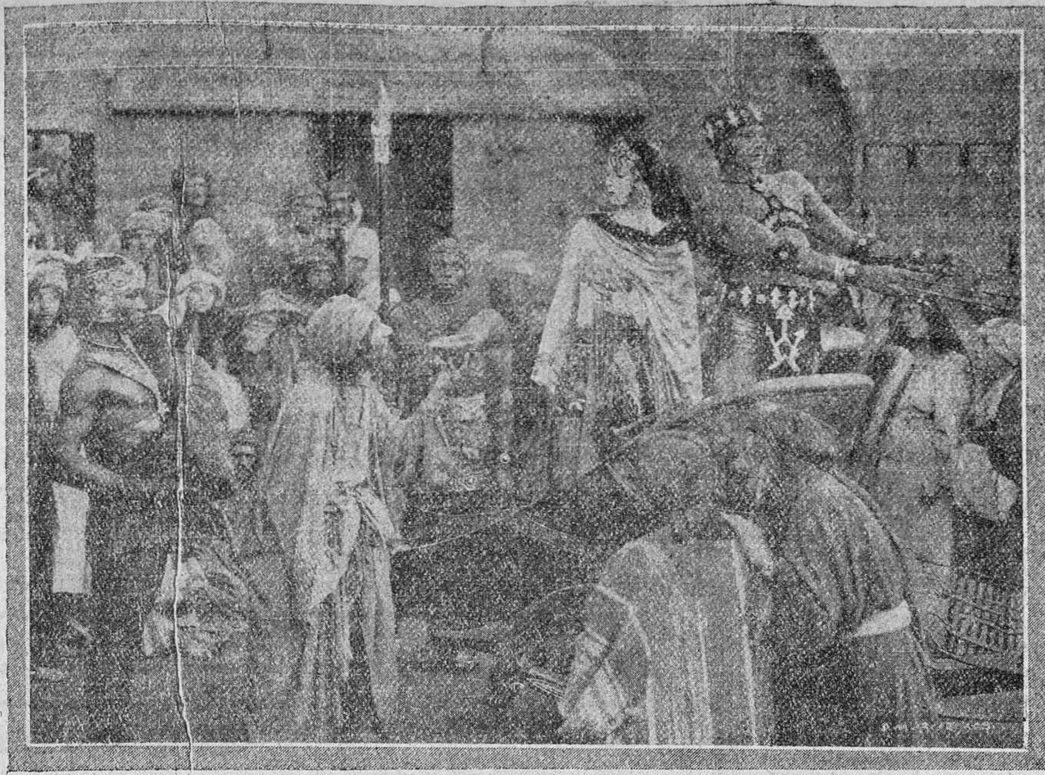
JACQUELINE LOGAN, EN SU PAPEL DE MARIA MAGDALENA, SALE A PASEO EN SU COCHE TIRADO POR ZEBRAS, EN UNA ESCENA DE «EL REY DE REYES».