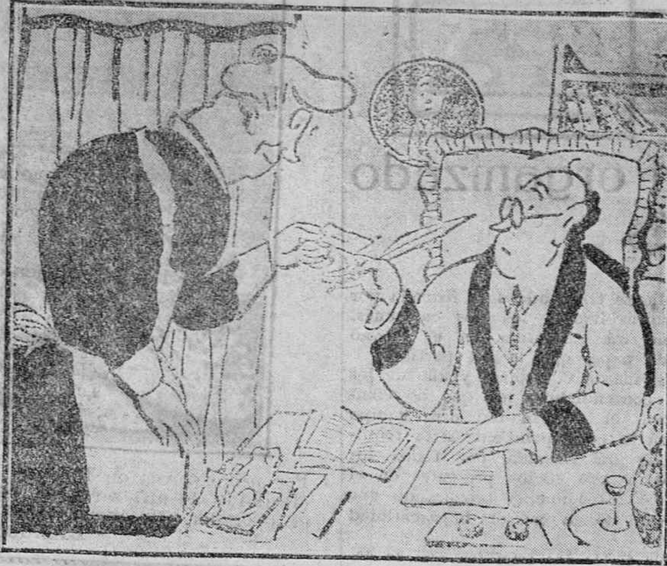
—No chivés que te dije que no estaba en casa si el visitante era algún pelma. —No, señorito; no lo es. Ya se lo he preguntado.

FUNERARIA «La Vitoriana» «Coronas» General Alava, 3 :: Teléfono 894