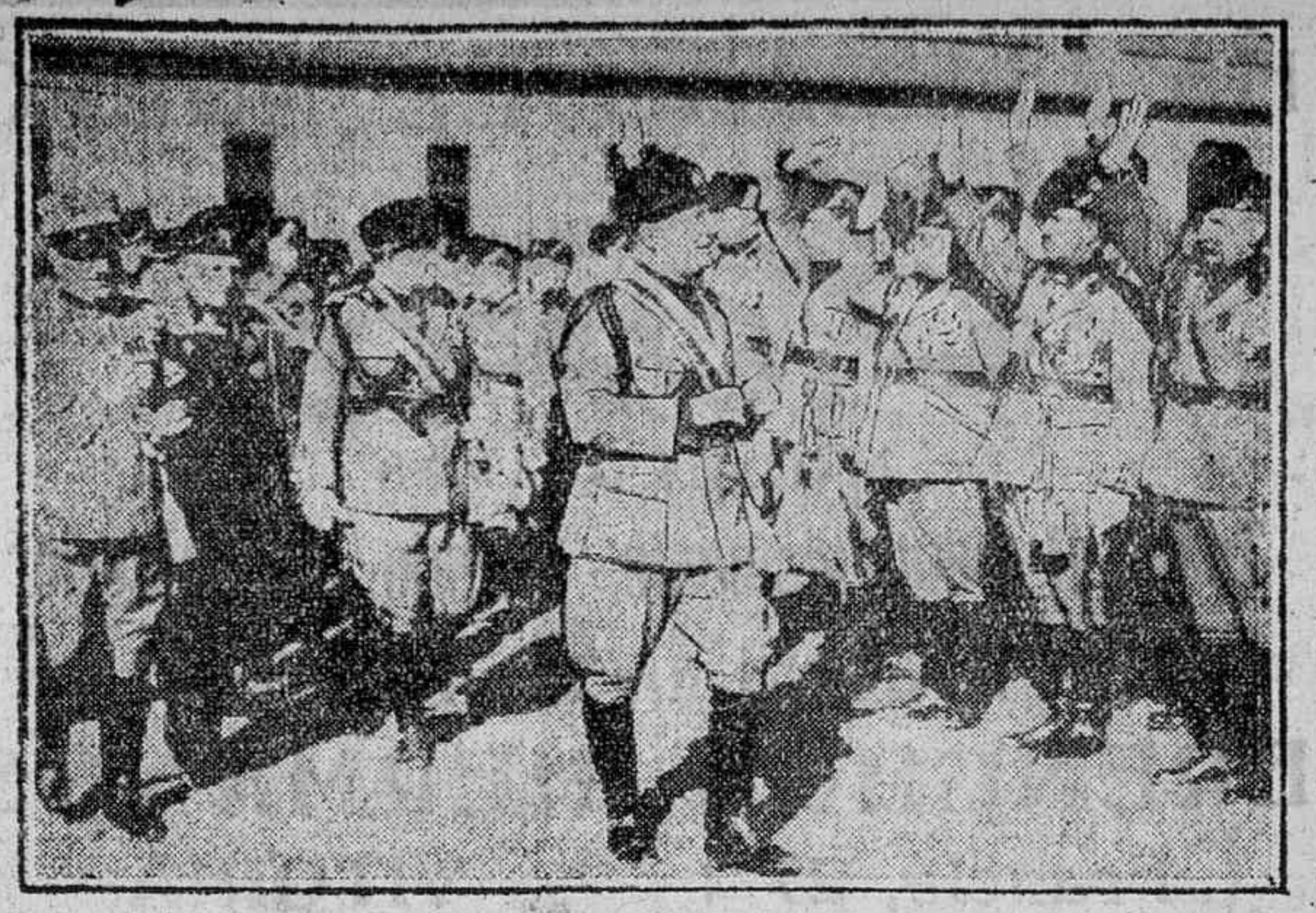
En el 5.º aniversario de la fundación de la Milicia fascista Mussolini ha pasado revista a sus subordinados y pronunciado energéticos discursos sobre esta organización.