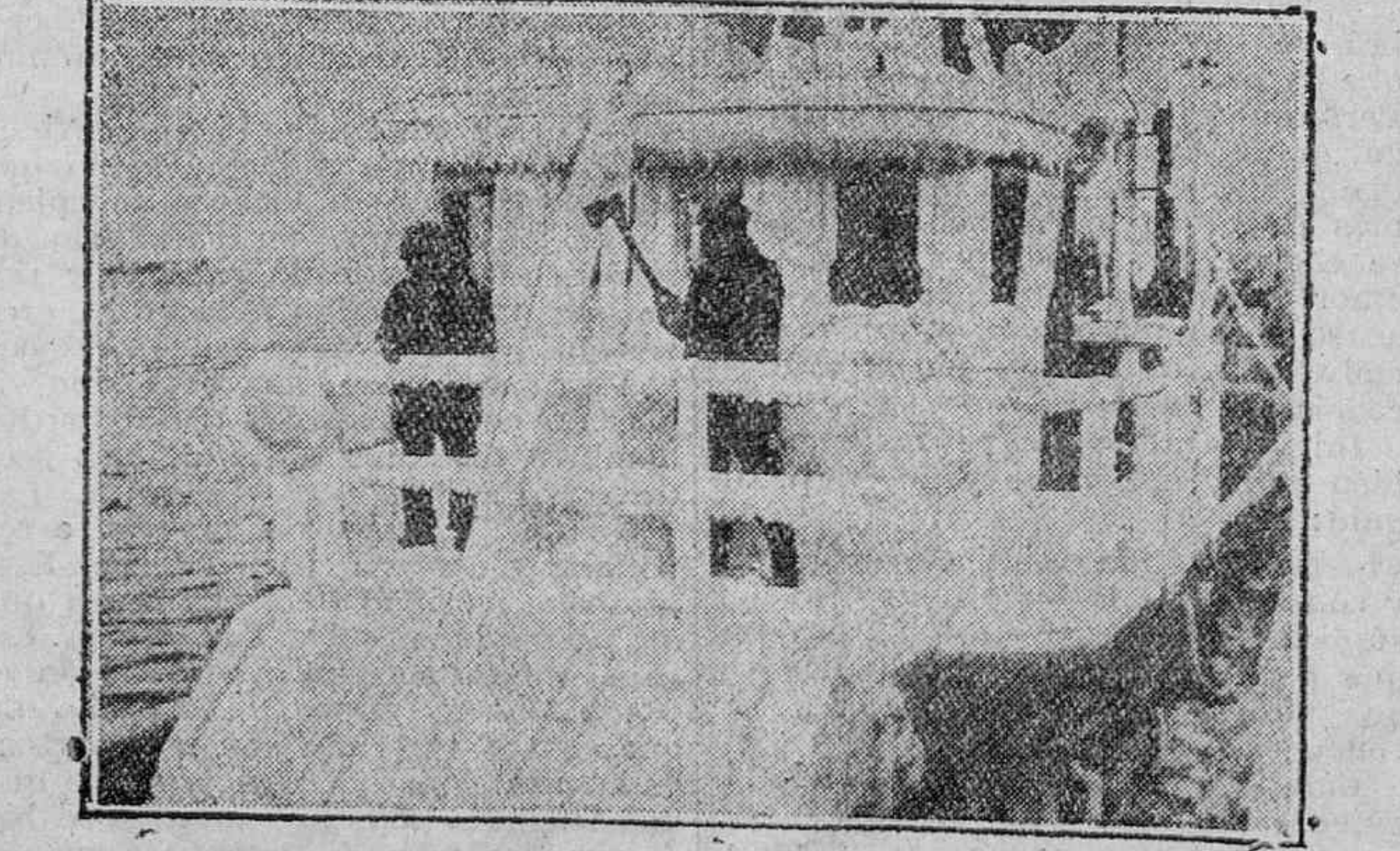
El pesquero «White Cap» entrando en el puerto de Boston después de una buena campaña de pesca en los mares de Terranova. El frío fué tan intenso que el barco estaba cubierto de una capa de hielo de un espesor de 35 cms.

Pídanse folletos y detalles en VITORIA, Constitución, 24, 3.º y San Prudencio (Prolongación) n.º 1.