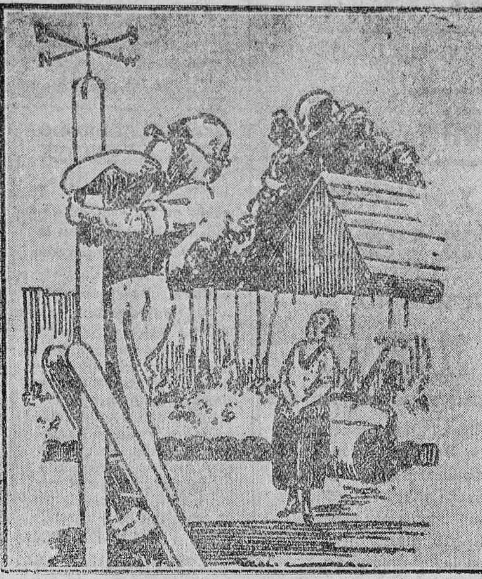
EL HUMOR AJENO