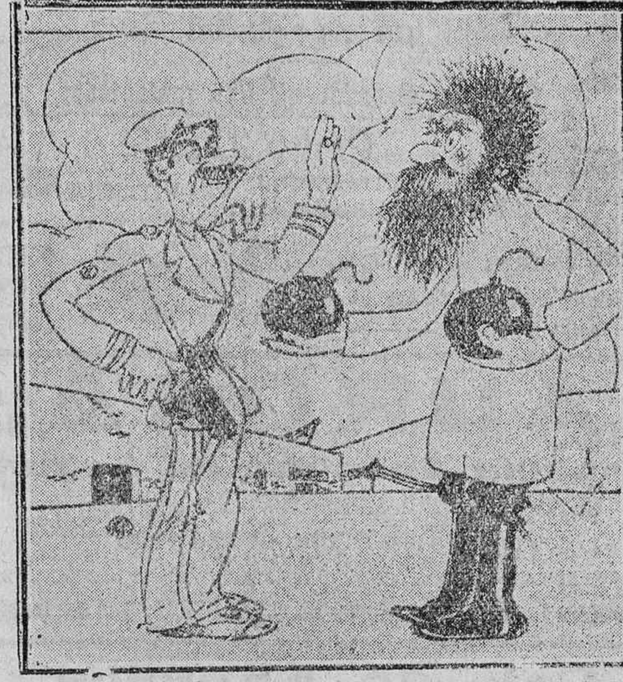
EL HUMOR AJENO