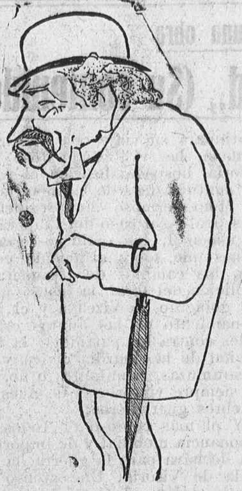
M. ARISTIDES BRIAND

Espera que Bilbao sabrá mantener este certamen y darle en lo sucesivo una mayor amplitud que