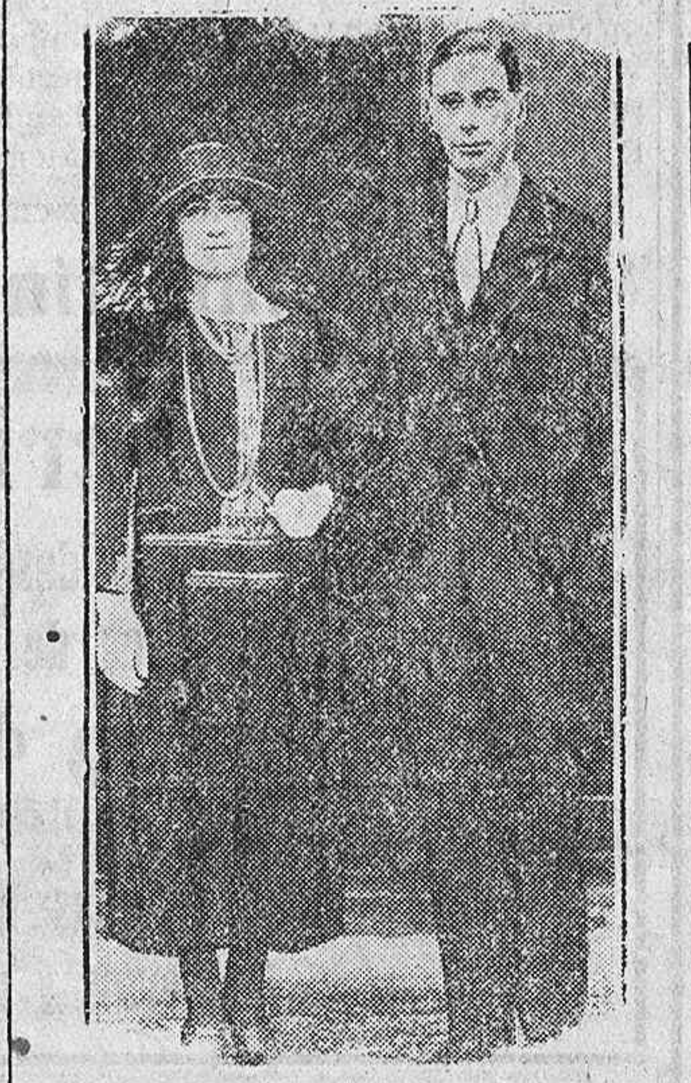
Los duques de York que con motivo del nacimiento de su primogénito, están recibiendo felicitaciones de todos los Estados del mundo.

PERIODO DE VACACIONES Cursillos intensivos para exámenes—próximo septiembre—Bachilleratos, Magisterio, Comercio. Repasos—capacitación, nuevos cursos. Cursillos abreviados—de junio a octubre—Idiomas, Cálculo Mercantil, Contabilidad, Mecanografía y Taquigrafía para escolares que deseen aprovechar el período de vacaciones.