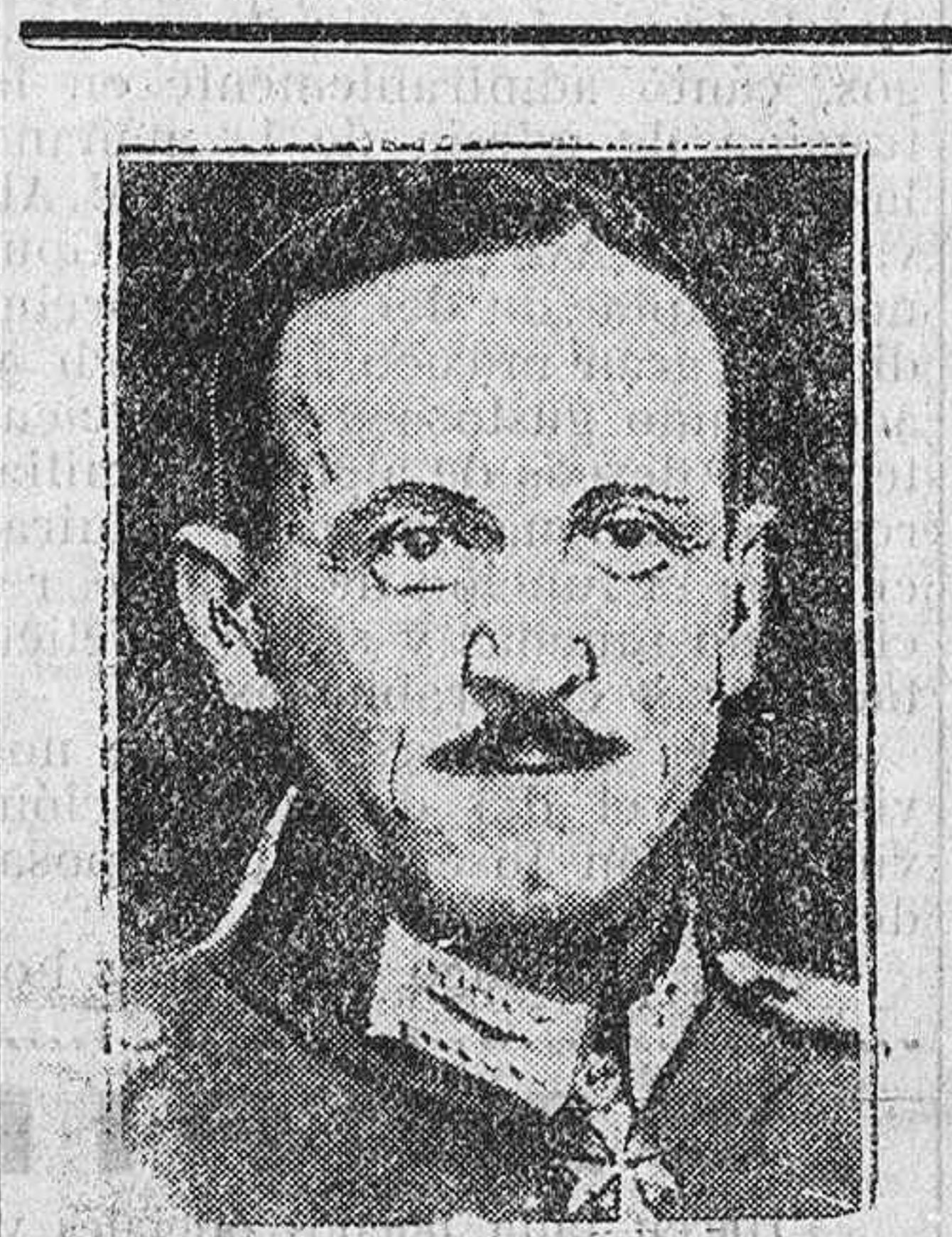
El general alemán Reinhardt, antiguo ministro prusiano de la agricultura, que acaba de fallecer a los 59 años de edad.

LAS AGUAS DE PEÑA BLANCA Al saludarle en su despacho nos dijo que extraoficialmente, sabía que las aguas de los manantiales de Peña Blanca se hallan en un estado de pureza inmejorable. Espera recibir mañana oficialmente el resultado del análisis realizado y lo dará a la Prensa. Con la utilización de estas aguas se aumentará el caudal en unos cinco o seis litros por segundo, lo que permitirá hacer frente al estiaje. De todos modos el señor Guinea está dispuesto a solucionar el asunto, probando durante el invierno la estación depuradora, colocando una estación de filtros o del modo más conveniente, pero siempre a base de una resolución definitiva.